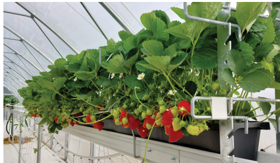
Bild 3 | Vid tunnelodling är själva bärplockningsarbetet snabbare och mer ergonomiskt än vid frilandsodling.

Välfungerande organisering av arbetet, utveckling av arbetsförhållandena och stöd för välbefinnandet på arbetsplatsen är centrala faktorer för att arbets-