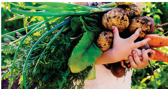
Bild 4 | En positiv inställning till vegetabilier och konsumtion av dem uppstår genom goda erfarenheter och smakupplevelser.

En ökad konsumtion av vegetabilier är önskvärd både med tanke på kostvanor och hållbarheten i livsmedelssystemet. För att främja konsumtionen är det viktigt att göra vegetabilier mer attraktiva i konsumenternas ögon samt att öka kunskapen och förståelsen för