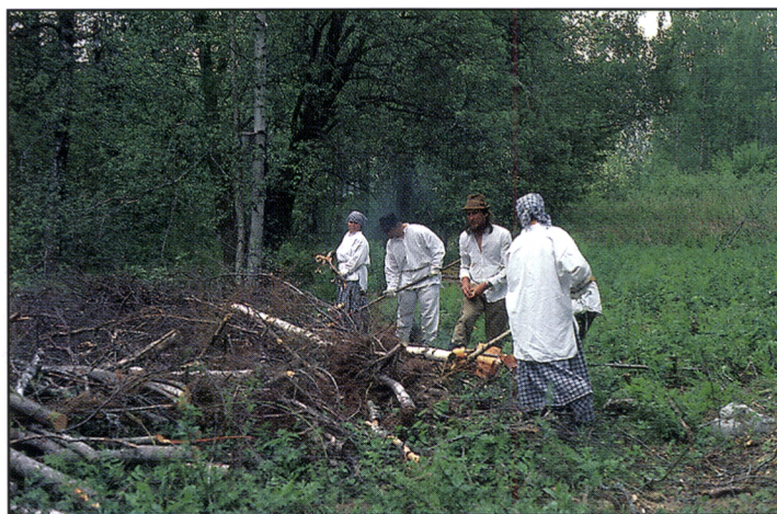
Kuva 2. Lyhytkierroisessa rieskakaskessa poltettavaa puuainesta oli joskus varsin vähän. Silloin piti tuoda kuusen hakoja sytykkeiksi ja sienapuita polton ja viertämisen täydennykseksi muualta.

Paremmiin viljelylle soveltuvan maaperänsä ansiosta lehtimetsien kasket voitiin tehdä suhteellisen nuoriin metsiin, jolloin ei tarvinnut kaataa isoja puita. Kaskeamisen jälkeen alueelle kehittyi yleensä leppää, koivua ja mäntyä kasvanut sekametsä. Rieskamaan kiertoaika oli lyhimmillään noin 15 vuotta. Koska tässä ajassa kehittynyt puusto ei ollut yleensä riittävää tarvittavan tuhkalannoituksen aikaansaamiseksi, alueelle piti tuoda viertopuita eli sienapuita alueen ulkopuolelta (Kuva 2). Asutuksen lähelle kehittyikin usein laajat lehtipuuvallaiset nuoret metsäalueet, joissa harrastettiin säännöllistä lyhytkierroista kiertokaskiviljelyä (25) .