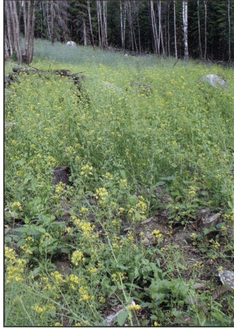
Kuva 6. Nauris on kaksivuotinen. Toisena vuonna nauris kukkii keltaisia pieniä kukkia, joista kehittyy palkoja ja niiden sisään nuppineulan pään kokoisia siemeniä. Ala-Murhin nauriskaski tuotti kesällä 2006 hyvän siemen sadon.

Nauris kylvettiin tarkoituksella harvaan asentoon, koska nauriin lehdet tarvitsevat kasvutilaa ja ylitieheä kasvusto vaatii harventamista. Kolilla tunnetaan sanonta, että ” nauris kylvetään niin harvaan, että jänes mahtuu makkoomaan nauriiden välissä ”. Syleksimällä voidaan siemenelle antaa alkukosteus ja syljen entsyymien arvellaan parantavat siemenen itävyyttä. Joka tapauksessa syleksimällä voidaan säästää siementä ja varmistaa harvan kylvön kohdistuminen suotuisiin kasvupaikkoihin. Nauriin siementä ei yleensä peitetty kylvön jälkeen. Siemenet voitiin silti lakaista kiviltä ja kannoilta parempaan maahan ja peittääkin hosalla huiskimalla (13) .