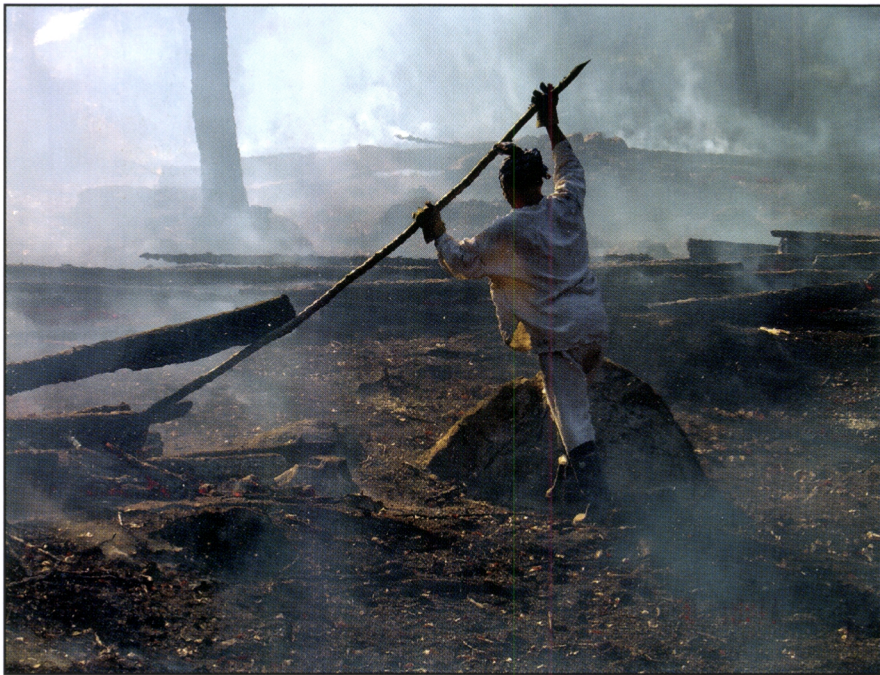
Kuva 12. Kasken raataja viertää viertokangella Ala-Murhin kaska.

Viertopolttu soveltuu lyhytkiertoisille rieskakaskille, joissa poltettavat rangat ovat pinotavarakokoa tai sitä ohuempia ja poltettavaa ainesta on vähän. Viertäminen on todellista raatamista (Kuva 12). Se on erittäin kuumaa ja vaativaa työtä, joka kuluttaa sekä viertäjän varusteet että hänen voimansa nopeasti. Kunnolla tehtyyn viertämiseen kuluu noin puolen hehtaarin kokoisella kaskella 10-12 tuntia työaika. Kuuman tulen lähellä savussa työskentely on nykypäivän työsuojeluväimusten kannalta erittäin riskialtista työtä. Loppuun saakka toteutettu viertäminen heikentää myös kaskialueen biodiversiteettiä, koska sen jälkeen ei alueelta juurikaan löydy osittain palanutta puuta, vain tuhkaa.