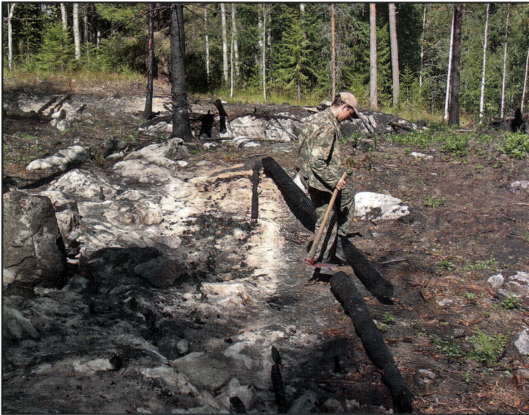
Kuva 14. Jälkipoltossa jääneet osittain palaneet rangat heitetään pois tuhkan päältä välialueille ja tuhka levitetään jatojen välialueille lehtiharavalla huiskimalla. Näin saadaan tuhkan ravinteet levitettyä tasaisemmin viljeltävälle alueelle.

Kolin kasket poltetaan kahdessa vaiheessa. Polton toinen vaihe tehdään ensimmäisessä vaiheessa palamatta jääneiden rankojen kasauksen jälkeen. Rangat kerätään 5-10 m välein pitkiksi kasoiksi ( jata ), jotka poltetaan toisessa vaiheessa (jälkipolttu, toinen poltto, viertopolttu ) sään salliessa yleensä muutaman viikon kuluttua ensimmäisestä poltosta (Kuva 14).