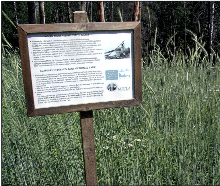
Kuva 19. Kolin kansallispuiston uusien kaskien reunalla on opastustaulu, joka kertoo retkeilijälle, mitä kohteessa on tapahtunut. Kaskitieto antaa sellaista uutta sisältöä retkeen, jota ei juuri muulta voi löytää.

Vuoden 2004 kaskenpolton uutena avauksena kansallispuiston eteläpäässä Patalammin läheisyydessä rehevällä entisellä järvenpohjamaalla kasvavissa noin 40 -vuotiaissa viljelykuusikoissa tehtiin laajahkot huuhtakasket (2 kpl). Kasket kaadettiin kesä-heinäkuussa 2003. Kaskien ensimmäinen ylipolttovaihe tehtiin heinäkuun 2004 alussa yhteistyössä paikallisen Herjärvisseuran jäsenten ja paikallisten asukkaiden kanssa. Toinen poltto eli raivauksessa kertyneiden jatojen kasapoltto tehtiin heinäkuun 2004 lopussa yhdessä Suomen Luonnonsuojeluliiton perinnemaisemaleirin talkooväen kanssa. Molempiin kaskiin kylvettiin elokuun puolivälissä kaskiruis muokattuun maahan. Vuonna 2005 Patalammin kaskista kerättiin kohtalaisen hyvä sato; siemenvilja kertautui noin viisinkertaiseksi puinnin jälkeen.