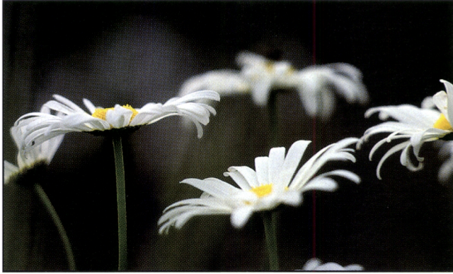
Kuva 23. Päivänkakkara on yksi kaskikulttuurin seuralaislajeista.