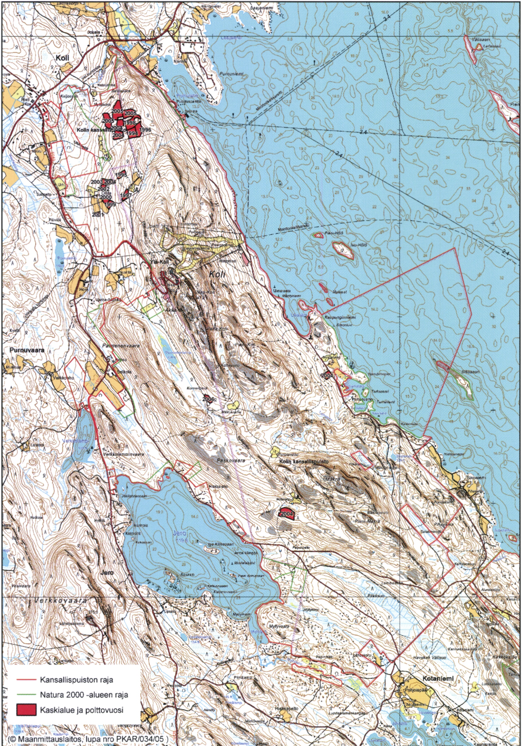
Liite 1a. Kolin kansallispuiston pohjois-osan uudet kasket vv. 1994-2006.