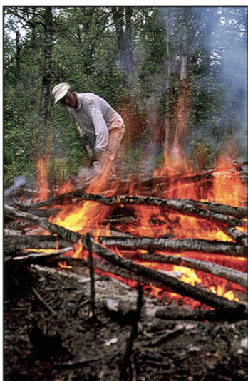
Kuva 27. Paikalliset asukkaat, matkailijat ja opiskelijaryhmät ovat osallistuneet Kolin kansallispuiston kaskitöihin. Kasken yhteyteen on mahdollista kehittää vaikuttavia elämyksellisiä ja kasvatuksellisia ohjelmia, jotka tukevat uuden tyyppisten maaseutuelinkeinojen kehittämistä.

Vapaana roihuava huuhtakaski on vaikuttava nähtävyys, joka varmaankin jää vaikuttavana elämyksenä kaikkien kasken raatajien muistiin. Kaski tarjoaa eri vaiheissaan tavattoman monipuolisen aihekokonaisuuden erilaisten tutkimukseen, opetukseen, ympäristökasvatukseen ja luonto- ja kulttuuri- matkailuun liittyvien hankkeiden ja ohjelmien kehittämiseksi. Kaski tarjoaa myös hyvän mahdollisuuden rakentaa yhteistoimintaa kansallispuiston, paikallisyhteisön ja yrittäjien välille. Tämä kehitys onkin Kolilla vahvasa nousussa. Kolin kasken raadantaan ovat osallistuneet kotiseutuyhdistykset, maamiesseuran väki, useat oppilaitokset ja lukuisat vapaaehtoisryhmät. Leirikouluille ja muillekin kaskikulttuurin harrastajille on valmistettu Kasken Kierros –luontopolku ja siihen liittyvät pedagogiset aineistot, jotka ovat helposti tavoitettavissa mm. internetin kautta ( www.metla.fi/koli sivulla Kolin polut ja kohteet).