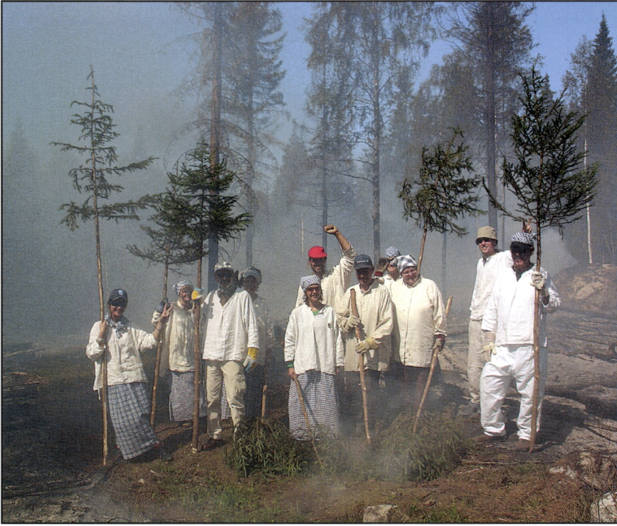
Kuva 22. Iloinen kreikkalais-suomalainen kaskenraatajien talkooryhmä onnistuneen ylipolton jälkeen Paimenenvaaran laakson huuhtakaskella 2006.

Kaikki vuoden 2006 kasket olivat huuhtakaskia, joten niiden kylvössä käytettiin edellisen vuoden rukiin siemenviljasato varsin tarkkaan. Kaikki vuoden 2006 kasket kylvettiin rautaharavalla ja kuokalla muokattuun maahan ja kylvös peitettiin haraamalla. Kylvöt tehtiin harvaan, jotta ylitiheydestä aiemmin mahdollisesti aiheutuneet talvituhot jäisivät mahdollisimman vähiin.