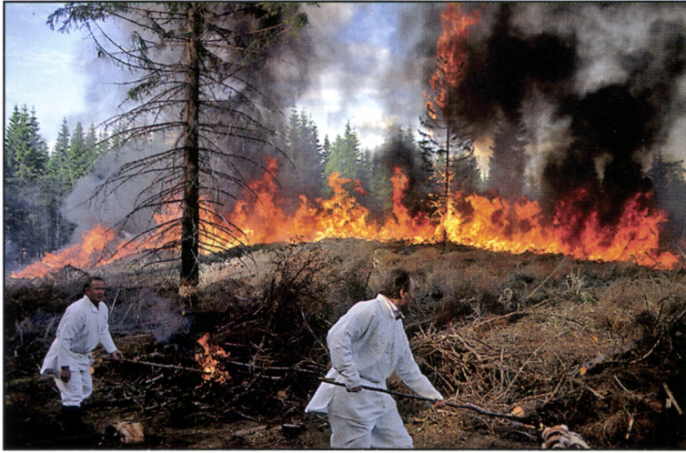
Kuva 3. Havumetsien huuhtakasket olivat aikanaan savo-karjalaisen heimon selviytymismenetelmä pohjoisella havumetsäalueella. Huuhtakaskeen viljeltiin kaskiruis.

Kuusimetsät sijaitsevat yleensä rehevillä kasvupaikoilla. Varttuneissa kuusikoissa on paljon palavaa biomassaa sekä runkokuussa että muussa latvustossa, joten kuusikoissa tehdyt huuhtakasket saattoivat olla hyvin tuottoisia. Kaskikauden loppupuolella huuhtakasket jouduttiin kuitenkin tekemään kauas asutuksesta, koska lähimetsät oli jo kaskeamalla muutettu lehtipuuvaltaisiksi.