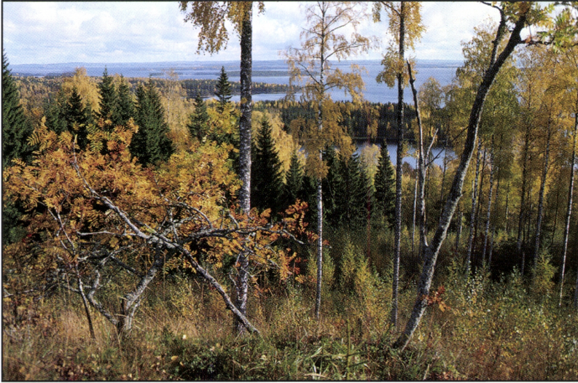
Kuva 28. Kolin lehtipuuvaltainen kaskimaisema on värikäs ja monimuotoinen. Kaski avaa näkymiä vaaroille ja järville. Maisemaan ja luonnon monimuotoisuuteen perustuva luonto- ja kulttuurimatkailu voi edistää elinkeinojen kehittymistä ja työllisyyttä Kolin alueella.