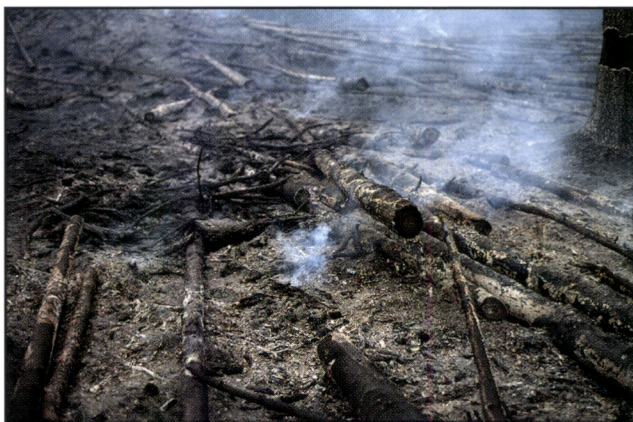
Kuva 24. Kaskenpoltossa saadaan tuhkaa, joka on tarpeen viljelykasvien kasvulle. Kaskeaminen lisää maaperän kasveille käytettävissä olevien ravinteiden määrää, edistää kivilajien kemiallista ja fysikaalista rapautumista sekä nostaa maan pH-pitoisuutta eli vähentää maan happamuutta.

Puuntuhkassa booria on melko runsaasti. Kaavin Telkkämäen suojelualueella kasketuilla alueilla on humuksen booripitoisuus ollut 2-6 kertainen vanhoihin metsiin verrattuna (24) . Kolilla booripitoisuuksien eroja ei toistaiseksi ole tutkittu. Huomionarvoinen osa kaskessa syntyvästä tuhkasta syntyy pintakasvillisuuden palamisesta, koska esimerkiksi putkilokasvien varsioiden tuhkapitoisuus on monikertainen puuainekseen verrattuna (63) .