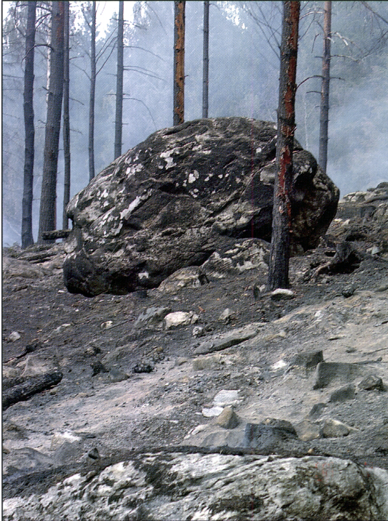
Kuva 8. Kasken ylipolton jälkeen maasto näyttää varsin epätodelliselta. Jos kaskelle jätetään liikaa osittain palanutta järeää puustoa kasken viljely vaikeutuu. Toisaalta, Kolin kansallispuistossa kaskeamisen eräänä tavoitteena on lisätä osittain palanutta lahopuuta.

min lahoavaa puuta vaihtelevia määriä (suuruusluokka vaihdellen välillä 5-50 m 3 /ha). Jonkun verran osittain palanutta puustoa voidaan myös jättää pystyyn kaskialalle. Näin toimittiin usein myös varsinaisella kaskikaudella, koska järeiden puiden kaataminen oli hyvin työlästä.