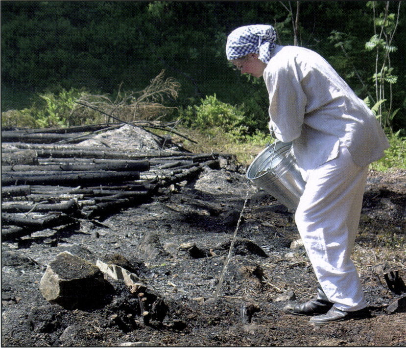
Kuva 18. Kasken jälkisammutus on tarpeen tehdä huolellisesti erityisesti alueen reunoilla. Sammutukseen käytetään vettä, jota kaadetaan tarkasti kyteviin pesäkkeisiin.

Vuonna 2004 poltetut kasket kaadettiin Kolin Natura 2000 -alueen hoitoa edistäneen EU:n osittain rahoittaman LIFE to Koli –hankkeen toimintana. Kaikkiaan viisi eri kaskialuetta kaadettiin kesä-heinäkuussa ja myöhään loka-marraskuussa 2003. Keskikesällä 2003 kaadettiin Kolin Rantatien varrella Mustanniityn kohdalla kasvanut istutuskoivikko ja Ikolanahon niityn länsipuolella kasvanut istutusmännikkö. Loppusyksyllä kaadettiin Ollilan edellisvuoden kasken yläpuolelle uusi rieskakaski.