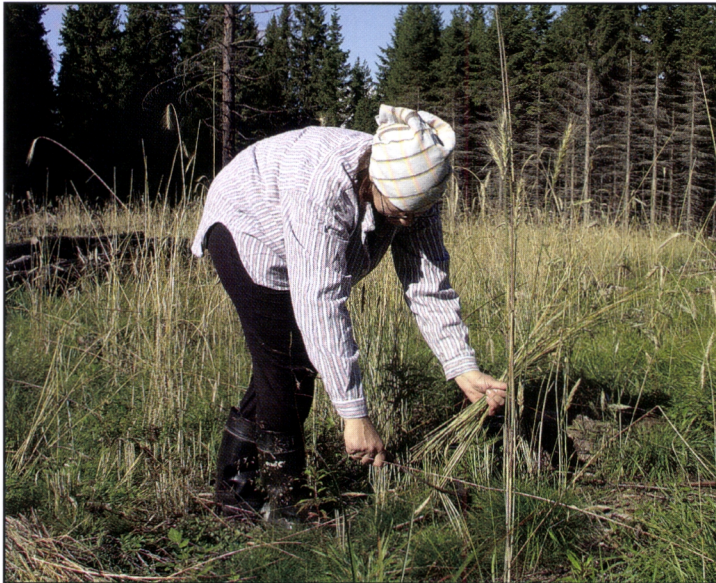
Kuva 13. Rukiin leikkuussa sirppi on ainoa oikea työväline. Toiseen käteensä otetaan nippu rukiinvarsia ja sirpillä nyhdetään rukiin varret poikki.

Kaskiin on kylvetty ruista ja kaskinaurista, joista molemmat ovat tuottaneet jonkin verran siementä jatkoviljelyyn. Tavoitteena on tulevaisuudessa tuottaa ja kehittää vuotuisen perussadon lisäksi Kolin kaskinauriina ja Kolin kaskirukiina tunnettavaa paikallisiin olosuhteisiin sopeutunutta siementä. Kolin alueella kaskitoiminnassa korostuvat maisemalliset tekijät, koska rinteissä mosaiikkimaisesti sijainneet kaskialueet olivat 1800-luvun lopussa tärkeä osa kansallisromantiikan maisemaa.