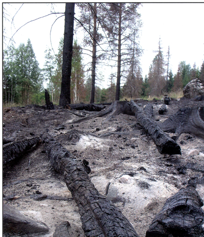
Kuva 21. Huuhtakasken toinen poltto antaa kuivana kesänä hyvän tuhkaravinteen rukiin kasvulle. Tuhkan levittäminen jatojen ja kasojen pohjilta välialueille parantaa sen vaikutusta.

Sekä nauris että ruis kasvoivat Ala-Murhin kaskessa hienosti ja tuottivat hyvän sadon. Nauriista saatiin noin 5 aarilta noin 50 kg nauriin juureksia ja noin 6 litraa siemeniä. Ruis antoi lähes kymmenkertaisen sadon kylvömäärään verrattuna. Lisäksi kaskesta tehtiin noin 20 metriä halkoja. Osittain palanutta puuta jätettiin kaskeseen noin 30 m 3 /ha. Poltetulle maalle nousi jo ensimmäisenä kesänä useita kukkalajeja, mm. pelto-orvokki, päivänkakkara, kissankello ja särmikäs kuisma, joita siellä ei lainkaan kasvanut kaskea kaadettaessa. Kesällä 2006 kaski oli todellinen nähtävyys; korkean pensaina kasvavan ruishalmeen sisällä ja reunoilla kasvoi tavattoman elinvoimaisina kaskiahon kukkaloiston parhaita edustajia ja myös perhosten (mm. sinisiivet, kultasiipi, auroraperhonen) runsaus oli huomiota herättävä.