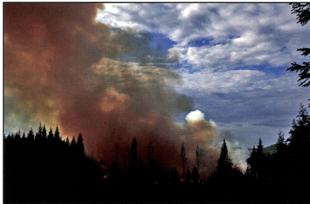
Kuva 11 a ja b.. Huuhtakasken ylipoltto nostaa tulen lieskat yli puiden latvojen. Vahva savu näyttää kasken sijainnin kymmenien kilometrien päähän.