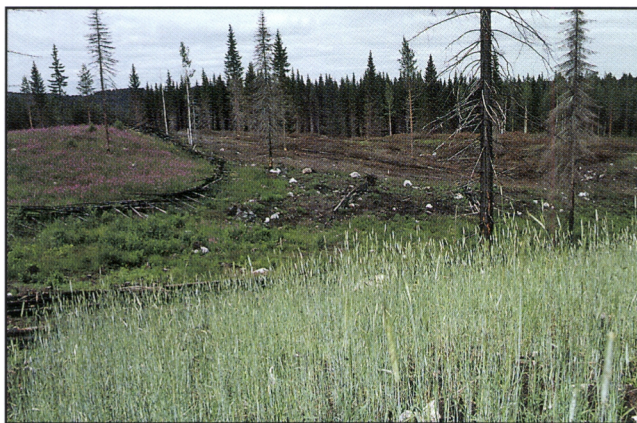
Kuva 15. Vuonna 1996 poltettu Kolin kaski viljeltiin rukiille, jonka sato korjattiin elokuun lopussa 1997. Taustalla vasemmalla näkyy horsmaa kasva-va vuoden 1994 kaski. Taustalla oikealla on keväällä 1997 kaadettu ja seuraavana vuonna poltettava suuri huuhtakaski.

Kolin kansallispuiston vuoden 1997 lehtimetsäkaski poltettiin 5. kesäkuuta, ensin ylipoltona ja heti sen jälkeen toiseen kertaan viertopoltona. Kaski paloi alkuvaiheen epäröinnin jälkeen hyvin (Kuva 16). Syttymistä auttoivat kasken tuodut kuusenhavut. Nauriin siemenet kylvettiin pari päivää myöhemmin. Kylvö oli varhainen verrattuna vanhan kansan ohjeisiin. Vilkun (13) mukaan nauriin kylvö tapahtui aikoinaan vasta juhannuksen jälkeen Pietarin (29. kesäkuuta) tai Kiljaanin (8. heinäkuuta) päivän tienoilta. Myöhäisellä kylvöllä pyrittiin ilmeisesti vähentämään tuhohyönteisten haittoja. Kylvön teki tämän kirjoittaja puoliksi perinteisellä syleksimismenetelmällä (töpehtiminen tai töpeksiminen) ja puoliksi käsin hajakylvönä.