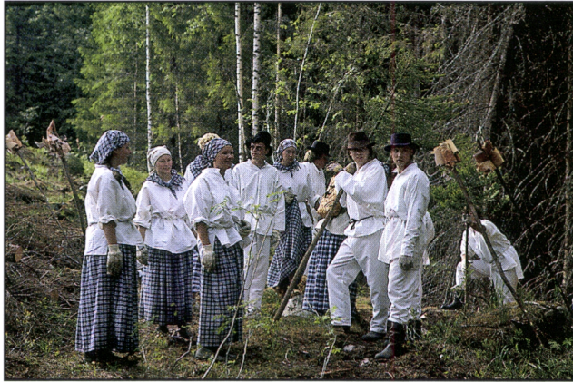
Kuva 25. Vapaaehtoisten kasken raatajien ryhmä valmistautuu polttoon perinteisissä työasuissaan. Pellavapaidat nokeentuvat päivän kuluessa. Pellava on hengittävä luontainen kaskivaate, joka ei ole kovin herkkä syytymään tulen kuumuudessa.

nessä löydetty yli 400 kaskikulttuurin tuottamaa yksittäistä kohdetta, kuten kiviraunioita, nauriskuoppia, aitoja. Perinteinen kaskivaatetus kuten pella-varohdinpaidat, tuohilöttöset, märkähatut, liinat ja kaskeamisen muut työvälineet sekä niiden käyttötavat ovat osa perinteisen luonnonkäyttökulttuurin monimuotoisuutta (Kuva 25).