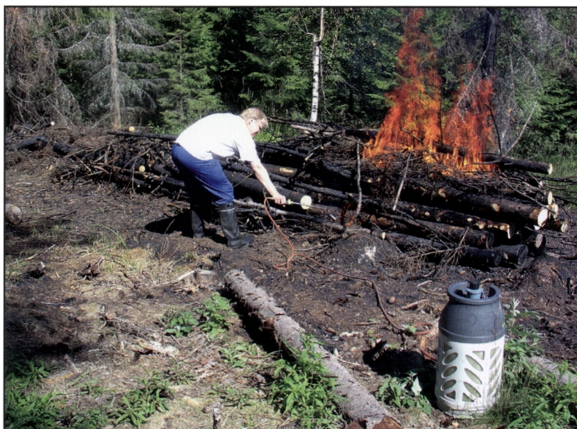
Kuva 17. Vuodesta 2001 alkaen Kolin kaskan sytytyksen varmistukseen on käytetty nestekaasua. Tässä metsikön aiemman viljelyhistorian hyvin tunteva paikallinen kaskanharastaja sytyttää Ennallistajan Polun varrella tehdyn LIFE to Koli -hankkeen kaskan toisen polton (jatojen poltto) kesällä 2006.

Vuoden 2001 kaski poltettiin Ollilan Turulan puoleisella alapellolla. Pellon reunan raivauksissa kertynyttä vuoden 2000 heinäkuussa rasiin kaadetua leppä- ja pajupuustoa poltettiin vanhalla peltomaalla. Kaskeen tuotiin lisää lehtipuuta Metlan tutkimusmetsän harvennuksesta kansallispuiston ulkopuolelta. Kaikkiaan poltettava alue oli noin 0,3 ha ja siinä oli noin 50 m 3 lehtipuurankaa. Poltto tehtiin heinäkuun alkupuoliskolla Pohjois-Karjalan ammattikorkeakoulun harjoitusleirin työnä.