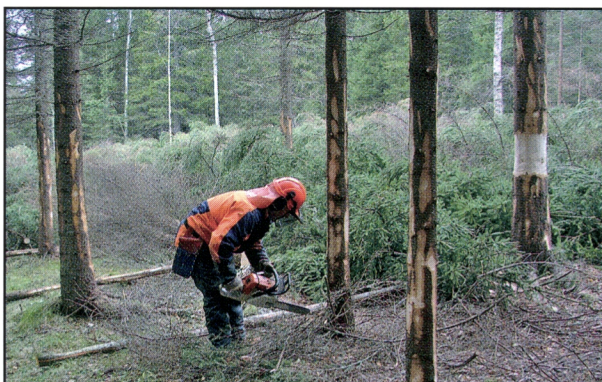
Kuva 9. Kaski kaadetaan telapuiden päälle. Alaokset karsitaan. Jokunen puu jätetään pystyyn kaulattuna.

Muurahaispesät, sekä elävät että hylätyt, on syytä kartoittaa jo kasken kaatovaiheessa. Puita ei kaadeta pesien päälle vaan niille jätetään mahdollisuuksien mukaan 5 m palokuormasta vapaa suojavyöhyke.