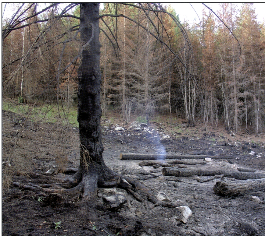
Kuva 26. Kaskituli lämmittää kasken reunametsää melkoisesti vaikka se ei sytykään palaamaan. Reunametsän puut saattavat kuivua ja kuolla tästä rajusta käsittelystä. Tämä lisää lahoavien pystypuiden määrää kansallispuistossa ja siten edistää luonnon monimuotoisuutta.

Kolin kansallispuistossa tehdyt kaskialueet ovat osoittautuneet erittäin kiinnostaviksi retkeily- ja opetuskohteiksi, eikä niiden maisemavaikutuksia ole juuri moitittu. Tämä selittynee sillä, että kaskialueisiin tutustuneet ihmiset ovat opasteiden ja tiedottamisen kautta saaneet tietoa siitä, että kyseiset alueet ovat aivan erityisen arvokkaita ja tärkeitä kaskikulttuuriperinteen vaalimiskohteita ja maiseman ennallistamisalueita. Todennäköisesti kaskeamisen lyhytaikaisia haitallisia maisemavaikutuksia voidaan muuttaa positiivisemmiksi juuri tiedottamisen avulla (Kuva 19). Kaskialueelle kehittyy vähitellen lehtipuustoa, jota pidetään virkistysarvoltaan keskimäärin havumetsiä parempana (70) . Kaskenpolton pitkän aikavälin maisemavaikutukset ovatkin todennäköisesti pääasiassa myönteisiä.