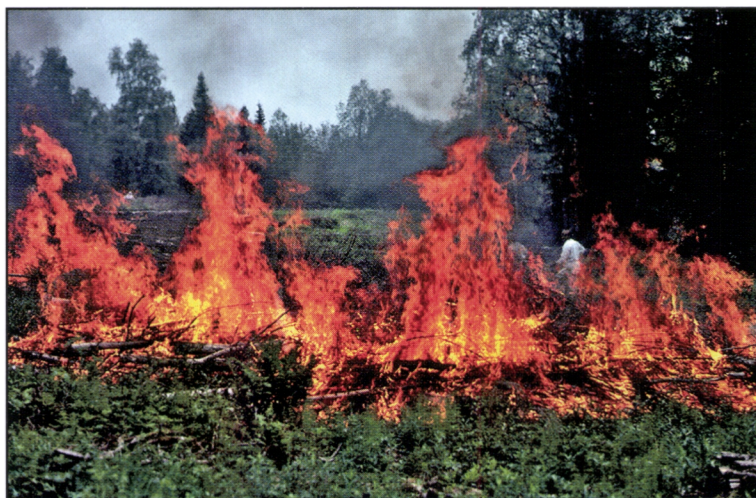
Kuva 1. Kaskitulet roihuavat vuosittain Kolin kansallispuistossa. Kasken raadannan suunnitelma on laadittu EU:n osittain rahoittaman LIFE to Koli -hankkeen toimesta 50-vuodelle ja se kattaa noin 150 hehtaaria kansallispuiston metsistä.

Luontaisten metsäpalojen lisäksi on ihmisen tulenkäyttö vaikuttanut metsien rakenteeseen jo vuosituhansien ajan. Heikinheimon tutkimuksen (1) mukaan Suomessa on harjoitettu kaskiviljelyä noin 4 miljoonan metsämaahehtaarin suuruisella alueella Näin laajalle levinneellä toiminnalla oli erittäin suuri vaikutus Suomen metsäekosysteemeihin ja laajemmaltikin ympäristöön, varsinkin vesiin.