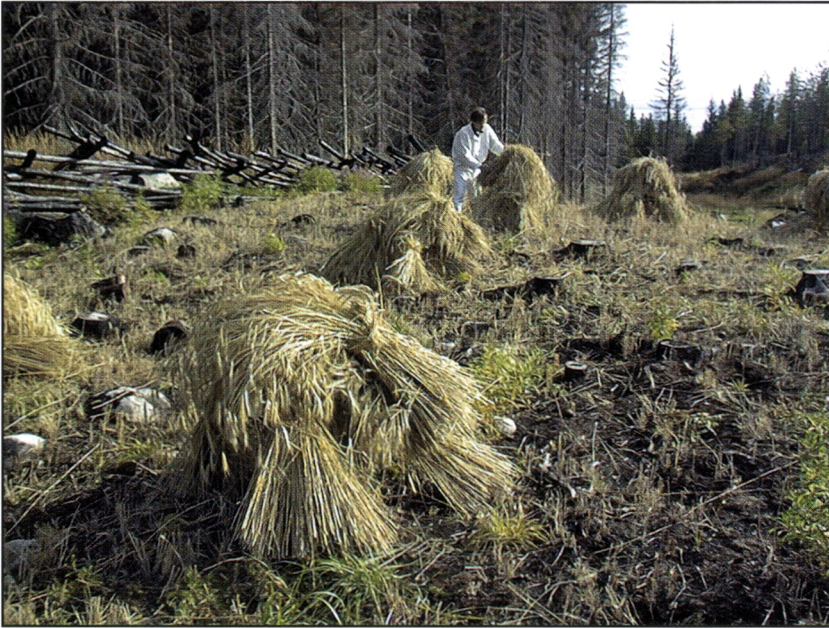
Kuva 7. Ruis korjataan Koliilla elo-syyskuun vaiheessa. Kymmenestä lyhteestä kootaan kuhilas, joka saa seistä kaskella muutaman päivän esikuivatuksessa puintia varten. Vuoden 1998 suuri huuhtakaski antoi erinomaisen ruissadon, joka antoi aiheen Kolin vuotuisen sadonkorjuujuhlaperinteen elvytykseen. Metlan kansallispuistoväki ja kylän yhdistykset toteuttivat yhteistuumin Kolin seurojentalolla juhlat, jossa kaikille tarjottiin kaskiruislimppua ja ruispuuroa.

kas kasvaa maan pinnalla lehtien alla suojassa. Hyvän kokoiset nauriit ovat litteitä ja 10-15 cm halkaisijaltaan, pinnaltaan sinipunaisia tai kellahtavia, keltamaltoisia ja aromikkaita. Nauriiden juuret kasvavat lokakuulle asti, jos syksyn säät ovat suotuisia.