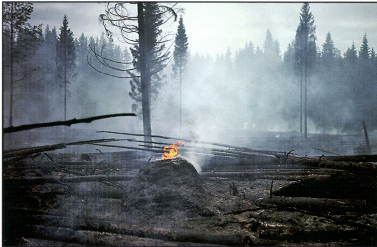
Kuva 10. Palamaan syttynyt muurahaispesä on hankala sammutettava. Jo kasken kaato- vaiheessa on syytä jättää pesien ympärille riittävä suojavyöhyke ja suojata pesät polton aikana esim. märillä huovilla tai matoilla. Näin säästetään sekä luontoa että aikaa ja vaivaa

Polton aikana muurahaispesät voidaan suojata kastellulla huovalla tai ma- tolla, jolloin niiden pintakerrokset eivät syty palon kuumimman vaiheen ai- kana. Syttyneet muurahaispesät on syytä kaivaa mahdollisimman pian auki ja siirtää kytevä aines tarkkaan pois pesän läheltä kasken palaneelle alueel- le. Syvälle pesään päässyt tuli on vaikea sammutettava, savu saattaa nousta pesästä toista viikkoa (Kuva 10). Tuli voi siirtyä maanalaisia käytäviä ja puiden juuria pitkin pesien ulkopuolisille alueille ja pitkään jatkuvan kui- van kauden aikana aiheuttaa kasken reunametsien jälkipaloja jopa viikkoja kasken polton jälkeen.