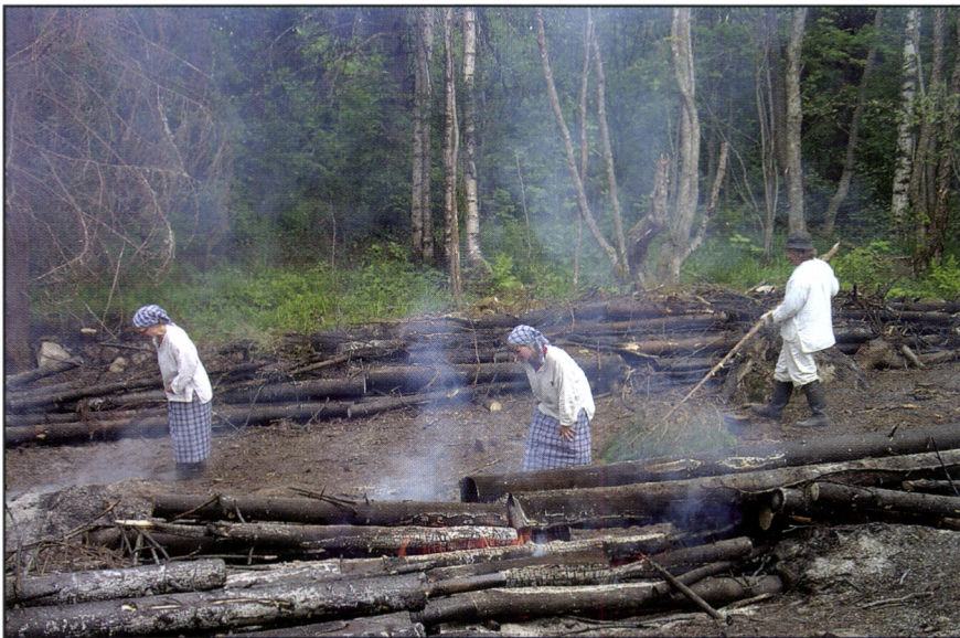
Kuva 20. Osa Ala-Murhin LIFE-kaskesta kylvettiin juhannusaattona nauriille perinteisellä syleksimismenetelmällä, jota Kolilla kutsutaan töpehtimiseksi tai töpeksimiseksi. Siemenet peitettiin kuusihosalla huiskimalla. Siemenet itivät hyvin ja nauriita saatiin paljon syyskuussa.

Vuoden 2005 kaskista monipuolisin ja parhaiten onnistunut oli Ala-Murhin kaski, joka sijaitsee Kolin Rantatie varrella noin 1 km etelään Pirunkirkosta. Kaski sijoittui noin 45 -vuotiaaseen kuusen viljelymetsään, jossa oli melkoisesti koivua ja leppää sekapuuna. Kasken reunoilla on vanhoja kiviaitoja, kaskiraunioita ja pistoaitaa, jotka todistivat että paikalla oli ollut aiemmin kaskeamalla raivattu pelto. Kuusen neulaset paloivat hyvin kaskessa, joka poltettiin kahdesti ennen juhannusta. Juhannusaattona kasken eteläpäähän kylvettiin nauris perinteisellä syleksimismenetelmällä eli töpehtimällä (Kuva 20). Nauriin siemenet peitettiin hosalla lakaisemalla. Ruis kylvettiin elokuun puolivälissä haravalla muokattuun pohjaan ja peittäen siemen kylvön jälkeen.