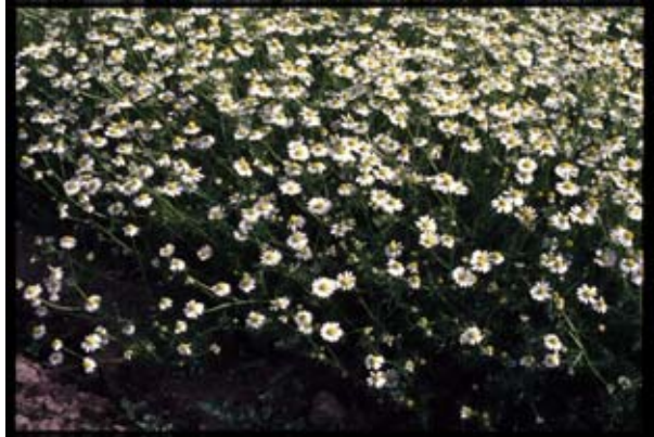
Kamomillasaunio kuuluu kadmiumia kerääviin kasvilajeihin