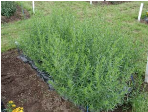
MTT:n ekologisten tuotannon pelloilla Mikkelissä selvitetään, miten kalkitus vaikuttaa tillin, piparmintun, rohtosamenttikukan ja ranskalaisen rakuunan lehtien kadmiumpitoisuuksiin. Kuvassa rakuunan koeruutu.