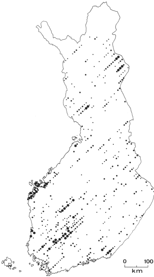
Kuva 1. Hirven suhteellinen esiintymistiheys vuosina 1951—1953 metsien inventoinnin koealoilla ja koealojen väliaipaleilla tehtyjen havaintojen mukaan. Pisteiden selitykset tekstissä.

Figure 1. Distribution and relative abundance of moose in Finland in 1951—1953, according to the findings on forest inventory sample plots and survey lines.