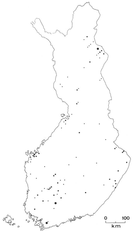
Kuva 2. Hirvivahinkojen suhteellinen esiintymisrunsaus mäntyvaltaisissa taimikoissa vuosina 1951—1953 metsien inventoinnin koealoilla ja koealojen väliaipaleilla tehtyjen havaintojen mukaan.

Figure 1. Distribution and relative abundance of moose in Finland in 1951—1953, according to the findings on forest inventory sample plots and survey lines.