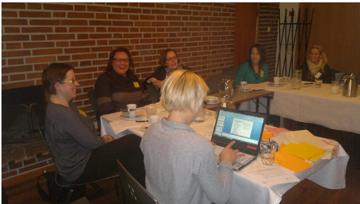
Kuva 5. Kuva sidosryhmätyöpajan elintarvike- ja kaupan ryhmästä joulukuussa 2013.

Koska osallistujia jälkimmäiseen työpajaan saatiin vähän, haluttiin kirjallisuusanalyysin ja työpajatyökentelyn kautta syntynyt tuotos hyväksyttävä laajemmalla joukolla. Niinpä hieman yli 2100:lle ruokaketjun toimijalle lähetettiin nettipohjainen kysely, jossa kartoitettiin, miten he arvottavat esiin nousseita ympäristövastuullisia toimenpiteitä. Suurin ryhmä kyselyssä olivat alkutuottajat. 1940:sta tavoitetusta tuottajasta 310 vastasi kyselyyn eli noin 16 %. Elintarviketeollisuuden 75:sta edustajasta tavoitettiin 65, joista kyselyyn vastasi 11 eli noin 17 % kyselyn saaneista henkilöistä. Kaupan toimijoista kysely lähetettiin 19 toimijalle, joista 16 tavoitettiin. Heistä 9 vastasi. Omana ryhmänään olivat muut ruokaketjun sidosryhmät. Tähän ryhmään oli koottu henkilöitä kansalaisjärjestöistä, viranomaistahoista, tutkimuslaitoksista sekä etujärjestöistä. Kysely lähetettiin 32:lle toimijalle, joista 29 tavoitettiin. Heistä 10 vastasi.