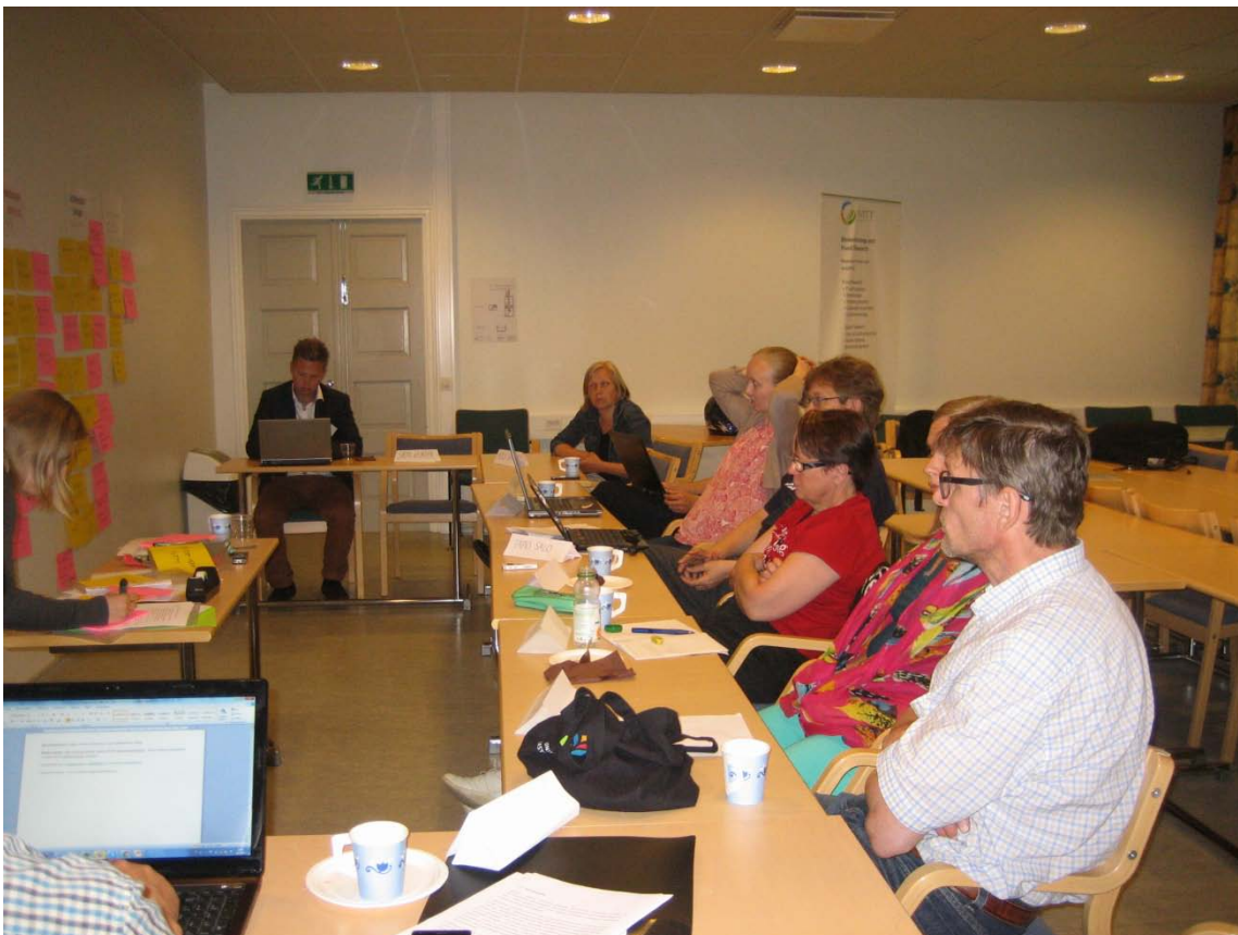
Kuva 4. Osallistujia kesäkuussa 2013 järjestetyssä asiantuntijatyöpajassa.

Ensimmäiseen, asiantuntijoille järjestettyyn työpajaan kutsuttiin 22 alkutuotannon- ja ympäristöalan asiantuntijaa eri tutkimuslaitoksista, Maa- ja metsätalousministeriöstä sekä ProAgriasta. Heistä 10 pääsi osallistumaan. Osallistujat edustivat eläin-, kasvintuotanto- ja ympäristöalaa. Toiseen, ruokaketjun sidosryhmille järjestettyyn työpajaan kutsuttiin 134 ruokaketjun eri toimijaa alkutuotannosta, elintarviketeollisuudesta, kaupan alalta, etujärjestöistä, kansalaisjärjestöistä ja viranomaistahoista. Huolimatta kutsun aikaisesta lähettämisaikakohdasta ja uusintakutsuista, vain 18 ilmoittautui työpajaan ja lopulta vain 10 henkilöä pääsi osallistumaan.