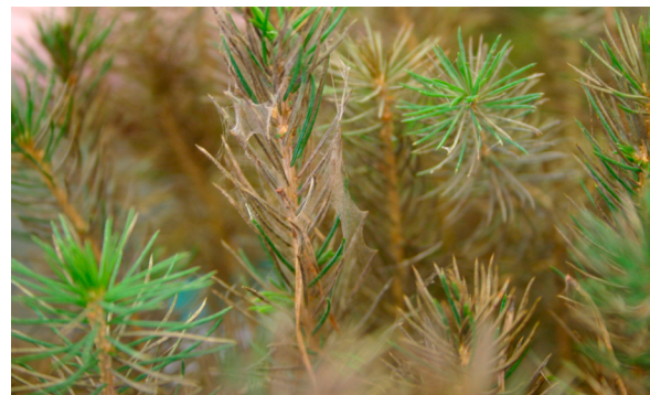
Havupuidenlumihomeen rihmasto on näkyvissä heti lumen sulamisen jälkeen ennen kuin se kuivuu ja huuhtoutuu pois. RLP.

TARTUNTA: Itiöt leviävät maahan karisseista edellisvuotisista neulasista, joihin kesän aikana on muodostunut sienien koteloitiöpesäkkeitä. Pesäkkeissä syntyvät koteloitiöt tartuttavat elokuusta lähtien uusia neulasia siihen asti, kun maahan tulee pysyvä lumipeite. Lumen alla sieni kasvaa neulasesta ja taimesta toiseen. Yhdestä pisteestä alkanut tartunta voi leviää noin 30 cm säteelle. Sieni tuottaa kylmäsuojaa-aineita ja pysyy aktiivisena lumen alla myös pakkaslämpötiloissa (n. -5 °C saakka).