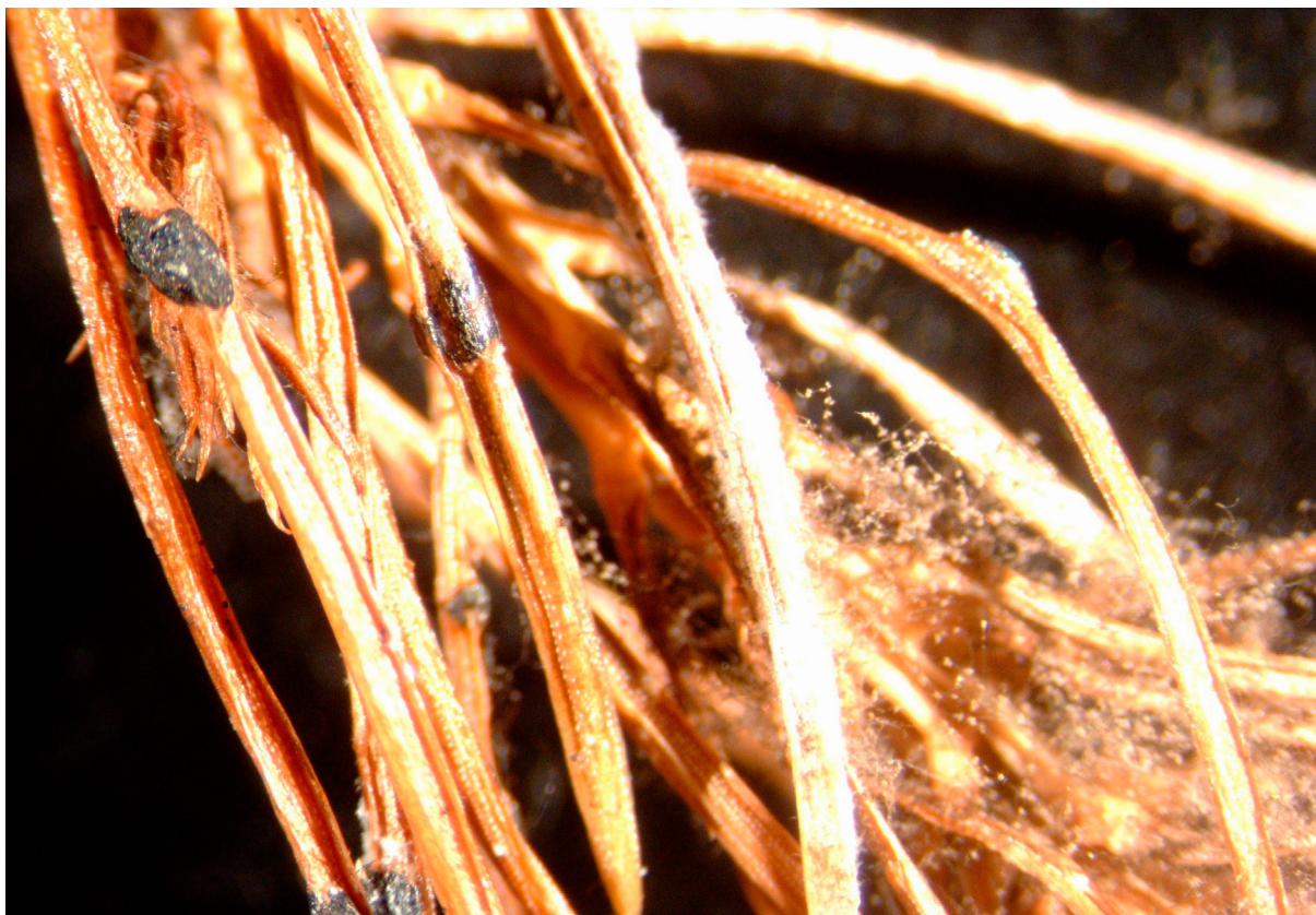
Harmaahometta kuolleissa neulasissa. Vasemmalla neulasen pinnalla mustia pakkoja, jotka ovat sienen kestoasteita, oikealla runsaasti itiöivää rihmastoaa. AL