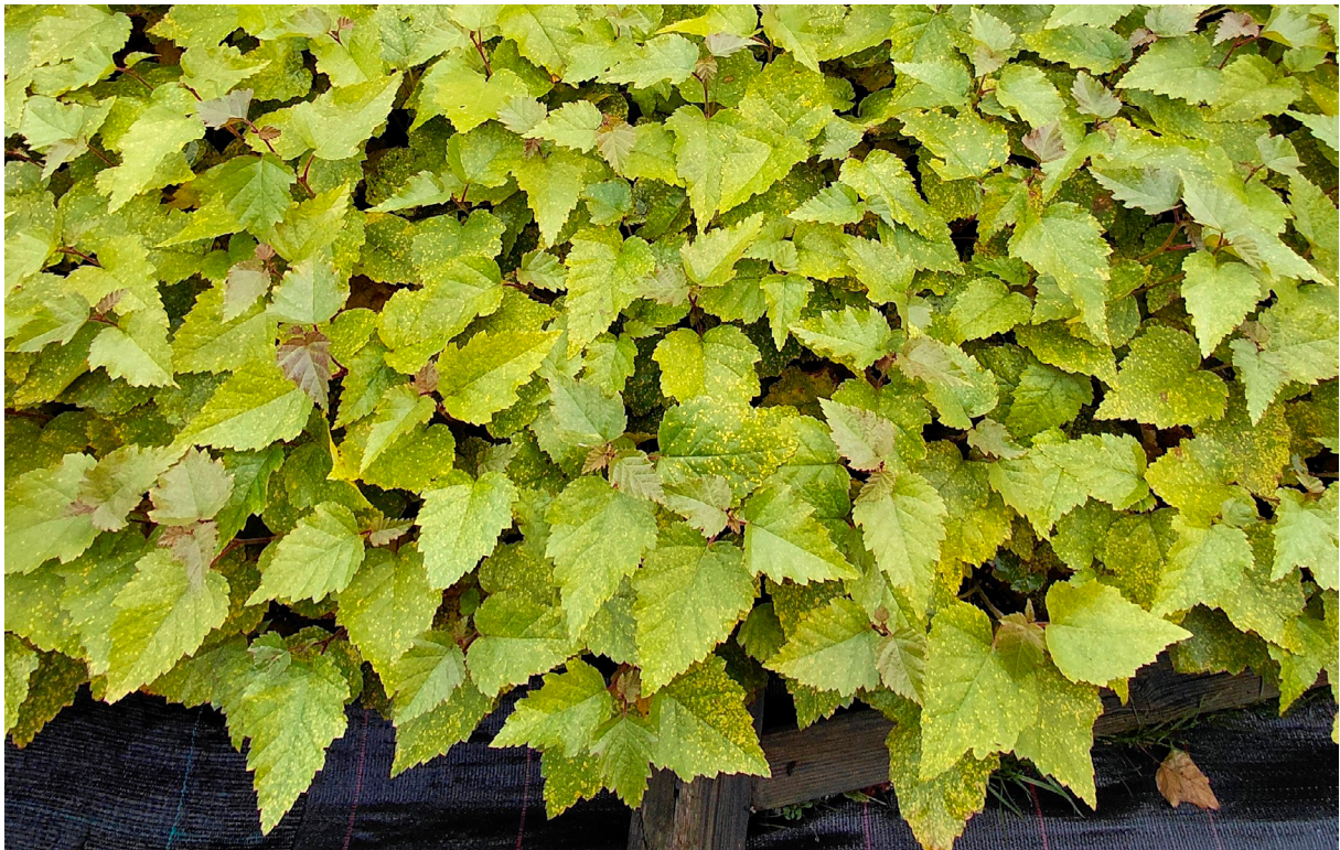
Koivunruosteen vaivaamia rauduskoivun taimia. Taimien talveentuminen voi taudin takia viivästyä. KH

Sieni talvehtii koivujen versoissa ja silmuissa sienirihmastona ja kesäitiöinä. Ruostesienien tapaan sieni voi vaihtaa välillä isäntäkasvia, jolloin maassa talvehtiviin lehtiin syntyvät talvi-itiöt itävät keväällä muuttuen kantaitiöiksi, jotka tarttuvat lehtikuusen neulasiiin ja siirtyvät sieltä helmi-itiöinä koivun lehdille. Suomessa ei ole tavattu helmi-itiöastetta lehtikuusella, vaan tauti siirtyy koivun lehdistä toisille. Ruostesienet leviävät kuitenkin pitkiä matkoja, joten on mahdollista, että tartuntaa tulee meille myös muualta.