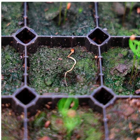
Taimipolteen kaatamia männyn sirkkataimia. KH