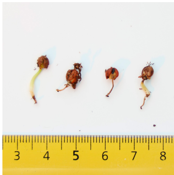
Taimipolte on näivettänyt metsälehmuksen juuret. KH