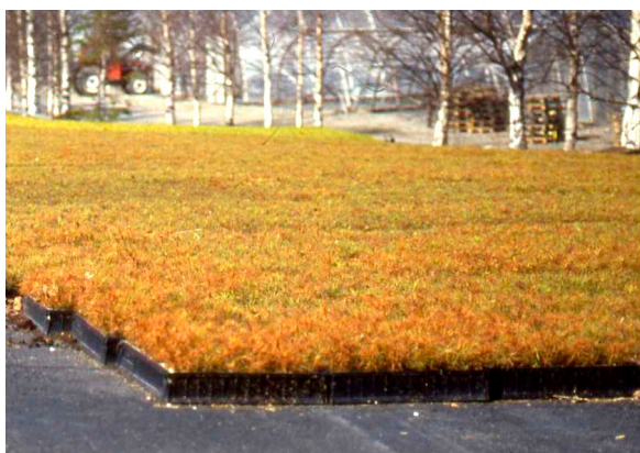
Männynneulaskaristeen ruskettamia männynntaimia keväällä. AL

Selvempi oire, eli edellisvuotisten neulasten ruskettuminen, tulee näkyviin vasta seuraavana keväänä tai alkukesästä lämpötiloista riippuen. Samassa taimessa voi olla sekä terveitä että sairaita neulasia. Kun taimia säilytetään alhaisissa (alle 0 °C) lämpötiloissa, oireet tulevat näkyviin viiveellä. Elävinä säilyneet silmut lähtevät kasvuun, mutta ruskettuneet neulaset karisevat kesäkuun aikana.