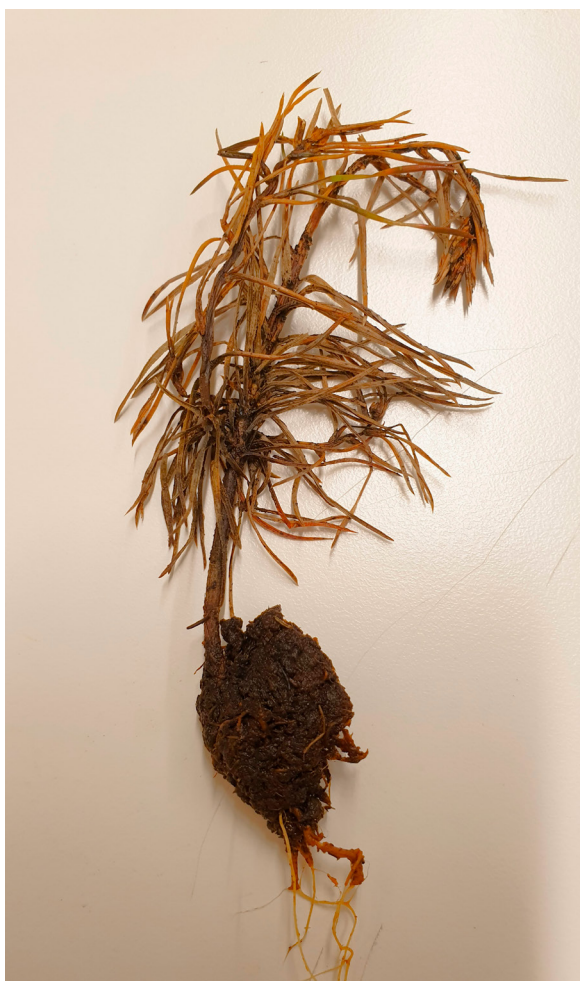
Etälänversosurmaan kuollut männyt taimi Ruotsissa. RL

Taimitarhan lähistöllä olevat sairaat männyt saattavat levittää itiöitä myös tarhalle.