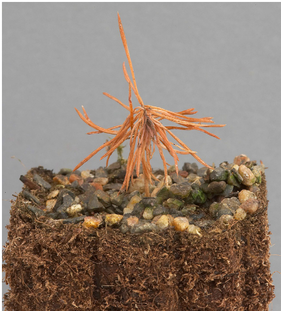
Sirococcus conigenus -sienen aiheuttama versonäive kuusen kylvötaimella. EO

Taimikoro: Toisen vuoden taimien latvat taipuvat ja koroutuvat. Koroja muodostuu uuden kasvaimen alaosassa alueella, jossa aiemmin on saattanut olla lisäksi joko paleltumisen tai muun tekijän aiheuttama vaurio. Sieni voi tarttua myös vanhemmilla taimilla valonpuutteesta kärsineeseen verson alaosaan, johon muodostuu sienien mustat pallomaiset paljain silmin nähtävät alle 1 mm:n kokoiset itiöpesäkkeet. Korokohtiin näitä itiöpesäkkeitä muodostuu viiveellä tai ei lainkaan. Taimikorosta käytetään myös nimitystä koukkulatvatauti.