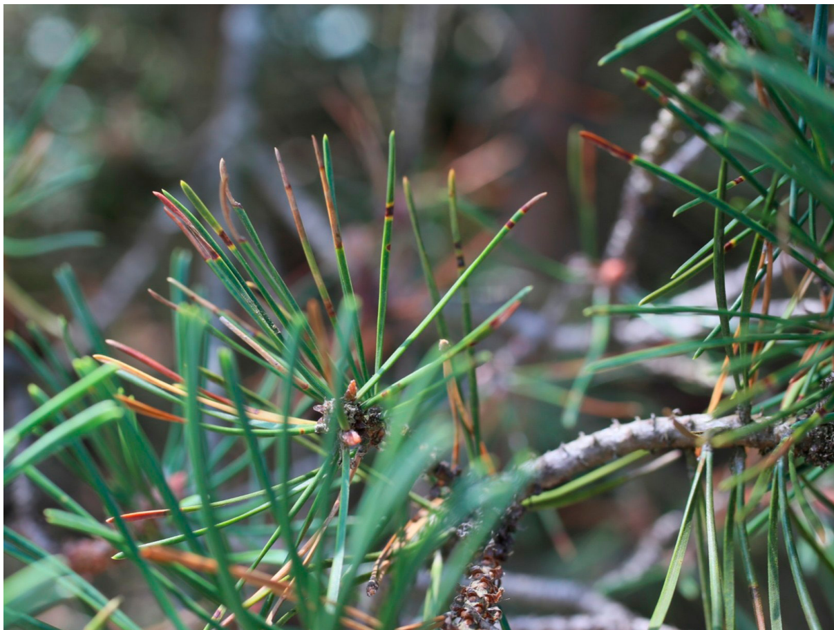
Ruskovyökaristeen infektoimia männyn neulasia. MT

läheisyydessä. Tilanne voi kuitenkin muuttua, mikäli uusia ja aiempaa aggressiivisempia patogeenisuoroja leviää Eurooppaan esimerkiksi koristehavujen mukana.