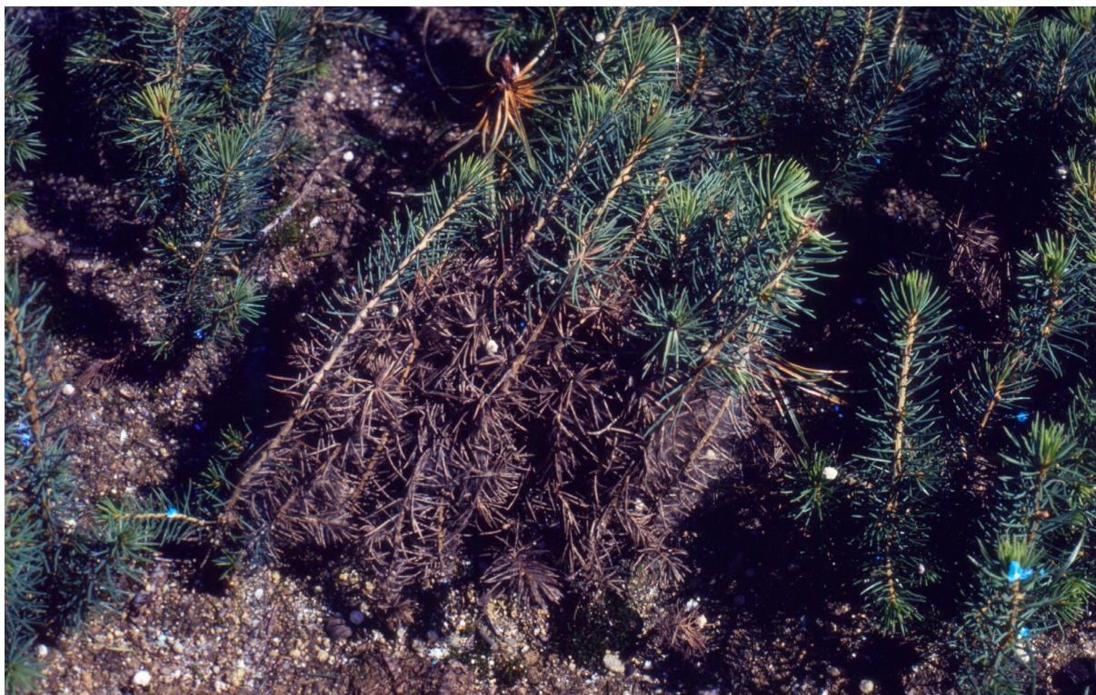
Mustalumihomeen tappamia kuusen neulasia keväällä. SL