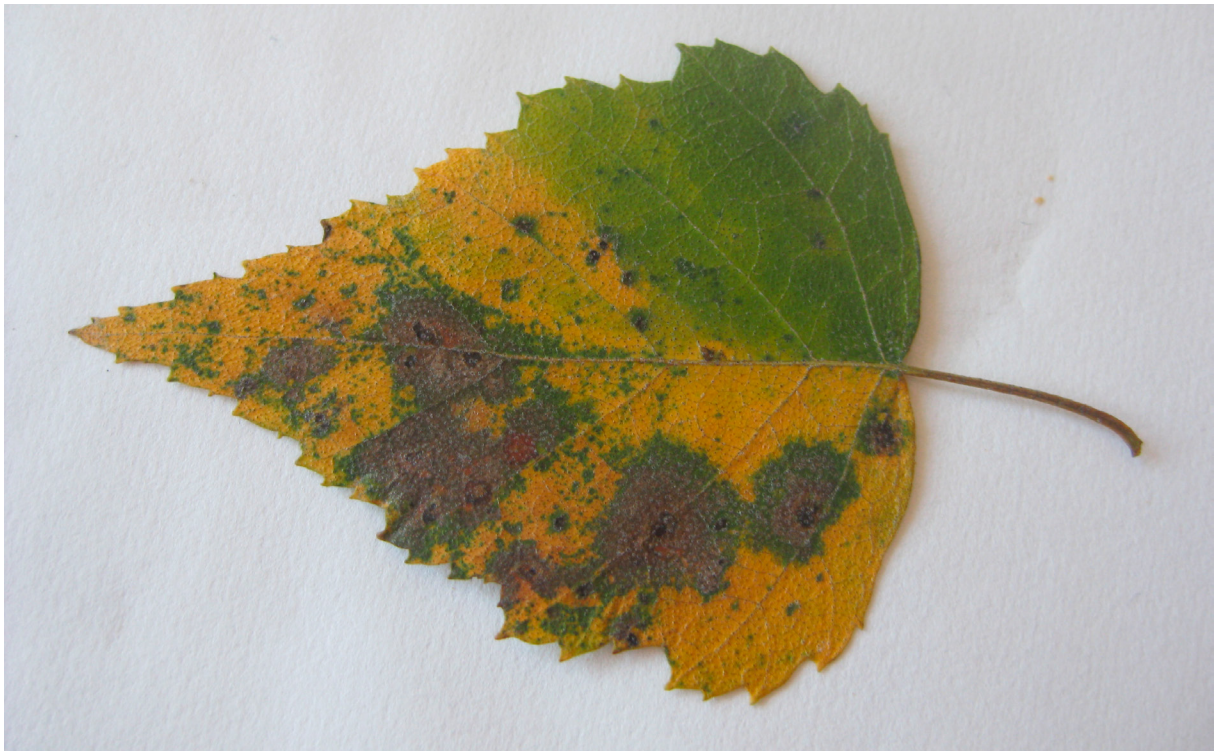
Pyrenopeziza betulicola -sienen aiheuttamia laikkuja koivun lehdellä. TK

OIREET: Lehtiin ilmaantuu vaaleita, keltaisia tai tummanruskeita laikkuja. Tummanruskeita laikkuja voi aluksi ympäröidä vaalea tai kellertävä reunus. Laikkuiset lehdet kellastuvat ennenaikaisesti.