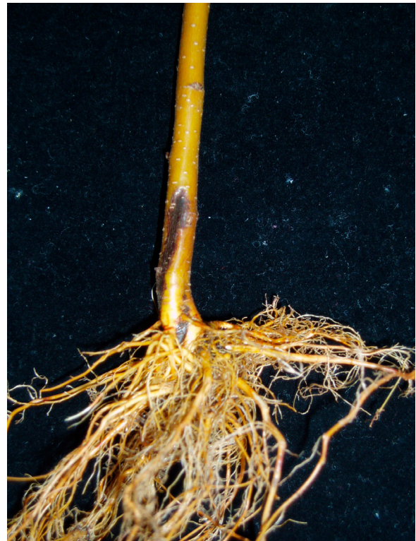
Levälaikkuinen koivun taimi, jossa tumma laikku tyvellä. Juuret säilyvät terveinä. AL

Phytophthora -mikrobit ovat pääosin vieraslajeja, jotka ovat kulkeutuneet meille kasvikaupan mukana. Metsäpuille haitallisia Phytophthora -lajeja on tavattu Suomessa vain taimitarhoilla. Metsäpuiden taimilla yleisin laji on P. cactorum , jonka aiheuttama tauti koivulla, lepällä ja pihlajalla on nimetty levälaikkuksi. Tervaleppän taimelta on löydetty myös lepäntaannetta aiheuttava P. uniformis -laji. Muut meillä tavatut Phytophthora -lajit ovat löytyneet koristekasveja tuottavilta taimitarhoilta. Useilla Phytopht-