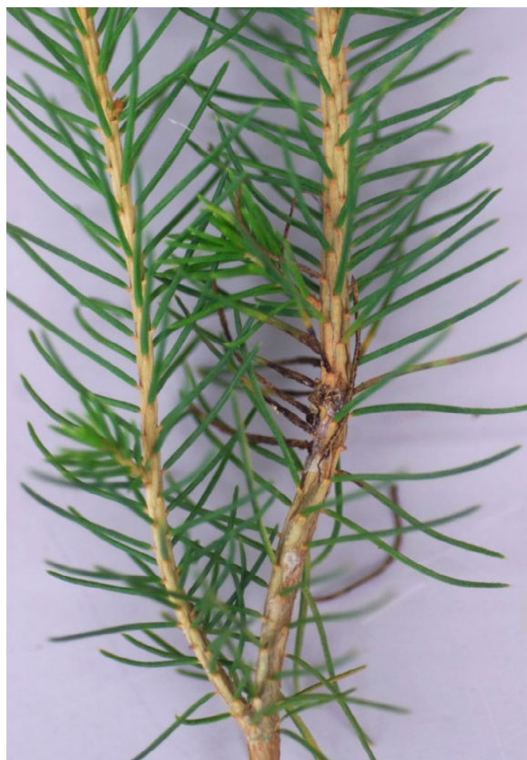
Taimikoro edellisvuotisessa paleltumassa. MP