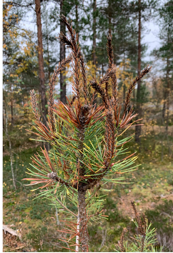
Etelänversosurman oireita uudistusalalla. Oireet muistuttavat versosurmaa ja männyn versoruostetta. ET