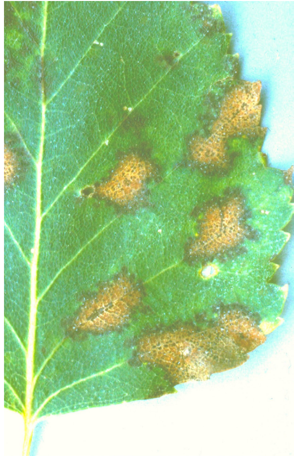
Marssonina betulae -sienen aiheuttamia laikkuja koivun lehdellä. TK

TUHORISKIN ARVIOINTI: Koivun kasvatusalueille ei tavallisesti jää koivunlehtiä, joista tauti pääsisi seuraavana keväänä tarttumaan uusiin taimiin.