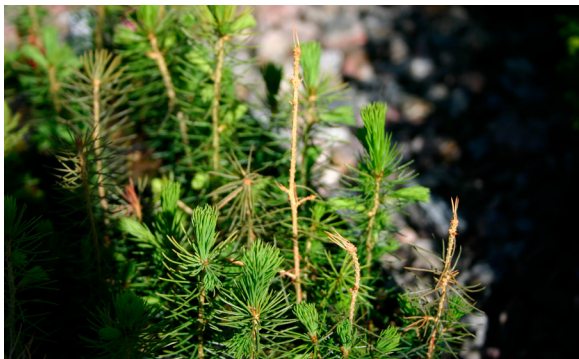
Tartutuskokeessa havupuidenlumihomeen kuivattamia yksivuotiaiden kuusen taimien latvoja ja silmuja.

SAMANKALTAISET TUHOT: Mustalumihomeessa rihmaston kimppuihin sitomat neulaset ruskettuvat samalla tavoin ja pysyvät toisiinsa sitoutuneena syksyyn asti. Versosurmaoireet voivat olla samanlaisia, mutta ne tulevat esiin myöhemmin, eivätkä heti lumen sulamisen jälkeen. Syksyiset kuivumisvauriot ilmenevät samanlaisena taimien ruskettumisena. Kuusella keväthava ruskettaa neulaset nopeasti samalla tavoin.