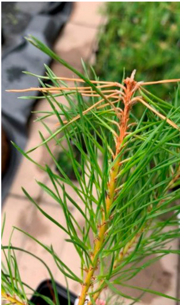
Etelänversosurman oireet näkyvät männyn taimen verson kärjessä. ET

Sieni voi esiintyä myös pitkään piilevänä kasvissa, ja aiheuttaa oireita vasta kun taimet kokevat lisääntyvää stressiä esim. istutuksen jälkeen.