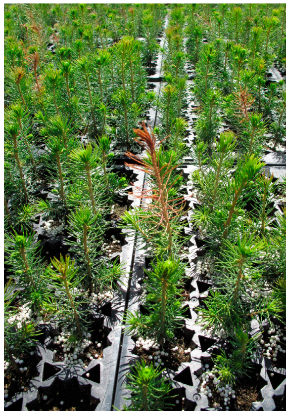
Taimikoro on iskeytynyt kasvussa oleviin kuusen latvoihin. KH