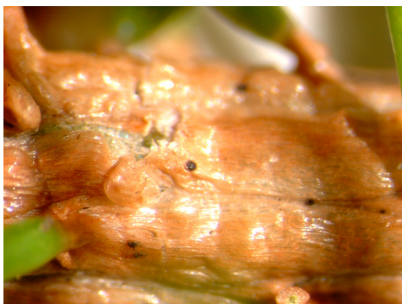
Sirococcus conigenus -sienen mustia, piste mäisiä itiöpulloja taimen alaosan kuorella. AL

TUHORISKIN ARVIOINTI: Mikäli käpyjä kerätessä ylivuotisia käpyjä lisätään uusien joukkoon, tautiriski lisääntyy. Kasvustoissa näkyvät pystyyn kuolleet sirkkataimet kertovat taimikororiskistä.