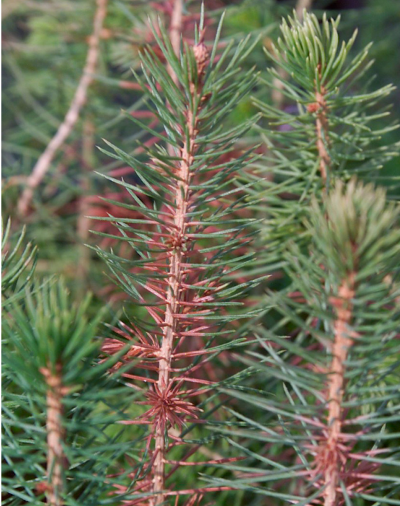
Kuusien taimilla surmakan keväällä ruskettamat neulaset ovat usein taimen keskiosassa. RLP