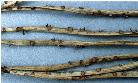
Havupuidenlumihomeen kostealla säällä avautuneita itiöpesäkkeitä männyn neulasilla. TK

Tautia voi esiintyä myös pakkasvarastoituidulla taimilla. Silloin oireita ovat taimien harmaa yleissävy ja neulasten täplikkyyttä.