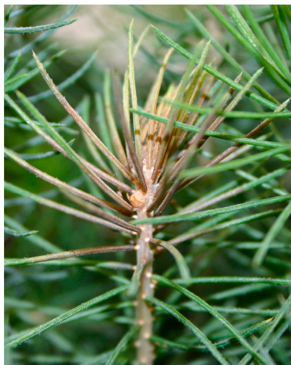
Harmaahometartunta kuusen latvassa. RLP

TUHORISKIN ARVIOINTI: Sateiset kesät ja ankarat hallajaksot lisäävät tautia.