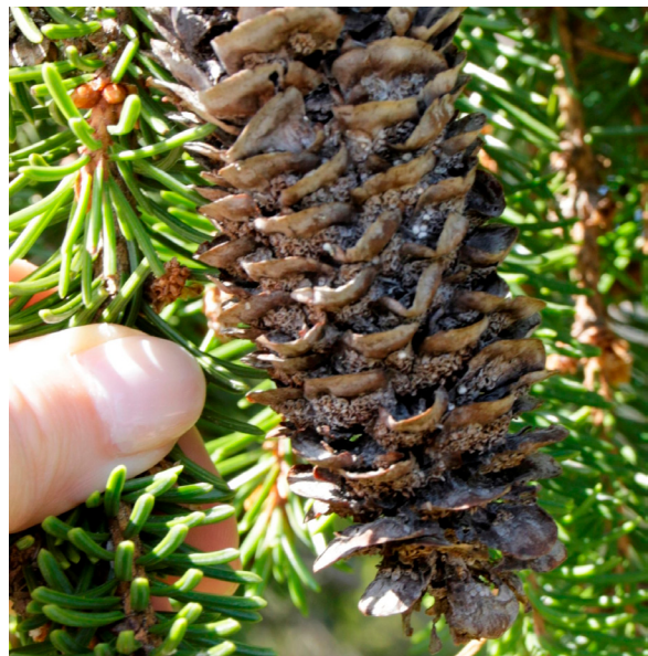
Kuusentuomiruosteen helmi-itiöpesäkkeitä käpysuomujen välissä. Tauti siirtyy sairaista kävyistä tuomeen ja sen varisseista lehdistä taimiin tai uudelleen uusiin käpyihin. KH

TARTUNTA: Sieni tarttuu kuusen emikukkiin tai kasvussa oleviin kuusen versoihin alku-