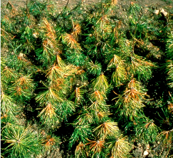
Versosurmassa männyn neulaset kääntyvät tyypillisesti sateenvarjomaisesti alaspäin. SL

eteneminen aktivoituu ja rihmasto pääsee kasvamaan verson elävään soluksoon.