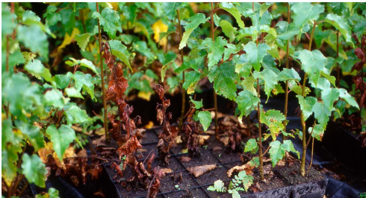
Kuolleita levälaikkuisia koivun taimia. AL