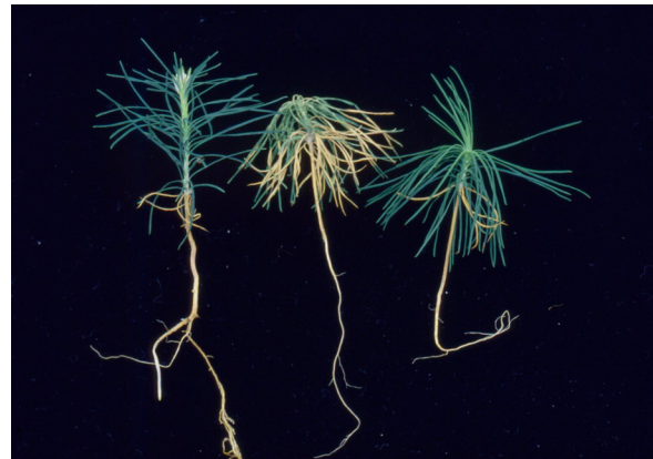
Lahojuurisia männyn taimia.

MAHDOLLISUUDET: Lahojuurisuus lisää kasvustojen kokovaihtelua mikä vaikeuttaa taimien kastelua ja lannoittamista. Lahojuurisat taimet eivät ole metsänviljelykelpoisia, sillä osa niistä kuolee ja elossa olevien kasvu on selvästi terveitä heikompaa.