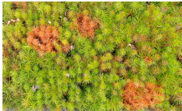
Laikuissa havupuidenlumihometartunnan saaneita männyn taimia keväällä. MP

TUHORISKIN ARVIOINTI: Taimitarhan ympäristössä olevien mäntyjen lumen alle jäävissä osissa on usein lumihometartunta, josta tauti voi levitä tarhalle. Sateiset syyskesät ja pakkasten viipyminen lisäävät tautia.