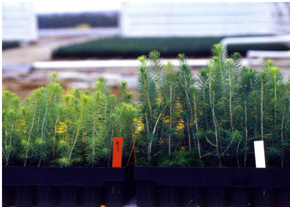
Vasemmalla olevissa taimissa lahojuurisuus näkyy vaaleampana värinä ja huonompana kasvuna verrattuna oikeanpuolen terveisiin taimiin. AL

juuria. Paakuissa olevat ilmaontelot epätaimisen täytön seurauksena tai kasvualustan sisältämät vettä hylkivät kappaleet estävät juuristoa sitomasta paakkua kunnolla. Liian myöhään kylvetyt taimet eivät myöskään ehdi sitoa juuripaakkua.