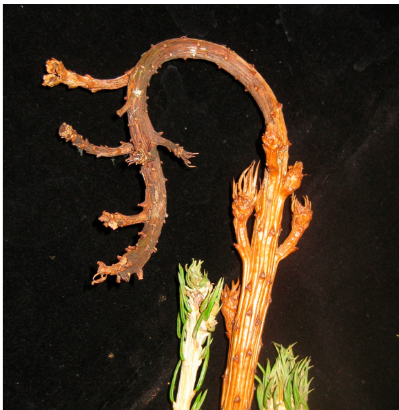
Kuusentuomiruoste kuivattaa ja käyristää kuusen taimien uudet kasvaimet. AL

Kuusen käpyjen saadessa infektion, käpysuomujen alapinnoille muodostuu kookkaita itiöpesäkkeitä ja kävyt aukeavat ennenaikaisesti.