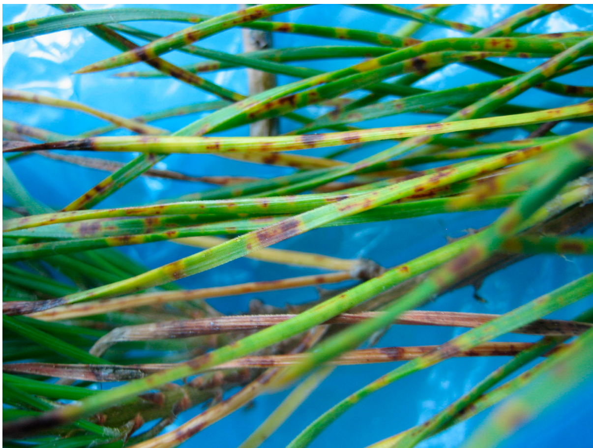
Harmaakaristeen oireet näkyvä aluksi neulasissa ruskeanvioletteina vöinä. PP

TARTUNTA: Sienen koteloitiöt tarttuvat kesä-heinäkuussa vielä kasvussa olevien neulasten kantaosaan, mutta neulaset jatkavat pituuskasvuun. Tartuntakohta on myöhemmin näkyvässä täysikasvuissa neulasissa pihkaisena poikkivöinä. Seuraavana vuonna neulasille kehittyvät