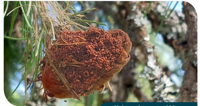
Koisaperhosen toukkien syömiä lehtikuusen käpyä.