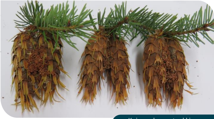
Koisaperhosen toukkien syömiä douglaskuusen käpyjä.

Douglaskuusen kävyistä löytyneitä toukkia sekvensoitiin onnistuneesti 50 kappaletta. Niistä 43 oli männynkäpykoisia ja neljä männynversokoisaa ( Dioryctria simplicella ). Jälkimmäistä lajia tavattiin vain yhdessä keruupaikassa. Yksi toukista oli kävyille harmiton Macrocentrus -suvun pistiäinen.