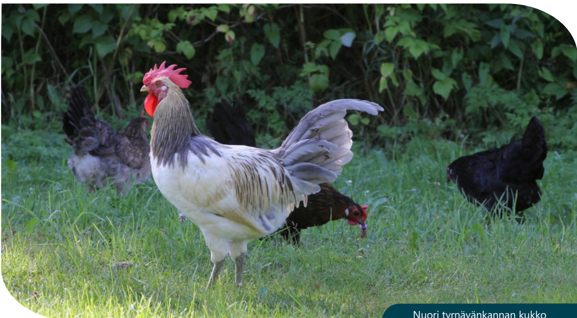
Nuori tyrnävänkannan kukko kanoineen.