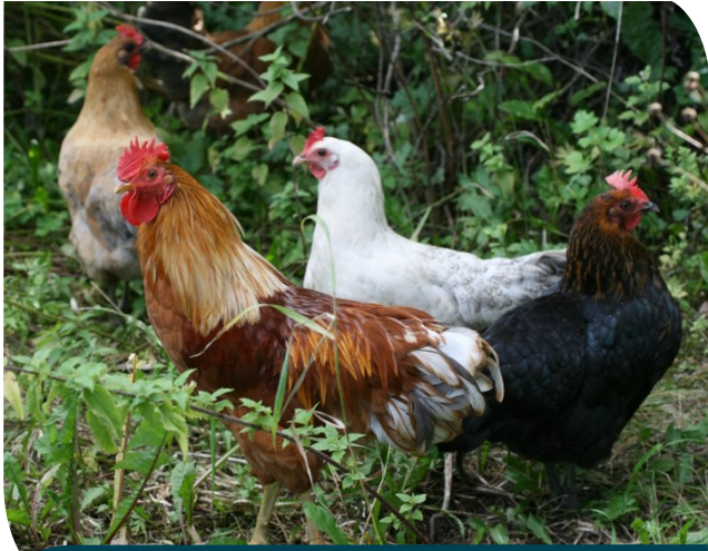
Aikuisia tyrnävänkannan lintuja.

Maatiaisiksi tyrnävänkannan kanat ovat verrattain hyviä munimaan. Muninnan kanat aloittavat yleensä 18-22 viikon iässä. Munien väri vaihtelee valkoisesta vaaleanruskeaan, joittenkin kanojen munissa on kiiltävä pinta, myös valko- tai tummapilkullisia munia esiintyy. Tyrnävänkannan kanat ovat kohtalaisen hautomaintoisia, hautomavaisto vaihtelee eri parvissa/sukulinjoissa. Hautomavaistoilla kanoilla on lähes poikkeuksetta vahva hoivavietti ja ne ovat hyviä emoja tipuilleen. Jotkut kukotkin voivat osallistua tipujen hoitamiseen.