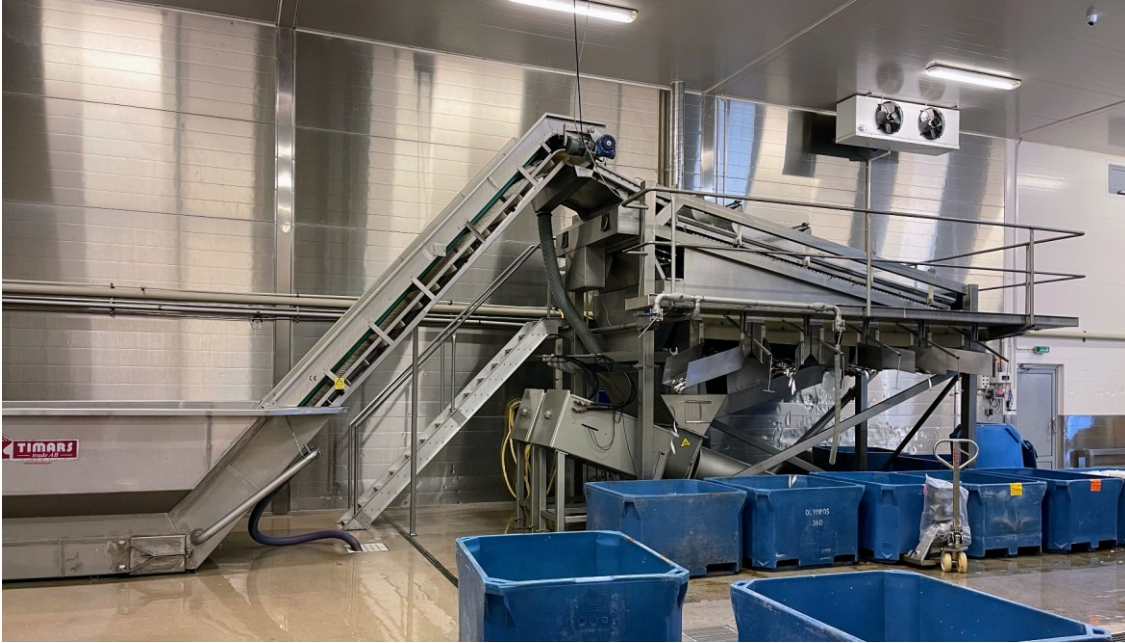
Kuva 2. Silakanlajittelukone vaatii lajittelukeskuksessa tilaa. Kalat tippuvat koneesta kokolajiteltuina paljuihin.