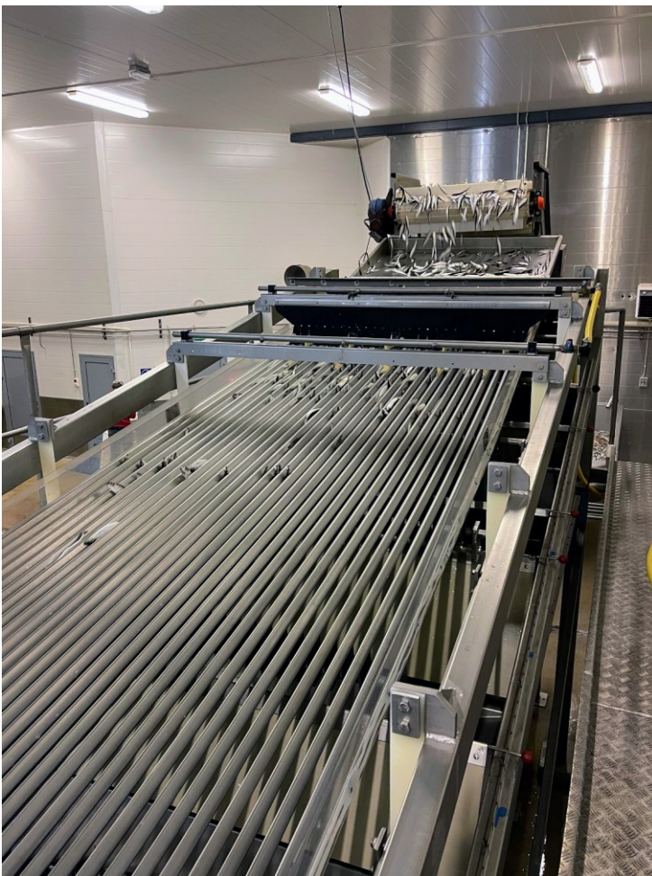
Kuva 3. Silakanlajittelukone ylhäältä päin. Pinnojen välit suurenevat tärinän viedessä kalayksilöitä eteenpäin. Kalat tippuvat kokonsa mukaan pinnojen väleistä oikeaan laariin ja ohjautuvat paljuihin koneen sivulle.