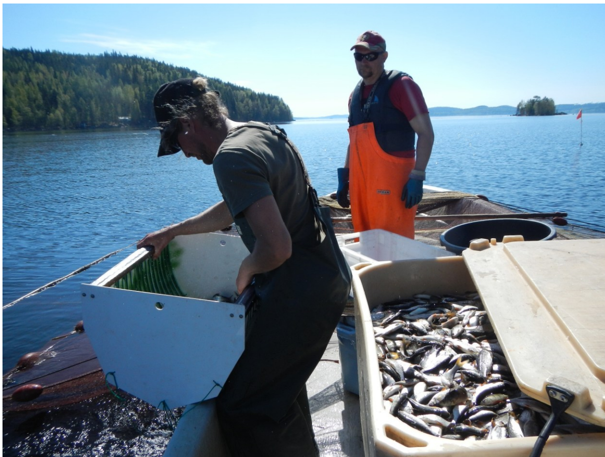
Kuva 1. Veneen kylkeen sijoitettava lajittelulaite.

Särkikalojen kohdalla sivutuotteiden ja hävityksen kustannukset muodostavat poikkeuksellisen merkittävän lajittelua ohjaavan tekijän. Mikäli pientä kalaa ei voi myydä rehuksi, tai se on käyttökelvotonta, kalan hävittäminen edellyttää hyväksytyjä käsittelyreittejä. Hävittäminen aiheuttaa kustannuksia, jotka voivat nousta merkittäviksi erityisesti harvaan asutuilla alueilla. Tämä voi tehdä pienen kalan vastaanottamisesta taloudellisesti epäedullista ja tukee johtopäätöstä, että lajittelu jo pyyntivaiheessa on tällöin tehokkain tapa ehkäistä kustannusten kasvumista ketjussa.