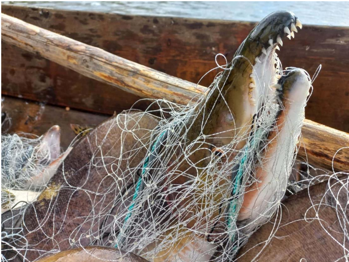
Figur 6. Pukkellaksens tenner vokser og stikker ut når gytetiden nærmer seg, og de kan lett hekte seg godt fast i garnet, og gjøre det vanskelig å få løs fisken og klargjøre garnet.

For å unngå å få opprinnelig atlantisk laks i fangsten, er det viktig å velge fiskeplasser riktig. Grunne grustak, spesielt nær bredden er områder hvor pukkellaks samles etter midten av juli, og hvor atlantisk laks på sin side ikke trives. Sannsynligheten for å fange atlantisk laks øker hvis det fiskes på dypere steder med strøm. Nøyaktig kartlegging av fiskeplassene er nødvendig hvis det fortsettes uttaksfiske av pukkellaks og det utvides til nye elveområder i fremtiden.