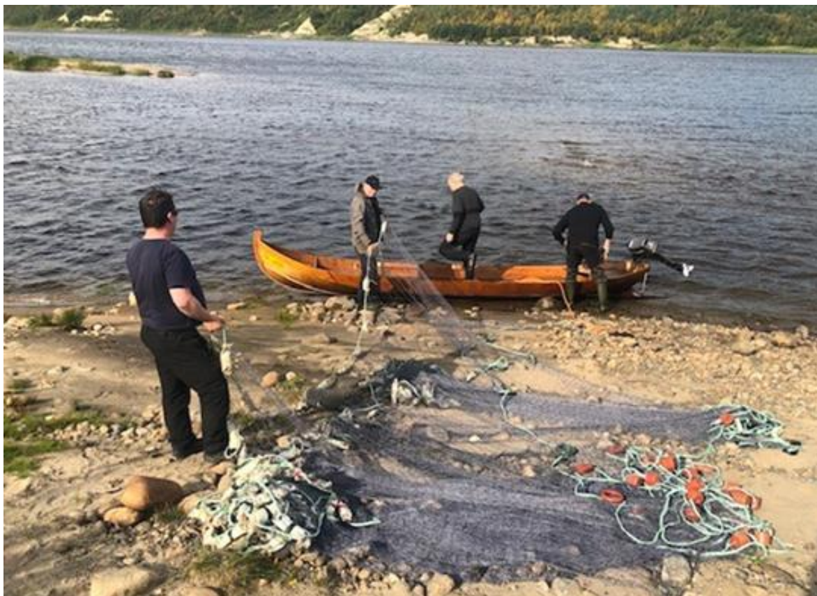
Figur 3. Forberedelser til prøvefiske med not nedenfor Alaköngäs i Boratbocka sommeren 2022.