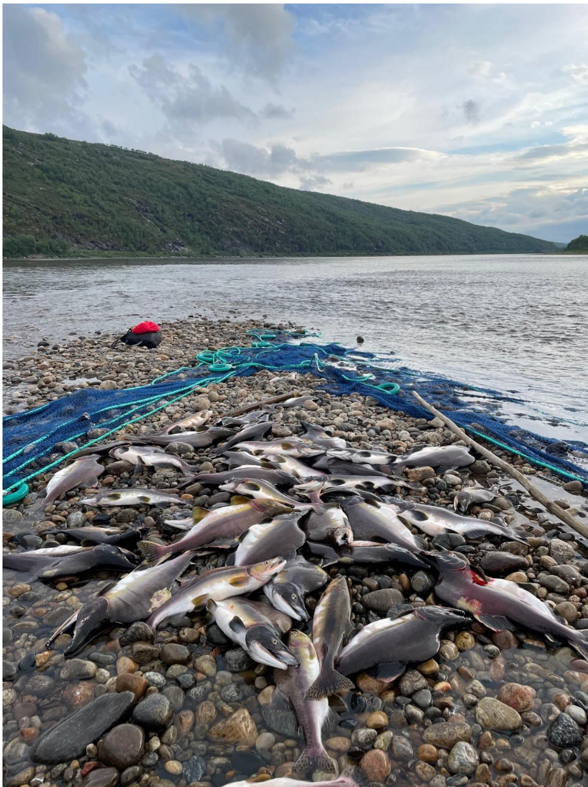
Figur 8. Notfiskefangst i Tana ovenfor Vetsikko. Notkastet ble foretatt på et grunt steinete område, hvor pukcellaks typisk samles i slutten av juli og begynnelsen av august, når gyte-sesongen nærmer seg.