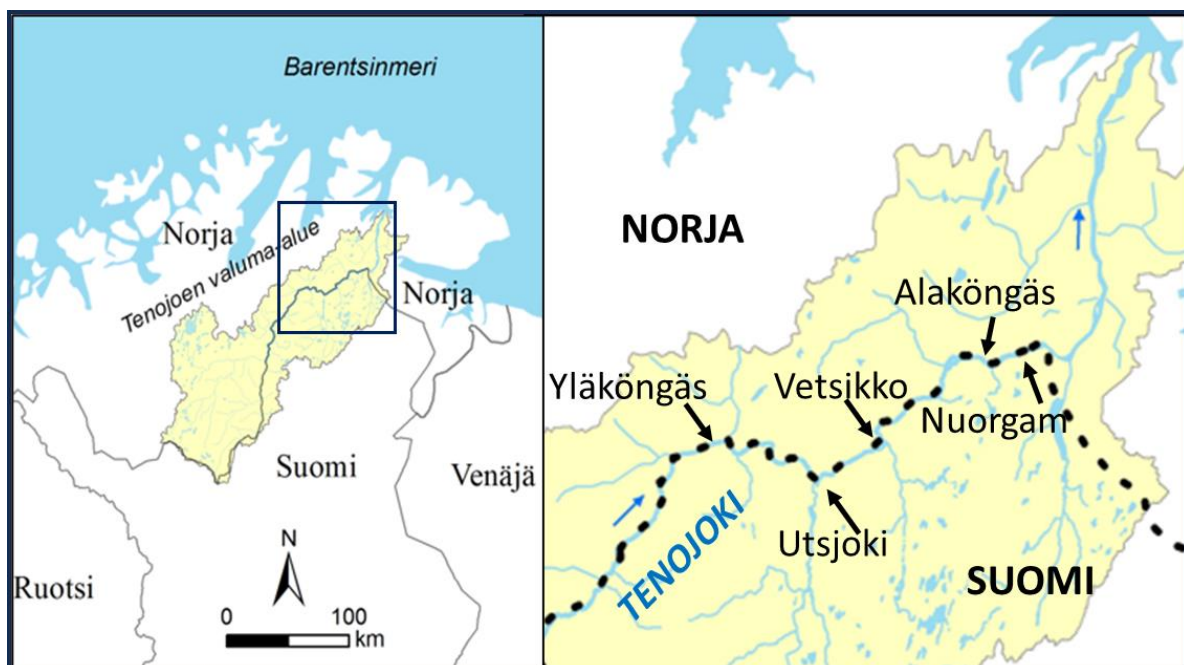
Figur 1. Tanavassdraget og pukkellaksens prøvefiskeområder i elvas midtre og nedre del.

Fiskeredskapene, bruken av dem og fiskeplassene søkte man å planlegge slik at atlantisk laks og andre opprinnelige fiskearter i minst mulig grad ble fanget som bifangst. Dette var et spesielt viktig utgangspunkt i en situasjon hvor bestandene av atlantisk laks i Tanaelva var på bunnen av en bølgedal, og siden laksefiske har vært helt forbudt fra år 2021 (Anon 2024).