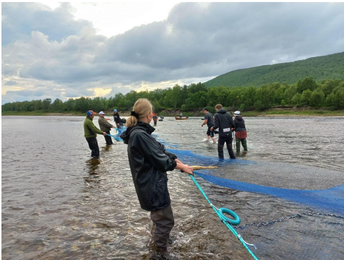
Figur 7. Notfiske i Tana ovenfor Vetsikko. Til håndtering av den omtrent 100 m lange nota ved lavt vann på steingrunn trengs det båter og arbeidskraft.