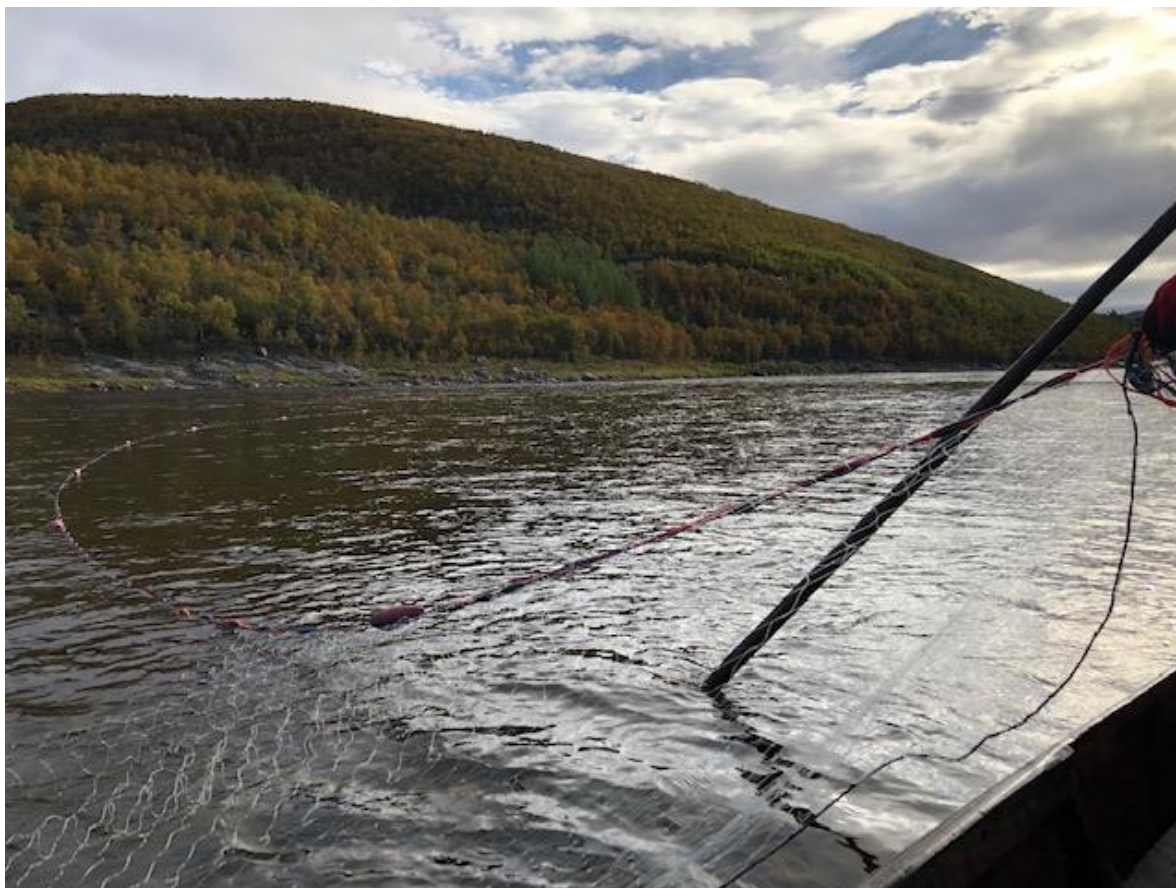
Figur 2. Drivgarn utprøves i Aittisuvanto ovenfor Utsjoki i august 2022.