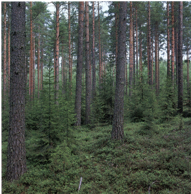
Kuva 3. Pohjoisten alueiden metsät ovat pääasiassa havupuuvaltaisia ja tehokkaan metsätalouden piirissä. Kuvassa suomalaista talousmetsää.

vähäisempi kuin EY:n alueella. Yksityismetsät ovat pirstoutuneita, mutta eivät siinä määrin kuin EY-maissa.