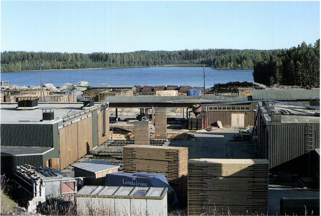
Kuva 7. Sahateollisuutemme kapasiteetti on viime vuosien aikana supistunut ja sahaus keskittynyt integraattien yhteyteen. Integroimattomien PK-sahojen osuus vuotuisesta tuotannosta on nykyään noin 40 %.

taso on yleensä matala, sivutuotteiden käyttö teollisuuden raaka-aineena on vähäistä ja tuotanto on tarkoitettu lähinnä paikalliseen rakentamiseen (Sahateollisuuden tulevaisuus 1988).