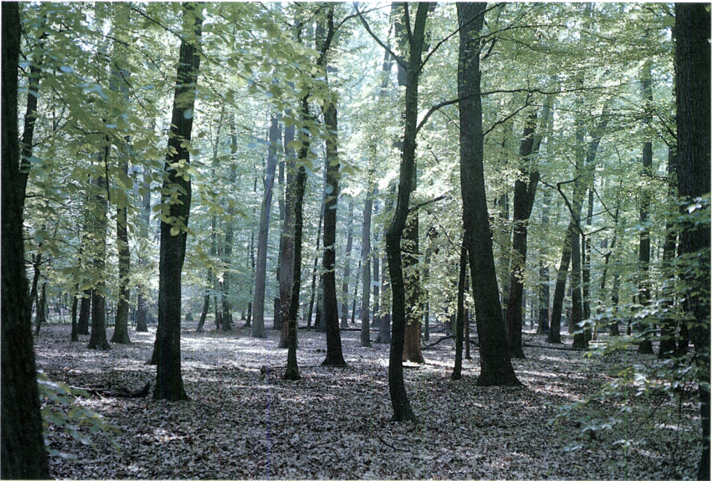
Kuva 2. Pyökki on taloudellisesti merkittävä puulaji Keski-Euroopassa. Kuvassa saksalaista pyökkimetsää.

EY:n hakkuumäärä vuonna 1990 oli 137 milj. m 3 . Metsien kokonaiskasvusta EY:ssä arvioidaan hakattavan 70 prosenttia. Osasyynä tähän on, että ensiharvennukset eivät ole taloudellisesti kannattavia. Myös puutavaramarkkinoiden kehittymättömyys on ongelma suurimmassa osassa EY:n aluetta. Ongelmaa korostaa metsien omistuksen pirstoutuminen pinta-alaltaan hyvin pieniin yksikköihin.