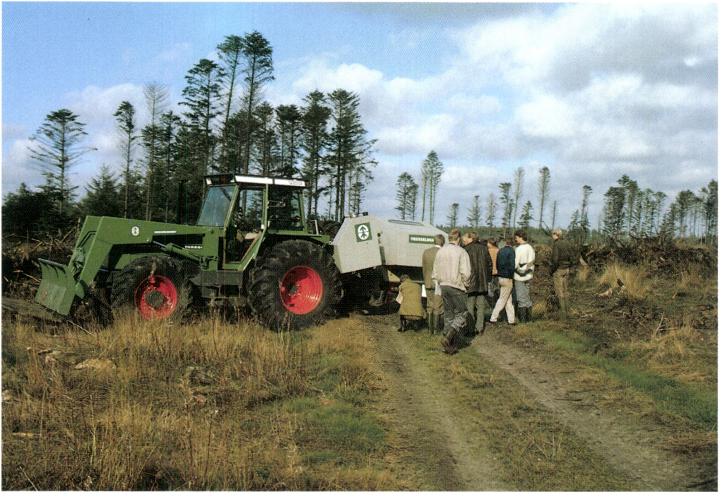
Kuva 9. Kuva on Tanskasta, Keski-Jyllannista. Kuten Irlannissa ja Iso-Britanniassa metsätalous Tanskassa on lähes kokonaan intensiivistä viljelymetsätaloutta. Kuvassa perustetaan kuusen viljelymetsikköä.

railla puulajeilla ja alkuperillä perustetuista viljelymetsistä. Tämä selvä ero sisältää sekä riskejä että mahdollisuuksia metsäpolitiikkaa mahdollisesti aktivoitaessa.