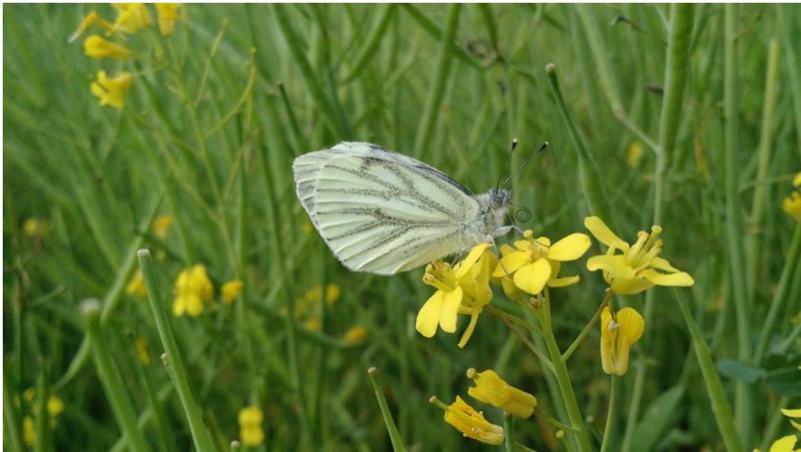
Kuva 6. Lanttuperhonen ( Pieris napi ) rypsillä.

Maatalousympäristöissä esiintyvät päiväperhoset ovat tyypillisesti sidoksissa ei-viljeltyihin maisemaelementteihin (Kivinen ym. 2006). Suomen maatalousmaisemissa erityisesti niitty laikut, metsän reunaympäristöt ja avoimet tai puoliavoimet pientareet suosivat päiväperhosia (Kuussaari ym. 2007). Viljellyillä pelloilla esiintyvät ja sieltä ravintoa etsivät päiväperhoset ovat yleensä hyvin liikkuvaisia ja elinympäristöjensä suhteen vaatimattomia lajeja (Börschig ym. 2013, Gámez-Virues ym. 2015). Yksipuolisissa peltovaltaisissa maisemissa päiväperhoslajistoa luonnehtiikin juuri näiden liikkuvaisten generalistilajien korkea osuus (Ekroos ym. 2010b, Jonsson ym. 2012).