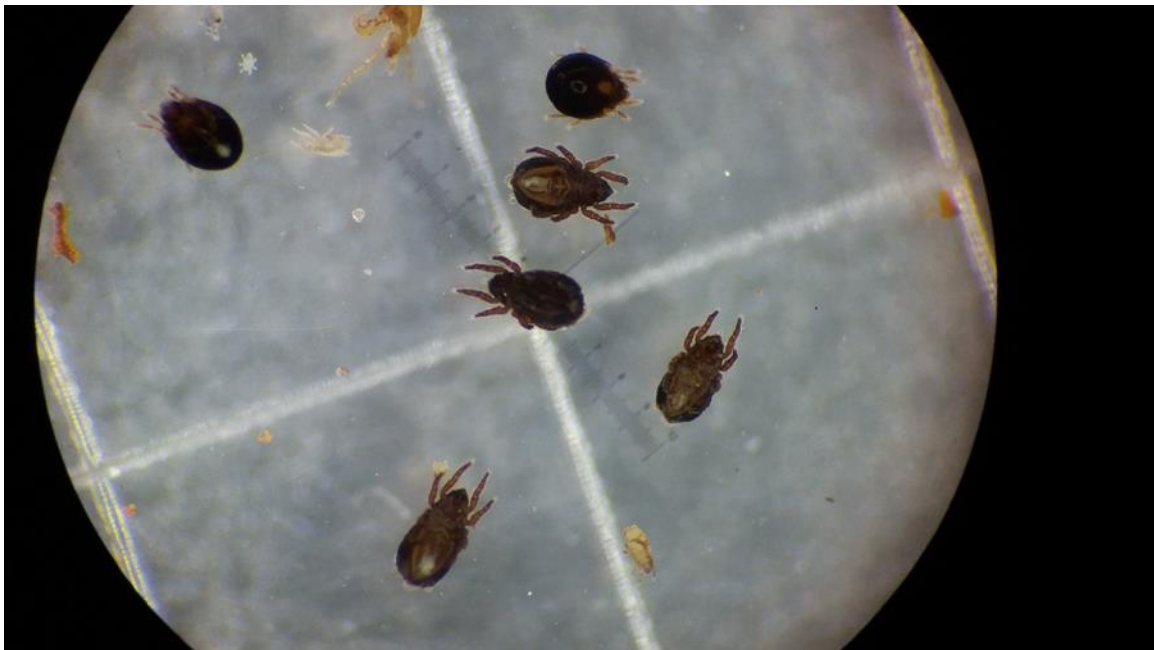
Kuva 16. Mikroniveljalkaisia.

Suurin ero maaperäeliöiden määrässä ja diversiteetissä oli nurmen ja viljan välillä: nurmipelloilla änkyrimatojen määrä oli viisi, sukkulamatojen määrä 3–9 ja mikroniveljalkaisten määrä 5–7 kertaa suurempi kuin viljapelloilla. Sen sijaan sillä, oliko kyseessä tavanomainen vai luomupelto ei ollut suurta vaikutusta kyseisten ryhmien yksilömääriin. Poikkeuksen tekivät sienia syövät sukkulamadot sekä lierot, joiden määrä oli suurempi luonnonmukaisesti kuin tavanomaisesti viljellyllä viljapelloilla. Sienia syövien sukkulamatojen runsaus selittyi luonnonmukaisesti viljeltyjen viljapeltojen suuremmalla sienimäärällä verrattuna tavanomaisesti viljeltyihin viljapeltoihin (Peltoniemi ym. 2021). Tutkimuksessa kaikkien maaperäeläinten runsautta ja diversiteettiä selittivät parhaiten eri käsittelyissä lannoitteena käytetyn lannan määrä sekä erot viljelykierrossa käytetyissä kasvilajeissa (tuotantosuunnasta riippumatta). Lierojen osalta merkittävä tiheyteen vaikuttava tekijä on myös maan muokkaus: kyntö katkaisee lieroja ja rikkoo niiden kanavia. Kyntämättömyys lisää erityisesti syvälle kaivautuvien lierojen määrää riippumatta siitä onko pelto tavanomaisesti ja luonnonmukaisesti viljelty.