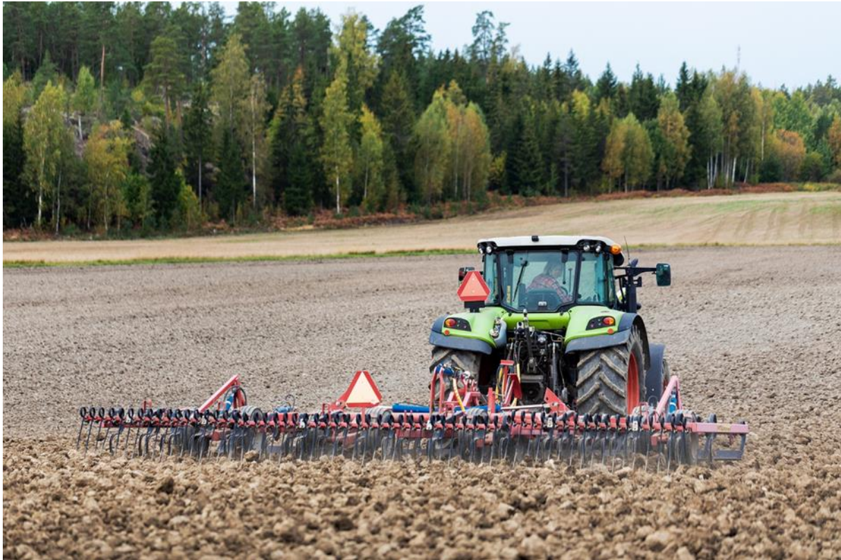
Kuva 14. Maanmuokkaustoimet vaikuttavat maaperäeliöstöön.

Pohjoisissa oloissa tehtyjä tutkimuksia eri tuotantotapojen ja viljelymenetelmien vaikutuksista maaperäeliöiden määrään ja yhteisöstruktuuriin löytyy niukasti. Laajin Suomessa toteutettu tutkimus on Palojärven ym. (2002) vertaisarvioimaton raportti, jossa vertailtiin luomu- ja tavanomaisesti viljeltyjä peltopareja. Keskimäärin sukkulamatojen (erityisesti kasvinsyöjien ja kaikkiruokaisten) määrä ja biomassa oli suurempi luomu- kuin tavanomaisesti viljellyillä peltoaloilla, mikä voi heijastaa maan alle päätyvän kasvibiomassan määrää, mutta myös hoitotoimenpiteiden intensiteettiä. Hyppyhäntäisten ja punkkien määrät ja alalahkot/lajit vaihtelivat paljon peltoparien välillä sekä vuoden että vuodenajan mukaan. Selkeänä erona todettiin Isotomidae-heimoon kuuluvien hyppyhäntäisten suurempi määrä luonnonmukaisesti kuin tavanomaisesti viljellyillä aloilla.