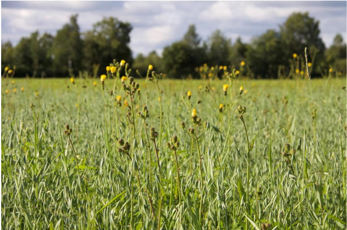
Kuva 2. Valvattia luomukaurapellossa.

Koska lajimäärä on riippuvainen yksilömäärästä, Hyvönen ym. (2003) vertailivat tavanomaisesti viljeltyjen karja- ja viljatilojen kevätiljapeltojen rikkakasvien lajimääriä luomupeltojen lajimääriin ottamalla tämän riippuvuuden huomioon tilastanalyysissä. Lajimäärät erosivat luomun eduksi, mutta lajimäärien keskimääräinen ero oli vain kaksi lajia. Ero oli samansuuruinen sekä touko-kesäkuussa että heinä-elokuussa, tavanomaisesti viljeltyjen peltojen rikkakasvien torjunta-ainekäsittelyn jälkeen. Kokonaislajimäärät erosivat tuotantotapojen välillä ainoastaan heinä-elokuussa.