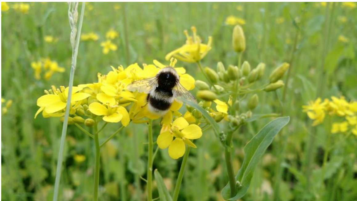
Kuva 5. Mantukimalainen ( Bombus lucorum ) kuuluu suomalaisten rypsipeltojen yleisimpiin pölyttäjiin.

Toistaiseksi ei ole julkaistu tutkimuksia, jotka suoraan osoittaisivat kasvinsuojeluaineiden käytöllä olevan tällaisia ei-tappavia tai viiveellä ilmeneviä haittavaikutuksia pölyttäjiin borealisella vyöhykkeellä. Viitteitä tästä on kuitenkin havaittu. Hokkanen ym. (2017) raportoivat hyönteispölytteisen rypsin satotasojen laskusta Suomen intensiivisimmin viljellyillä alueilla 2000-luvulla, ja pitivät todennäköisenä selityksenä neonikotinoidien käytön yleistymistä rypsin siementen peittauksessa ja tämän aiheuttamaa pölytysvajetta. Toivonen ym. (2019) puolestaan havaitsivat suomalaisilla rypsipelloilla tehdyssä tutkimuksessa, että pölyttäjien määrä lisääntyi rypsin kukintakauden aikana erityisesti niiden peltöjen joukossa, joilla ei käytetty kasvinsuojeluaineita. Tulos saattaa selittyä rypsin tärkeimpien pölyttäjien, tarhamehiläisten ja kimalaisten, yhdyskuntien paremmalla kasvulla kasvinsuojeluaineettomien peltöjen läheisyydessä (Toivonen ym. 2019).