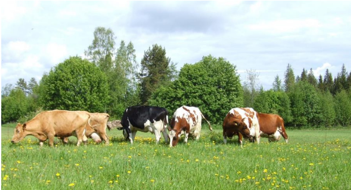
Kuva 11. Luomukotieläintiloilla lehmät laiduntavat päivittäin laidunkaudella.

alaan. Tutkimuksessa havaittiin luomueläintilojen merkittävästi lisäävän peltolinnuston kokonaisuusilömääriä verrattuna sekä tavanomaisiin tiloihin (riippumatta tuotantosuunnasta) että luomuviljailoihin. Luomueläintiloilla laidunnus on tavanomaisista eläintiloista poiketen pakollista, mikä osaltaan riittäisi selittämään, miksi monet hyönteissyöjälinnut hyötyivät luomueläintiloista (Santangeli ym. 2019). Erityisesti pihapiirissä pesivät lintulajit, kaukomuuttajat sekä hyönteissyöjät hyötyivät luomueläintiloista.