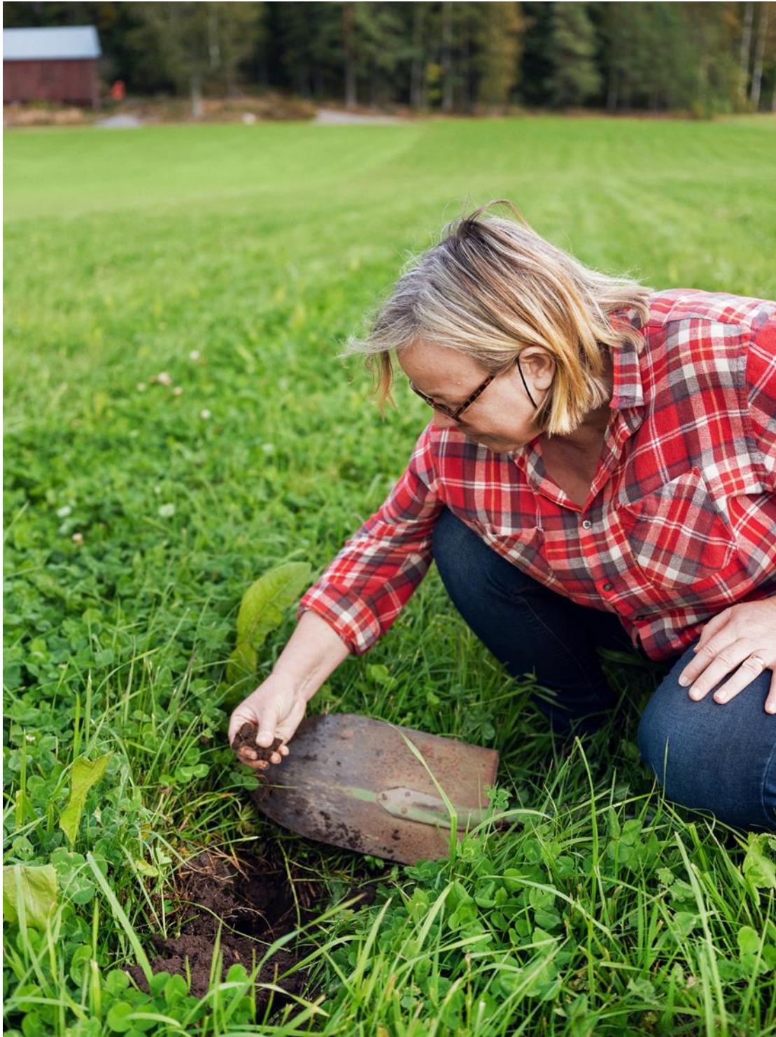
Kuva 13. Monivuotiset apilanurmet ruokkivat maaperäeliöstöä ja lisäävät peltomaan multavuutta.

Kaikissa tutkimuksissa ei eroja maaperän mikrobiyhteisöjen monimuotoisuudessa luomu- ja tavanomaisten viljelykäytäntöjen välillä ole havaittu (esim. Reganold & Wachter 2016). Hiljattain tehdyissä meta-analyseissa on saatu osin ristiriitaista tietoa luomuviljelyn vaikutuksesta maaperän biologiseen monimuotoisuuteen (de Graaff ym. 2019, Christel ym. 2021). Haasteena luomuviljelyn vaikutusten erottamisessa meta-analyysissä on, että tuotantotapoihin liittyvät toimenpiteet erosivat suuresti kokeiden välillä. Yleensä tavanomaista ja luonnonmukaista