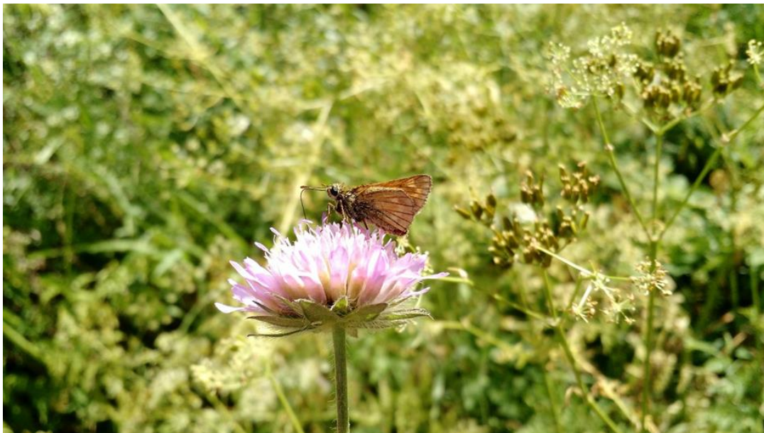
Kuva 7. Piippopaksupää ( Ochlodes sylvanus ) on Suomessa yleisesti esiintyvä perhoslaji, jota tavataan niityillä ja kedoilla.

Myös luomutuotannon laajuudella on merkitystä: päiväperhosten lajimäärä on havaittu korkeammaksi tavanomaisilla tiloilla, joiden ympäröivä maisema on lähes kokonaisuudessaan luomutuotannon piirissä (Rundlöf ym. 2008). Vastaavasti yksittäisille luomutiloille voi kertyä enemmän perhosyksilöitä maieimissa, jotka ovat muilta osin tavanomaisen tuotannon piirissä (Rundlöf ym. 2008).