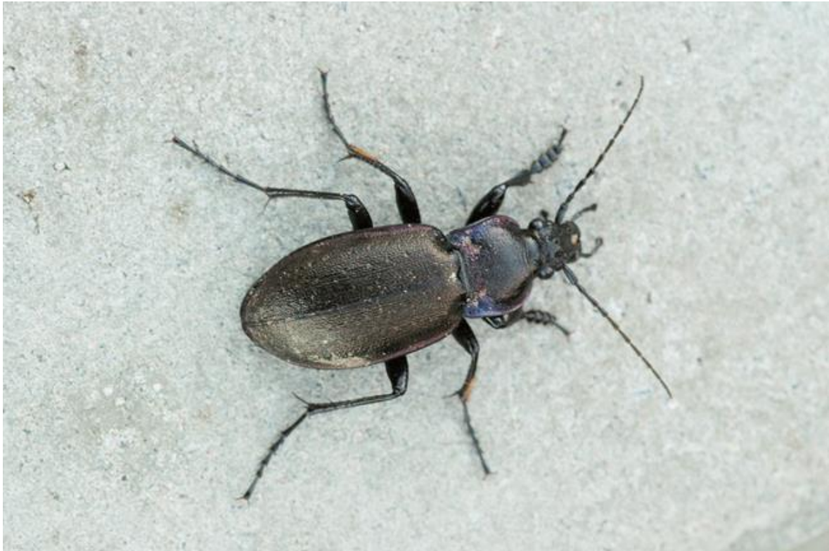
Kuva 9. Maakiitäjäisiä tunnetaan Suomessakin useita lajeja.

Luontaisen biologisen torjunnan osalta heikoimmin tunnetaan peto-saalissuhteen dynamiikka, sillä lähes kaikki tutkimukset perustuvat petojen ja saalislajien lukumääriin ilman todellista näyttöä niiden vuorovaikutuksesta. Yleisimmin havainnot saalistajien ravinnonkäytöstä perustuvat laboratorionkokeisiin. Petoniveljalkaisten ravinnonkäytön havainnointi kenttäolosuhteissa on työlästä, koska saalistus ei jätä näkyviä jälkiä ja monet lajit ovat yöaktiivisia. Eräät yleisimmistä maakiitäjäislajeista täydentävät ruokavaliotaan rikkakasvien siemenillä, ja niiden runsaus voisi siten edistää myös rikkakasvien hallintaa, mutta tämän vaikutusta ei liene Suomessa tutkittu.