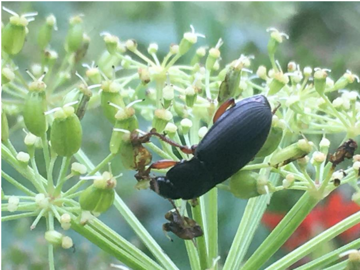
Kuva 8. Karvakiitäjäinen ( Harpalus rufipes ) voi käyttää ravinnokseen myös rikkakasvien siemeniä.

Suomen maatalousympäristössä esiintyvät petoniveljalkaislajit ja niiden elintavat tunnetaan hyvin. Kasvinsuojelukemikaalit ja maan muokkaaminen lisäävät merkittävästi niveljalkaisten kuolleisuutta (esim. Legrand ym. 2011), joten valtaosa lajeista talvehtii menestyksekkäästi vain viljelmien ulkopuolella. Erityisesti alkukesästä saalistajien runsauteen vaikuttaa niille sopivien talvehtimispaikkojen saatavuus (Jacobsen 2022) ja kasvukauden aikana viljelmälle saapuvien saalistajien elinkierrot limittyvät toisiaan täydentävästi. Lisäksi saalistajien ravinnonkäyttö muovautuu niiden fyysisen koon, elinkierron, kilpailun sekä eri ravintokohteiden saatavuuden mukaan. Monimuotoinen saalistajayhteisö on siksi ajallisesti ja toiminnallisesti laaja-alaisempi kuin muutamien lajin dominoima, köyhtynyt saalistajien joukko. Monimuotoinen eliöyhteisö myös palautuu häiriöistä köyhtynyttä nopeammin. Peltolohkojen pieni koko ja maatalousympäristön monimuotoisuus tukevat biologista torjuntaa laaja-alaisesti (Haan ym. 2020).