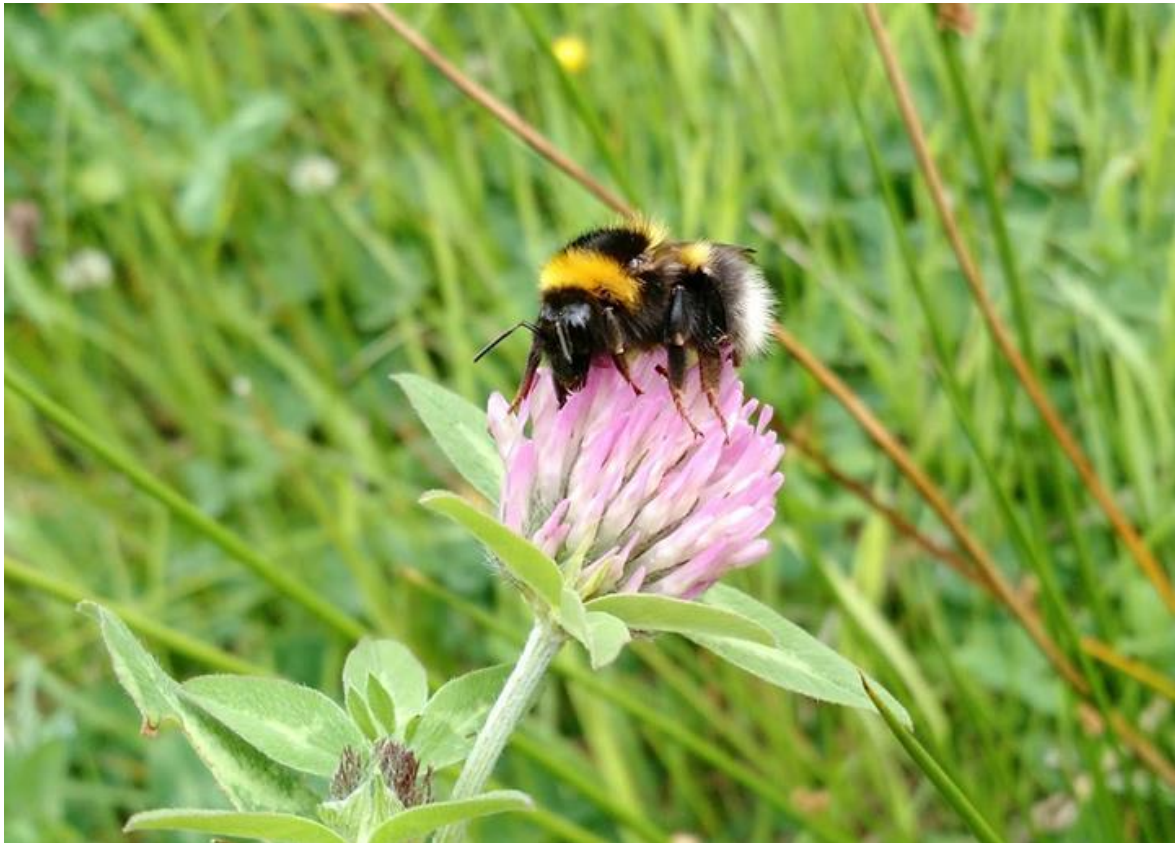
Kuva 4. Tarhakimalainen ( Bombus hortorum ) ruokailemassa puna-apilalla.

Luomutuotanto voi lisätä pölyttäjien ravinnon määrää, monimuotoisuutta ja ajallista jatkuvuutta peltoilla kasvillisuuden monimuotoisuuden lisääntymisen kautta (Hyvönen & Salonen 2002, Carrié ym. 2018). Lisäksi luomutuotantoon kiinteästi kuuluva palkokasvien viljely hyödyttää pölyttäjiä: etenkin kimalaisten tiedetään suosivan monia palkokasveja ravinnonlähteenä (Teräs 1985, Goulson ym. 2005) ja esiintyvän runsaina esimerkiksi puna-apila- (Teräs 1976) ja härkäpapupeltoilla (Toivonen ym. 2022a). Puna-apila on erityisen tärkeä ravintokasvi pitkäkielisille kimalaislajeille, jotka ovat erikoistuneet keräämään ravintoa syväteriöisistä kukista (Teräs 1976, 1985, Dupont ym. 2011, Bommarco ym. 2012). Ruotsissa ja Tanskassa pitkäkielisten kimalaislajien on raportoitu taantuneen, ja yhtenä syynä kehitykseen pidetään puna-apilan viljelyn vähenemistä (Dupont ym. 2011, Bommarco ym. 2012).