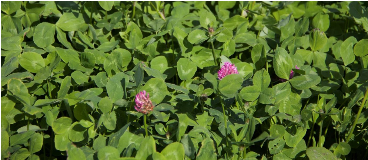
Kuva 1. Luomutilojen viljelykiertoissa hyödynnetään palkokasvien, kuten puna-apilan typensidontaa.

Viljelykiertoa on noudatettava kaikilla luomuvalvontaan kuuluvilla lohkoilla. Viljakasveja tai palkoviljoja voi olla enintään kolmena vuotena ja perunaa sekä saman kasvisuvun yksivuotisia erikoiskasveja enintään kahtena vuotena peräkkäin kullakin lohkoilla. Luomutilat hyödyntävät monipuolisesti alus- ja kerääjäkasveja ja sekaviljelyä (Känkänen & Iivonen 2021), mutta kattavaa vertailua luomutuotannon ja tavanomaisen tuotannon viljelykiertojen eroista ei ole meillä saatavilla.