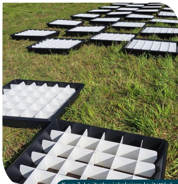
Kuva 2. Levityskuviokokeissa levitettävä lannoite kerätään standardin mukaisiin keruustastioihin.