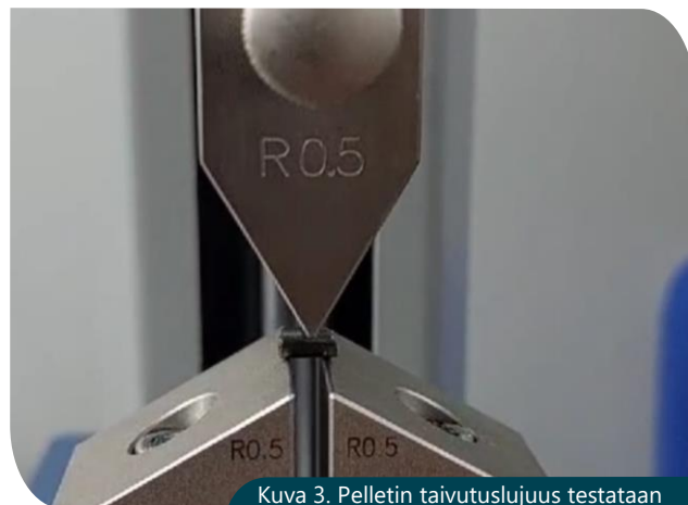
Kuva 3. Pelletin taivutuslujuus testataan mittaamalla pelletin murtumiseen tarvittava voima.

Vertailuaineistossa lannoitepellettien tiheyden (irtotilavuuspaino) ja pelletin lujuusarvojen välillä havaittiin vahvaa riippuvuutta. Eli tiheämpi pelletti on myös lujempi. Lujuusarvotkin olivat riippuvaisia keskenään, vaikka siirtojen ja kuljetuksen rasituskestävyyttä kuvaavaan rummutuslujuuteen (ISO 17831-1) vaikuttaa myös pellettien pituusjakauma.