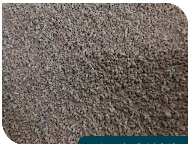
Kuva 1. Lannoitepelletin halkaisija on yleensä 4-6 mm, kun mineraalilannoitteen kokojakauma on yleisesti 2,5-4 mm.

Mineraalilannoitteet, joiden ominaisuuksille lannoitteenlevittimet on suunniteltu, ovat yleensä pellettilannoitteita tiheämpiä ja raekooltaan pienempiä.