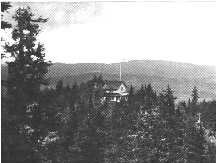
Kuva 1. Kolin ylämaja 1920-luvun alussa.

Kolilainen opettaja Ikonen perusti v. 1896 Kolin ylämajan Ukko-Kolin lähelle nykyisen hotellin liepeille. Ylämajalla ei ollut tungosta, sillä kolme vuotta myöhemmin siellä kävi 500 matkailijaa vieraskirjan mukaan. Kuvassa 1 on Kolin laajennettu ylämaja 1920-luvun alussa ja kuvassa 2 vuonna 1930 valmistunut järjestyksessä toinen ylämaja.