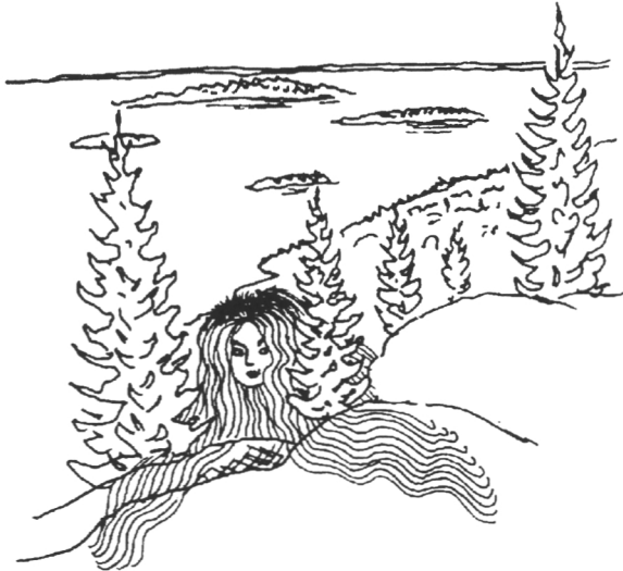
Kuva 1. Kolin henki katselee tyytyväisenä Ukko-Kolin huipulta vaaramaisemia ja Pielisellä siintäviä harjusaaria. Piirros: Seija Sulonen

Tärkeitä tutkimuskohteita ovat myös huuhta- ja lehtimetsäkaskialueet. Metsäntutkimuslaitos aloitti kaskeamisen Kolilla uudelleen 55 vuoden tauon jälkeen v. 1994, jolloin Kolin toimipisteen lähistöllä poltettiin hehtaarin suuruinen 60 vuotta vanha istutuskuusikko. Kolilla on tarkoitus polttaa joka vuosi huuhtakaski (viljelykuusikkoa) tai lehtimetsäkaski (koivuvaltaista sekametsää). Kaskenpoltolla turvataan kansallismaiseman ja luonnon säilyminen moni-ilmeisenä ja monimuotoisena. Kansallismaisemaan kuuluvat eri-ikäiset kaskialat: ahot, kaskelle syntyneet tuoreet niityt tai pienialaisina laikkuina tuoreen niittykasvillisuuden seassa esiintyvät kedot sekä kaskimetsät (koivikot ja lepikot). Suunnitelmissa ovat myös kontrolloidut metsäpalot luonnontilan palautuksessa, sillä tuli kuuluu pohjoisen havumetsän ekologiseen kiertoon ja näin mahdollistuvat myös paloekologiset tutkimukset. Huuhtakaskialueilla tutkitaan puulajien luontaista uudistumista, hyönteislajien esiintymistä, kasvi- ja sienilajien sukkessiokehitystä sekä eliöyhteisöjen rakennetta. Kansallispuistoon on perustettu kuusen geenireservimetsä (122 ha), jonka tarkoituksena on varmistaa kuusilajin perinnöllisen vaihtelun säilyminen tulevaisuuteen siltä varalta, että metsien käsittely ja ympäristön muutokset kaventaisivat vaihtelua.