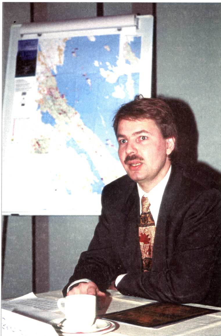
Kuva 1. Ympäristöministeri Pekka Haavisto seminaarin yhteydessä pidetyssä lehdistötilaisuudessa.