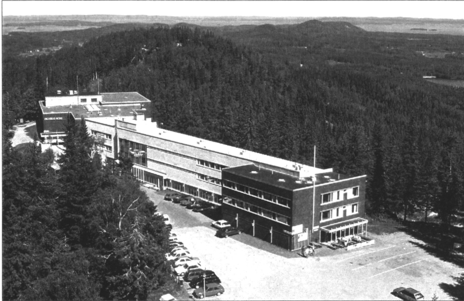
Kuva 4. Vuonna 1969 valmistui nykyinen hotelli Koli.

sa esitettiin v. 1973 luonnonsuojelun tehostamista Kolilla ja ympäristönsuojelun neuvottelukunta esitti 2030 hehtaarin suuruisen kansallispuiston perustamista ja edelleen v. 1976 kansallispuistokomitea ehdotti kansallispuiston perustamista Kolille 3820 hehtaarin suuruisena.