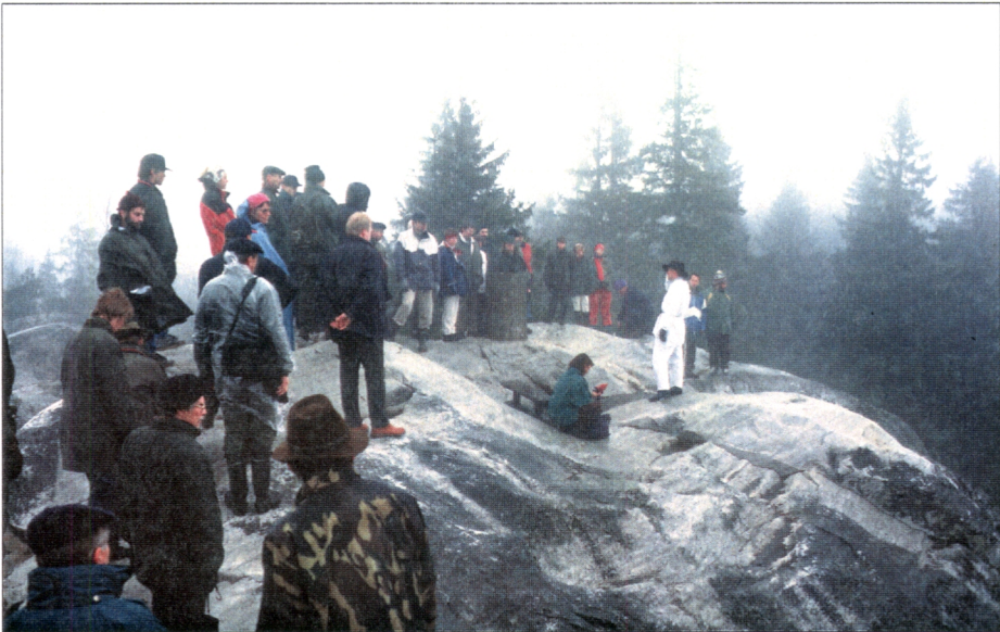
Kuva 2. Retkeilypäivänä Ukko-Koli oli pilvessä.