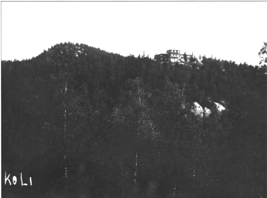
Kuva 2. Vuonna 1930 valmistui uusi ylämaja.

Asia eteni nopeasti ja jo seuraavana vuonna valtio osti kolme Kolin alueen keskeistä tilaa (Kopolan, Sikoniemen ja Kivelän tilat), yhteensä 1000 ha, turvatakseen alueen luonnonkauneuden ja siihen perustuvan matkailun. Asioitten ripeään etenemiseen saattoi vaikuttaa silloinen metsähallituksen ylijohantajana toiminut nurmeslaissyntyinen Hannikainen, joka ilmeisesti tunsu Kolin mahtavat maisema-arvot.