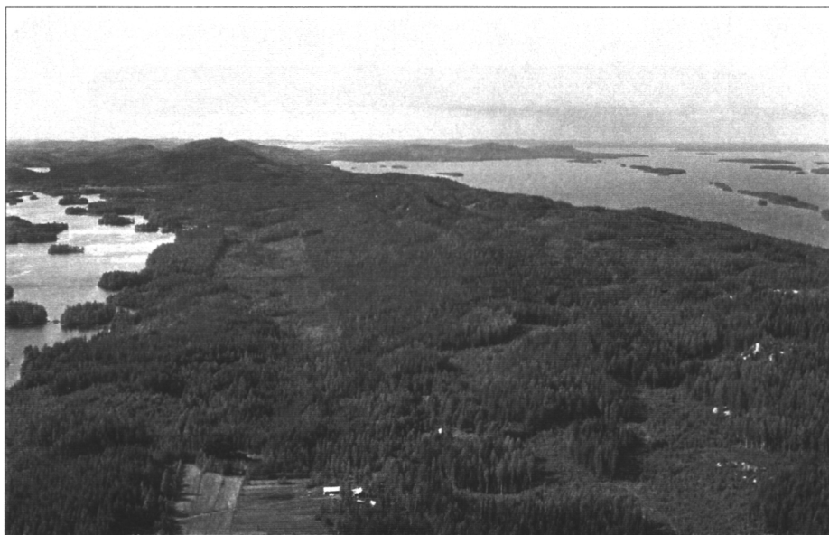
Kuva 5. Kolin kansallispuisto etelästä Vesivaaralta pohjoiseen. Vasemmalla Herajärvi, oikealla Pielinen harjusaarineen. Ukko- ja Akka-Kolin huiput siintävät horisontissa.

Huhtikuussa v. 1991 Kolin kansallispuisto perustettiin 1152 hehtaarin suuruisena ja tunteet alkoivat viiletä. Seuraavana vuonna Metsäntutkimuslaitos asetti työryhmän laatimaan Kolin kansallispuiston hoito- ja käyttösuunnitelman (runkosuunnitelman), mikä valmistui v. 1993. Kolin kansallispuiston tutkimuksen koordinointi ja tutkimuksen laajentaminen sekä polkuverkoston parantaminen palveluineen myös ns. laajennusosan alueelle aloitettiin. Vuonna 1995 kansallispuiston alueella laskettiin koko vuoden aikana kävijämääräksi n. 100 000 henkilöä.