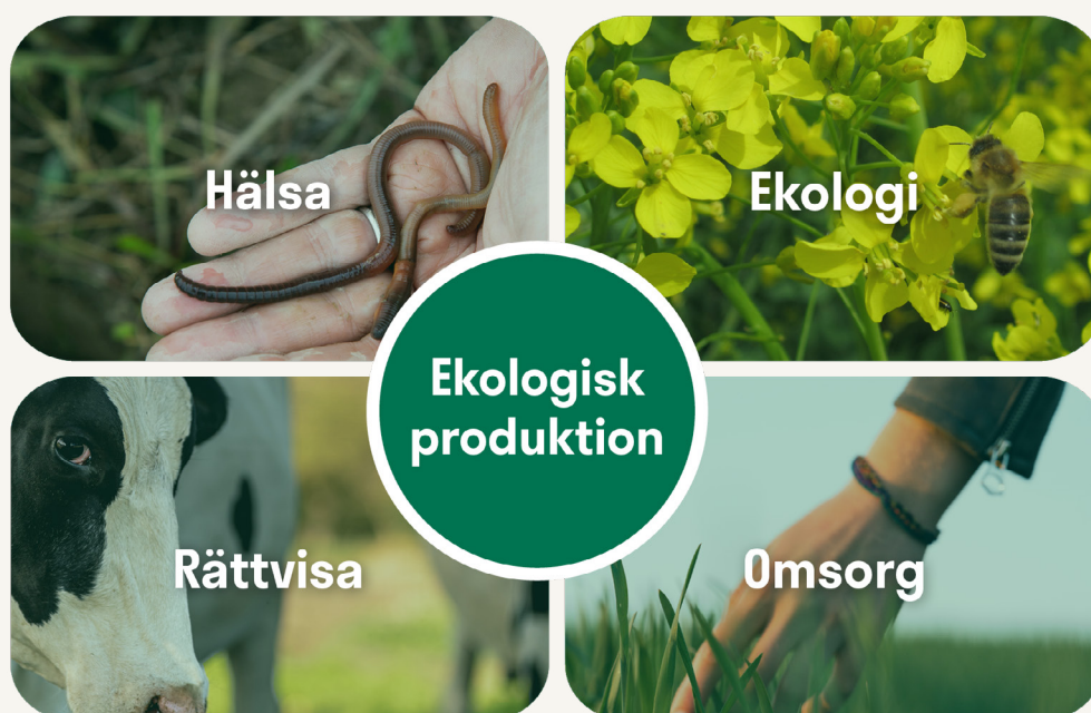
Figur 2. Principen för ekologisk produktion bygger på ekologisk, social och ekonomisk hållbarhet. Denna övergripande hållbarhet utgår från fyra huvudprinciper, vilka är hälsa, ekologi, rättvisa och omsorg. Hälsa fotot: Hanna Koikkalainen. Ekologi fotot: Marjo Hokka. Rättvisa och Omsorg fotona: Envato.

Ekologisk produktion bygger på den internationella paraplyorganisationen för ekologisk produktion IFOAMs (2024) fyra principer för produktionen, vilka är hälsa (Health), ekologi (Ecology), rättvisa (Fairness) och omsorg (Care) (figur 2). Syftet är att framställa ett tillräckligt utbud av mat av god kvalitet, på ett rättvist sätt som tar hänsyn till hälsan hos människan, djuren, växterna och miljön. I Finland har Rajala (2006) räknat upp de ekologiska principerna.