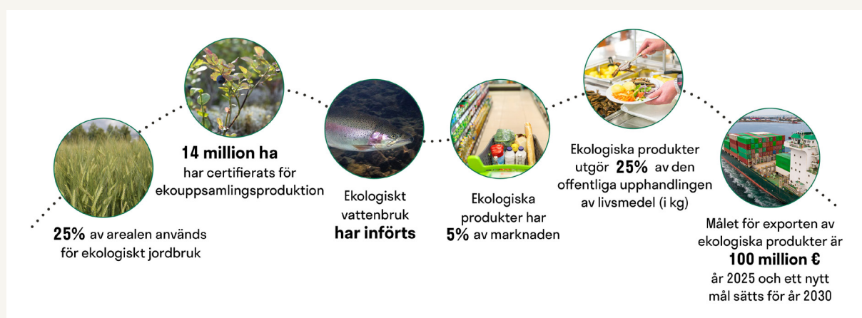
Figur 1. Målsättningarna enligt Luomu 2.0 – Finlands nationella ekostrategi för 2030 (MMM 2021).

Forskningsmålen som här presenteras har utformats i ett nära samarbete med aktörer inom ekologisk produktion. I början av 2024 genomfördes en webbenkät, som besvarades av 37 representanter för företag, odlare, rådgivare, forskare, myndigheter och andra parter inom ekoproduktion. Under våren 2024 hölls tre workshoppar; den första ordnades