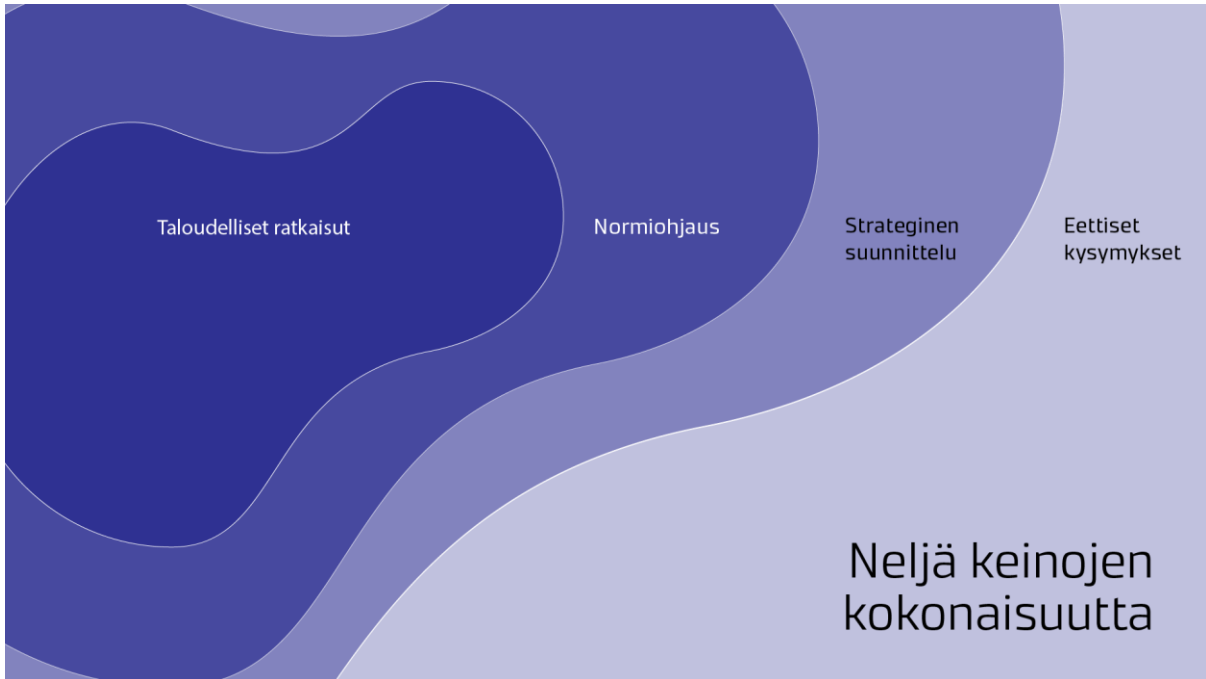
Kuva 2. Ennakkokyselyllä kartoitettiin neljä asiakokonaisuutta, joita käytettiin keskustelujen rakenteena.

Ennen ensimmäistä tilaisuutta osallistujille lähetettiin ennakkokysely (liite 1), jolla kartoitettiin heidän näkemyksiään yksityismaiden luontokadon suurimmista esteistä ja mahdollisista ratkaisuista. Kyselyn vastauksista tunnistettiin ja visualisoitiin keskeisiä kipupisteitä lämpökarttoiksi (liite 2). Nämä lämpökartat toimivat pohjana ja visuaalisena tukena keskustelujen käynnistämässä.