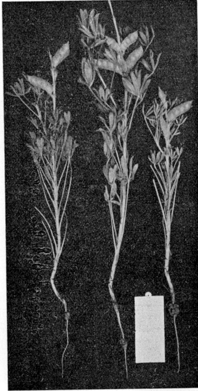
Kuva 2. Keltalupiiniyksilöitä. Bild 2. Einzelne gelbe Lupinen.