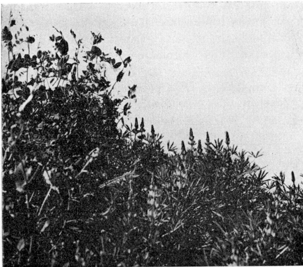
Kuva 1. Artturi-rehuherneellä oli jo paksut palot, kun keltalupiini alkoi kukkia.

V. 1938 järjestettiin kokeita sekä hiekka- että savimaalle. Eräässä savimaalle järjestetyssä koesarjassa, jossa tutkittiin kylvöajan ja kylvötavan vaikutusta lupiin siemensadon määrään, käytettiin kylvösiemenenä v. 1937 suoritetuissa kokeissa saatua siementä. Touko-