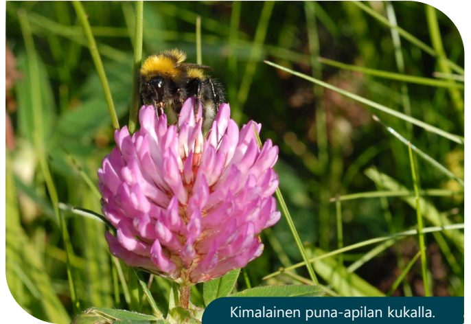
Kimalainen puna-apilan kukalla.

Puna-apila on syväjuurinen monivuotinen valkuaispitoinen nurmipalkokasvi ja erinomainen rehu märehittäjille. Puna-apila on myös paljon muuta. Se pystyy sitomaan ilmasta typpeä juuriston nystyröissä elävien typensitojabakteerien avulla, eikä siten tarvitse väkilannoitetyyppeä. Puna-apila parantaa maan rakennetta ja lisää maan orgaanisen aineen määrää, sen viljely edistää luonnon monimuotoisuutta ja hyödyttää pölyttäjiä, lintuja sekä maan mikrobeja. Puna-apilaa viljellään tavallisimmin heinäkasvien kanssa seoksena säilörehu- ja viherlannoitusnurmissa. Puna-apilaa ja muita apiloita voidaan viljellä myös viljan aluskasvina sitomaan typpeä ja suojaamaan maan pintaa eroosiolta.