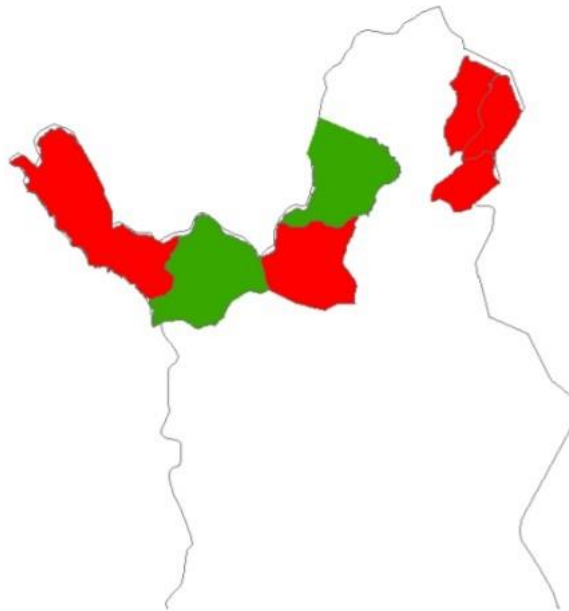
Kuva 3. Ahmakannan laskenta-alueet kolmen pohjoisimman kunnan alueella. Punaisen alueet lasketaan parillisina ja vihreät parittomina vuosina

Kolmen pohjoisimman kunnan alueella suoritetaan laskentoja viidellä alueella. Parillisina vuosina lasketaan kolme, parittomina kaksi aluetta (Kuva 3). Laskennat koordinoi Metsähallitus, joka toteuttaa laskennat yhdessä alueen paliskuntien kanssa. Aluelaskentoja on tehty vuodesta 2001 lähtien. Laskentaviikon aikana pyritään selvittämään alueen ahmojen lukumäärä mahdollisimman tarkoin etsimällä jälkiä ja seuraamalla niitä mahdollisimman pitkään erin eläinyksilöiden erottamiseksi toisistaan. Yhdistämällä vuoden 2020 kolmen laskenta-alueen ja vuoden 2021 kahden laskenta-alueen tulokset saatiin arvio viiden laskenta-alueen ahmojen kokonaismäärästä. Vuoden 2022 laskentoja häittäsivät merkittävästi hankalat sääolot. Laskenta-alueilla eleli yhteensä noin 30 ahmaa. Laskenta-alueiden ulkopuolelle jäävillä alueilla liikuskelii arviolta 6–15 ahmaa. Ylä-Lapin ahmakannaksi arvioitiin 35–45 yksilöä.