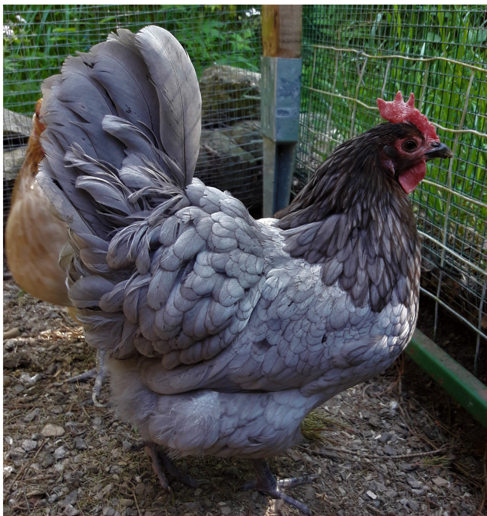
Harmaa on kanaparvien yleisimpänä värinä suhteellisen harvinainen.

Mitä useampi vastaa vuosiraportin kaikkiin kysymyksiin, sitä nopeammin tietoa kerääntyy. Tilastotieto auttaa kertomaan maatiaiskanoista on uusille ihmisille. Jokainen raporttivastaus antaa tärkeää tietoa maatiaiskanojen ominaisuuksista.