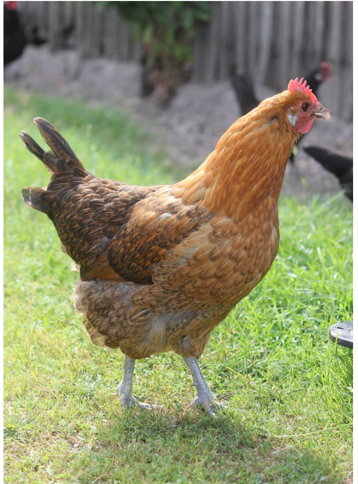
Hakulien Lilja-kana