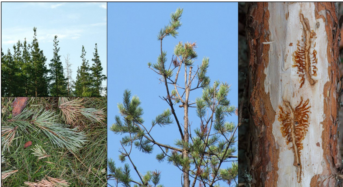
Kuva 1. Vasemmalla ja keskellä tyypillistä ytimennävertäjätuhoa: mäntyjä, joiden latvoista on pudonnut kasvaimia kasvainsyönnin seurauksena. Oikealla pystynävertäjän syömäkuvioita rungossa: pystysuuntaisia emokäytäviä ja niistä sivulle erkaantuvia toukkakäytäviä.

Maastotyöt pinoilla koostuivat kolmesta osasta: 1) pinojen tilavuuksien mittaaminen, 2) pinosta ulos tulleiden hyönteisten laskeminen sekä 3) hyönteisten aiheuttamien kasvaintuhojen mittaaminen. Pinojen tilavuudet mitattiin yleisesti hyväksytyillä pinomittausohjeilla. Ulos tulleiden hyönteisten määrät (hyönteisiä per m 2 ) arvioitiin 10 × 30 cm:n kokoisilta näytealoilta, joita mitattiin pinojen päältä, yksittäisistä tukeista (yht. 544 näytealaa). Kasvaintuhot ympärysmetsissä arvioitiin laskemalla pudonneita kasvaimia 1,78 metrin säteisiltä ympyräkoaloilta (~10 m 2 ). Koealat (yht. 222 kpl) mitattiin pinoista poispäin vedetyiltä linjoilta 10 metrin välein; uusia koealoja asetettiin aina 10 metrin päähän edellisestä, niin kauan kunnes pudonneita kasvaimia ei enää havaittu metsien normaalia taustatasoa (> 1 pudonnut kasvain per m 2 ) enempää.