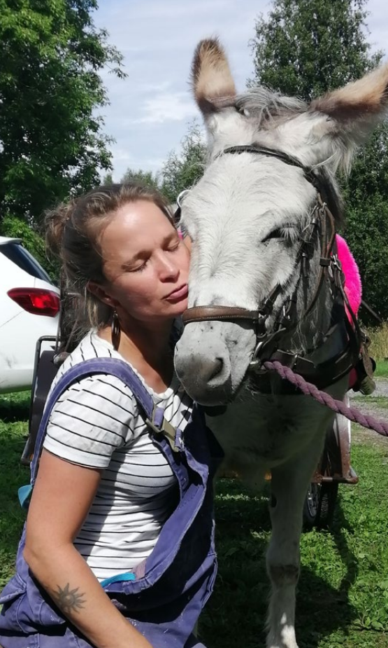
Kuva: Sininauhaliitto, Skatan tila.