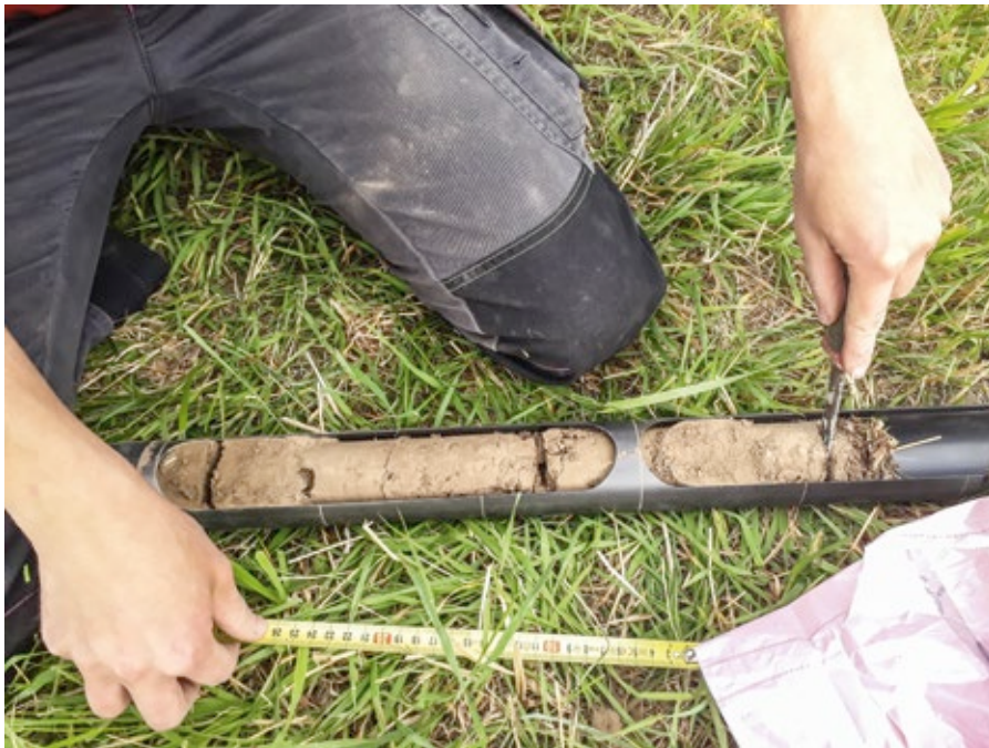
Kairaamalla otetut juurinäytteet pestään ja juuret erotellaan, kuivataan ja punnitaan. Lisäksi tehdään hiilipitoisuuteen ja sen laatuun liittyviä analyysejä.