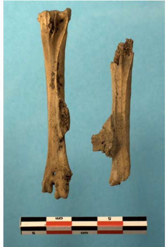
Kukon luita Turun Katedraalikoulun kaivauksilta. Vasemmalla luu, josta kannuskynsi leikattu pois. Kuvassa oikealla olevassa luussa kannuskynnen paikalla kasvaa sienimäistä, uutta luuta. Ehkä huonosti parantunut irronnut tai leikattu kynsi?

Kanoilla, kuten muillakin eläimillä, oli ihmisten elämässä myös muuta merkitystä kuin taloudellinen arvo. Aikaisemmassa suomalaisen maatiaiskan säilytysohjelman tiedotteessa (2013) kerrottiin rautakaudella Pirkkalan Tursiannotkon asuinpaikalle ruukussa haudatusta kukosta, jonka tarkoitus on saattanut olla suojelutauku tai uhri. Myös myöhemmin historiallisella ajalla kanoilla on ollut uskomuksellista tai rituaalista merkitystä. Arkeologisista aineistoista löytyy joskus kukon jalkojen luita, joista kannuskynsi on leikattu juurta myöten irti. Jos luussa näy minkäänlaista parantumista leikkauspinnassa, se on todennäköisesti tehty kukon