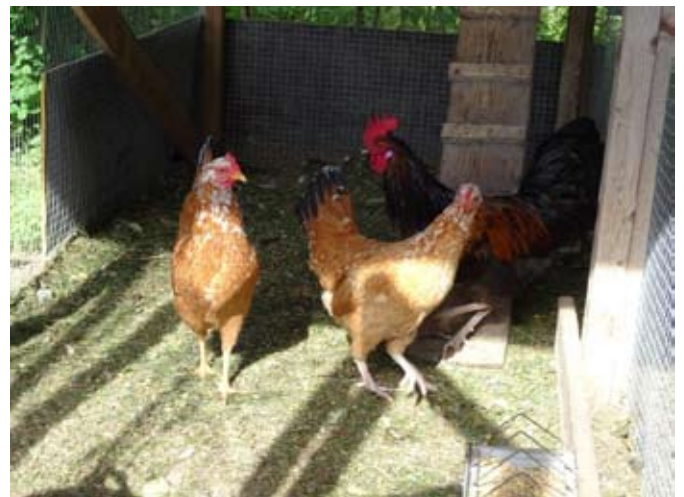
Ilmajokelaisia 2018.

Rekisterissä on vielä säilyttäjiä, joilla ei enää ole kanoja. Voisitko ystävällisesti ilmoittautua elainingenivarat@luke.fi , niin saadaan rekisteri ajan tasalle.