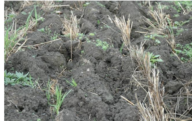
Kynnetty maahan jo elokuun alussa