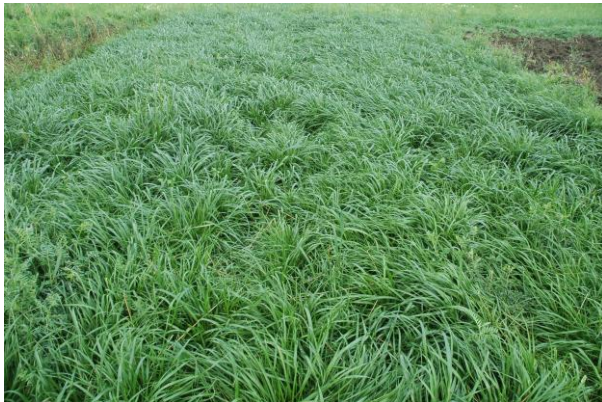
Seassa raiheinää, murskattu heinäkuussa