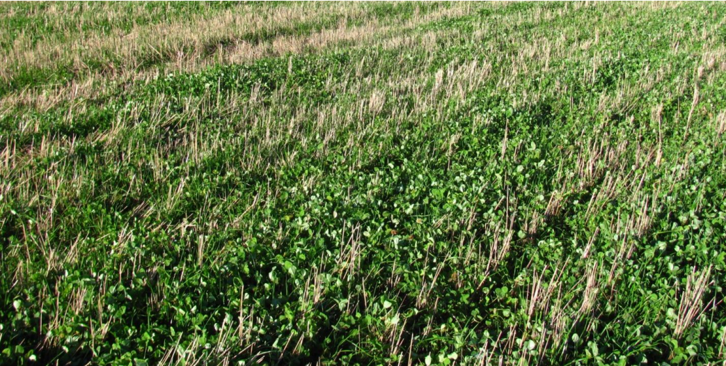
Koko pellon kattava kasvusto