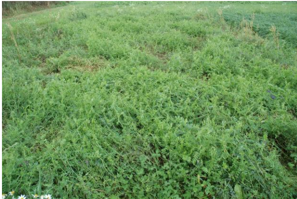
Virnakaura –seos jätetty kasvamaan