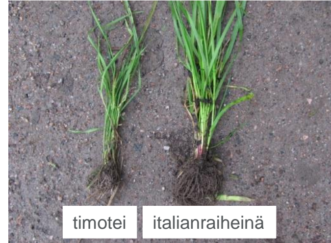
Tiheä juuristo koko syksyksi

Ravinteet kiertävät pellossa, joutumatta vesiin.