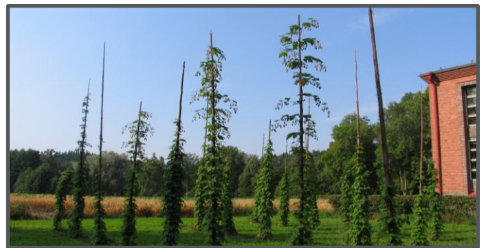
Kansallisen kasvigeenivaraohjelman humalakokoelma Mustialassa, Tammelassa.

Sukupuun haarat kuvaavat eri humalanäytteitä. Puun yläosassa on suomalaisia humalia, kun taas alaosassa keskieuropalaisia. Mitä kauempana haarat ovat toisistaan, sitä kaukaisempia humalat ovat perimältään toisistaan.