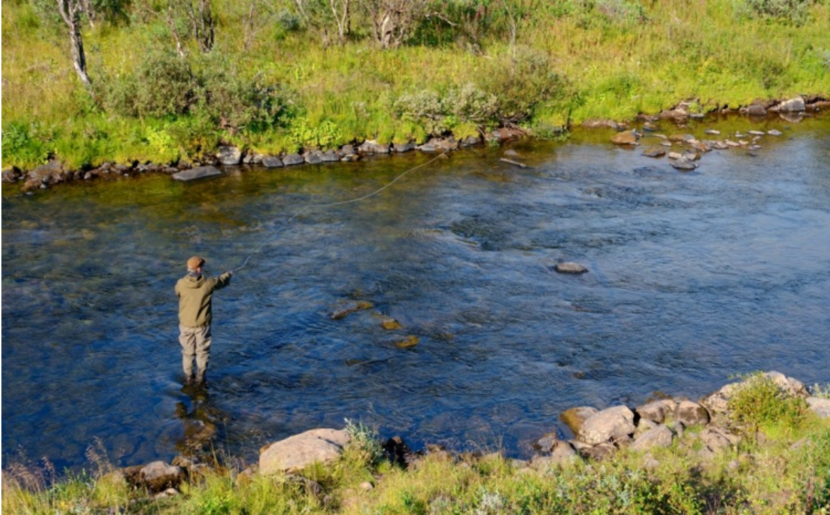
Kuva 4. Norjassa lohenkalastuksen säätely on vuodesta 2008 alkaen perustunut ns. kutukantatavoitteisiin, jotka ilmaistaan jokiin kudulle tarvittaen naarasemokalojen yhteispainona. Kutukantatavoitteet on määritetty yli 400 lohijoelle.