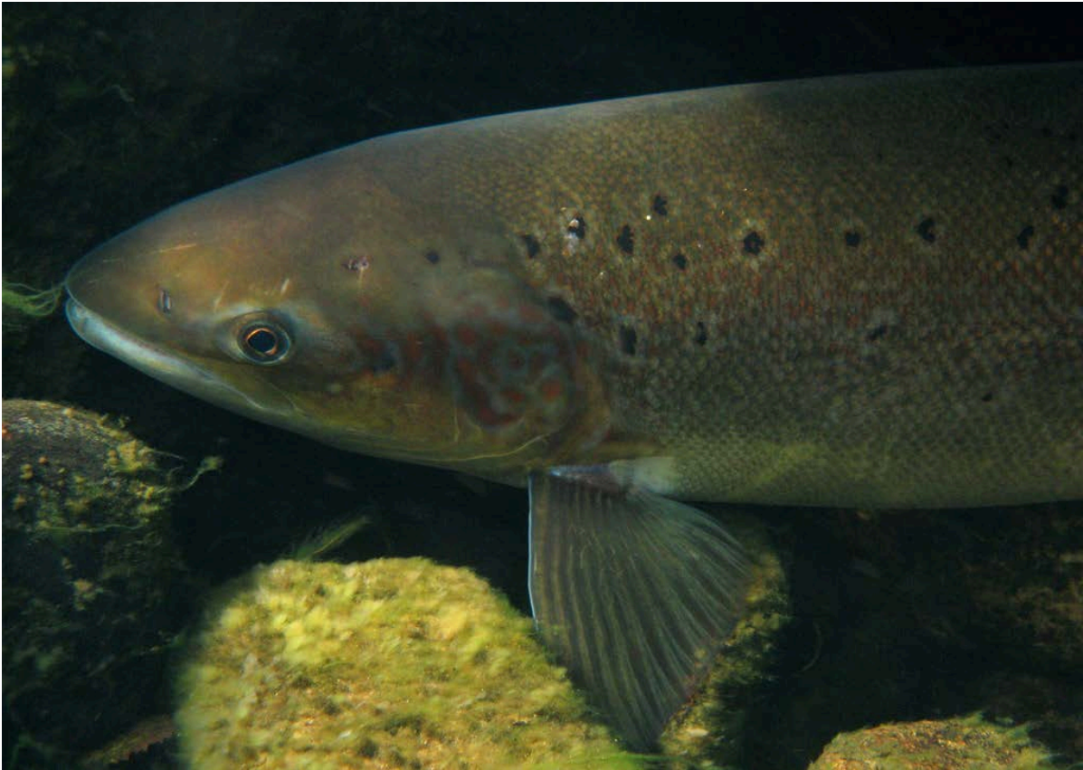
Kuva 2. Kutukantatavoitteet voidaan esittää tavoiteltavana naaraslohien yhteispainona tai mätimääränä pinta-alayksikköä kohden.

Lohikantojen runsaudelle voidaan määrittää useampia tavoitetasoja, jotka toimivat raja-arvoina kalastuksen säätelyä ja suojelua ohjaavassa päätöksenteossa (mm. DFO 2005, Gabriel & Mace 1999). Suojeluraja ("conservation limit", "limit reference point") on kannan koon vähimmäistavoite, joka lohien tapauksessa määritetään yleisesti MSY-tason pitkällä aikavälillä tuottavan kutukannan koon perusteella (esim. NASCO 1998, Gabriel & Mace 1999). Kannan tilan arviointiin ja ennustamiseen sekä itse vertailuarvon määrittämiseen liittyvien epävarmuuksien vuoksi on tärkeää määrittellä, kuinka suurella todennäköisyydellä suojelutaso tulisi saavuttaa. Varovaisuussyistä kannan on oltava useimmiten asetettua vähimmäistasoa suurempi, minkä vuoksi lohikannalle tulisi määrittää myös säätelytavoite ("management target", NASCO 2009). Säätelytavoitteen tulisi suurella todennäköisyydellä pitää kannan koko vähimmäistasoa suurempana, turvata sen pitkäaikainen elinkyky ja toimia siksi säätelypäätösten perustana (Garcia 1996). Esimerkiksi Norjassa lohikantojen säätelytavoitteeksi on asetettu keskimäärin 75 % todennäköisyys saavuttaa suojelutaso (kutukantatavoite, "spawning target") neljän vuoden aikajaksolla (Forseth ym. 2013). Tähän säätelytavoitteeseen ollaan pyrkimässä myös Tenojoen kahdenvälisessä kalastussäätelyssä Suomen ja Norjan kesken (Anon 2015).