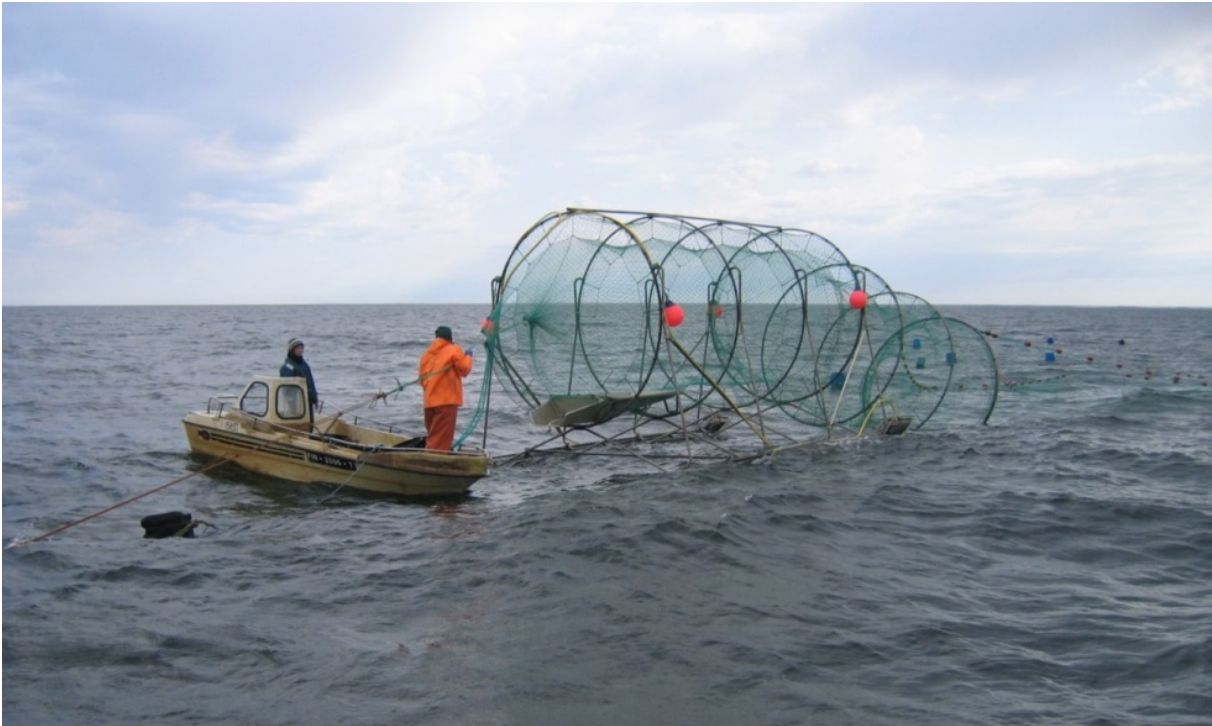
Kuva 1. Merialueella lohienkalastus on lähes poikkeuksetta sekakantakalastusta, jossa saaliiksi saadaan useiden eri jokien lohikantoja.