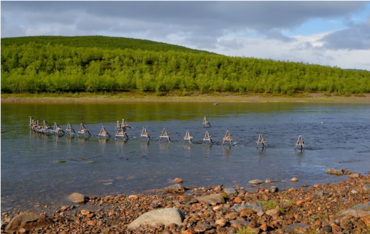
Kuva 5. Tenojoen pääuoman lohienkalastus on sekakantakalastusta, jossa saaliiksi saadaan useiden kymmenien eri sivujokipopulaatioiden lohia. Tietopohja Tenon heikkojen lohikantojen suojelemiseksi on kuitenkin nykyään hyvä geneettisten tutkimuksien ansiosta.

Mikäli Suomessa nähdään tarpeelliseksi siirtyä kantakohtaiseen kalastukseen, on ensin hankittava tarvittava tietopohja niistä kannoista, joihin kalastus kohdistuu. Kantojen geneettinen tunnistaminen on edennyt viimeisen 10 vuoden aikana huomattavasti, mutta kattavia baseline-aineistoja puuttuu edelleen useista uhanalaisistakin lajeista ja kannoista. Kantakohtaisessa säätelyssä kalastusta kestävien ja suojeltavien kantojen luotettava tunnistaminen on säätelyn edellytys. Tämän lisäksi eri kantojen tai saman joen osakantojen kalastuskuolevuuden ajallisesta ja alueellisesta vaihtelusta tarvitaan tutkittua tietoa. Mikäli suojeltavia kantoja esiintyy suhteellisen paljon tietystä kalastuksessa, on sitä tarpeellista rajoittaa. Vastaavasti, mikäli kalastusta kestävää kantaa esiintyy tyypillisesti tietystä kalastuksessa, eikä uhanalaisia kantoja siinä esiinny, vahvaa kantaa voidaan kalastaa MSY-teholla.