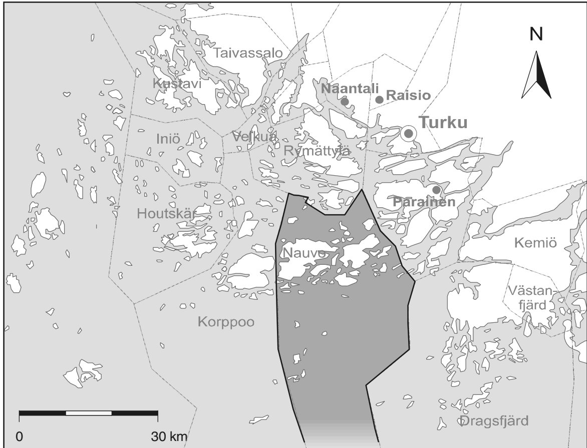
Kuva 1. Nauvon kalastusalueen sijainti Saaristomerellä.

le, jotka puolestaan jakavat rahat vesialueiden omistajille. Viehekalastuksen vapauttaminen on kohdannut voimakasta vastustusta etenkin maamme etelärannikolla ja saaristossa.