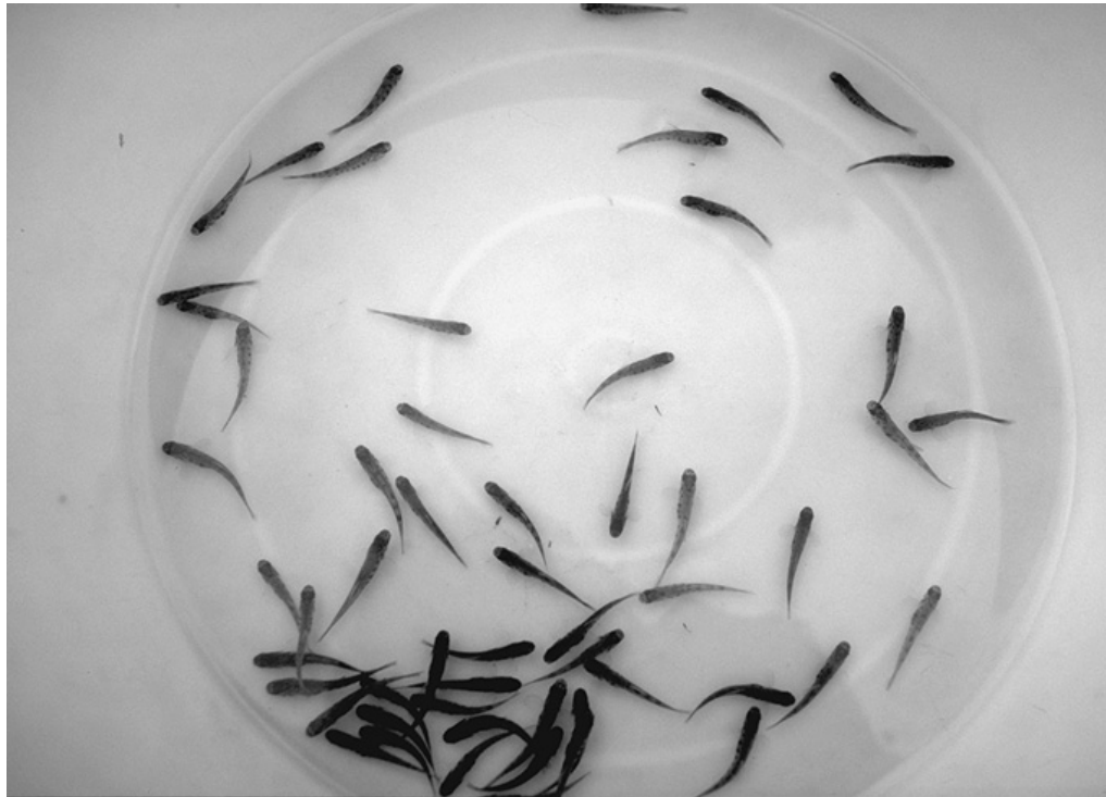
Päästön vaikutusalueelle oli istutettu mm. taimenen pienpoikasia.

Päästö on vaikuttanut myös alempana joessa tapahtuneisiin kalastomuutoksiin (kuva 1), vaikkei kaikkia muutoksia voida osoittaa tapahtuneen juuri kyseisen päästön vaikutuksesta. Petäjaskoskelta alaspäin vaikuttavat myös Hyvinkään Kaltevan puhdistamon jätevedet ja aikaisemmin on tapahtunut muita satunnaispäästöjä, mm. vuonna 1999 Ävikin alueella.