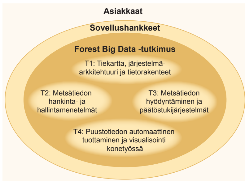
Kuva 2. Forest Big Data -hankkeen tutkimustehtävät (T1–T4). Tutkimuksen rinnalla on käynnissä sovellushankkeita, joiden avulla tuloksia tullaan hyödyntämään.