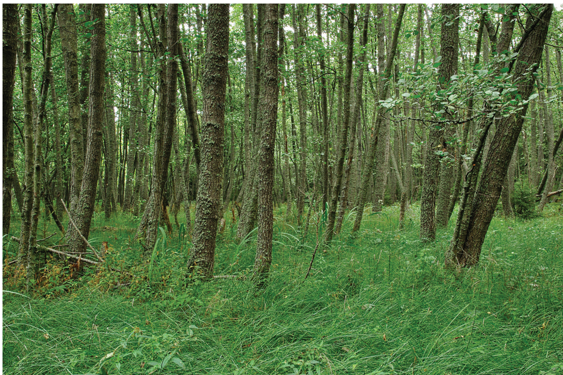
Kasvitieteellisessä järjestelmässä luhdat on oma päätyyppiryhmänsä. Metsäluhtiin kuuluva tervaleppäluhta; kasvillisuudessa mm. kurjenmieikka, mesiangervo, ranta-alpi ja korpikastikka. Metsätieteellisessä systeemissä kohde kuuluu tervaleppäkorpiin.

Yksityiskohtaisten kasvitieteellisten suotyyppien erottaminen vaatii hyvää kasvilajien tuntemusta. Näin on erityisesti letoilla, joilla vieläpä sammat ovat usein ratkaisevassa asemassa tyyppin määrittämisessä. Niinpä tarpeellista kirjallisuutta oppaan rinnalla ovat mm. Laineen ym. (2011, 2013) ja Väreen ja Laineen (2014) teokset. Laineen ym. (2013) määrittämisopas olisi saanut olla nyt uuden oppaan lähdeluettelossa. Nuo kaksi muuta siellä ovatkin. Kirjallisuusluetteloon olisi voinut lisätä Euroolan (1999) synteetin maamme kasvimaantieteestä. Siinä on paljon myös suoasiaa. Toki luettelossa on hyvä edustus soiden alueellista vaihtelua käsittelevästä kirjallisuudesta. Päivänen (1990) ”Suometsät ja niiden hoito” -kirjan asemesta luettelossa olisi tullut olla uudistettu ja laajennettu teos (Päivänen 2007).