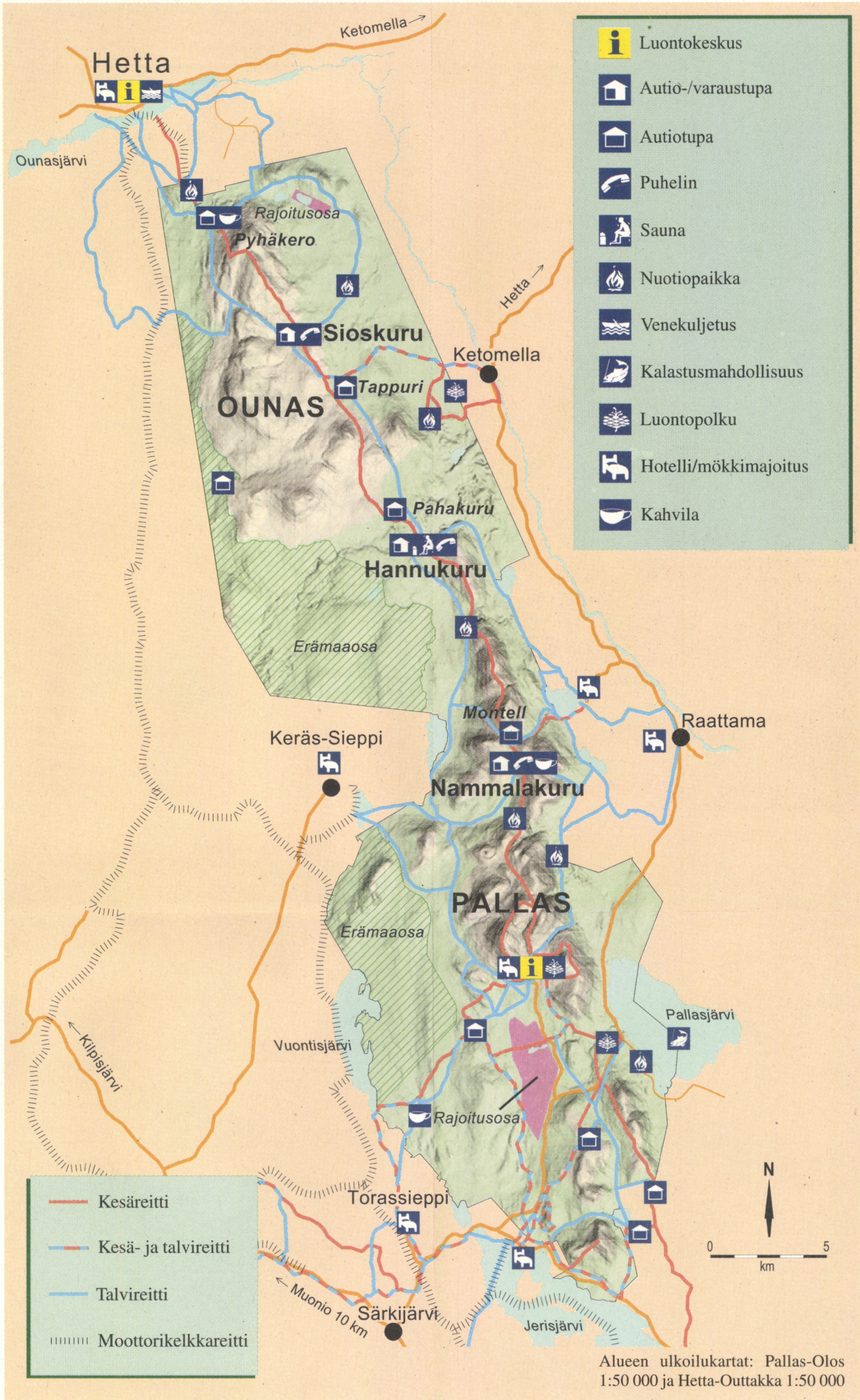
Alueen ulkoilukartat: Pallas-Olos 1:50 000 ja Hetta-Outtakka 1:50 000

Jokaisessa tuvassa on tupa-kansio, jossa kerrotaan tuvan tärkeimmät asiat.