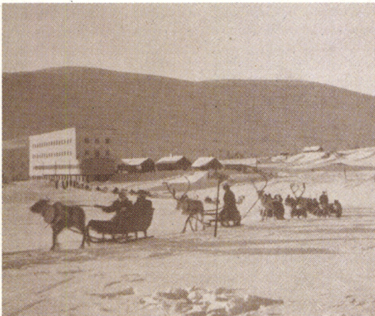
Hotelli Pallastunturin rinteellä 1938.