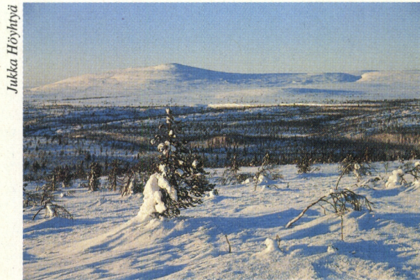
Ounastuntureiden keroista korkein on Outtakka (723 m).

Viimeinen suuri sopulivaellus kansallispuistossa oli 1969 ja seuraavaa ennustetaan ensi vuosituhannen vaihteeseen. Suurnisäkkäistä hirvi, karhu, ilves ja ahma liikkuvat alueella. Tunturien talvilintuja ovat riekko ja kiiruna. Kesäisin puisto on monien muuttolintujen pesimäaluetta.