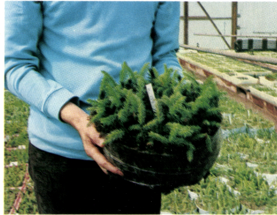
Kuusen pistokasoksia turverullassa