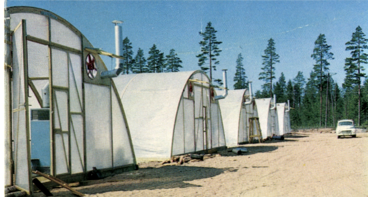
Röykan taimitarhan muovihuoneita

Osuuspankkijärjestö on luovuttanut seuraavat kääntösivun kartassa näkyvät maatilat Metsänjalostussäätiön käyttöön