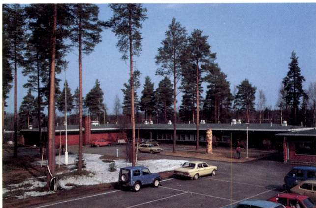
Muhoksen tutkimusasema on yksi METLAN kahdeksasta alueellisesta tutkimusasemasta.

Metsäntutkimuksen kehittämiseksi elintärkeitä Helsingin yliopiston jatko-opintomahdollisuuksia ei löydy muualta maasta.