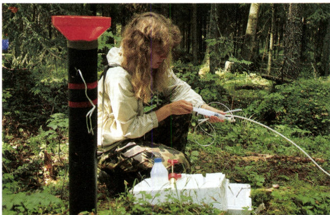
ILME-projektissa tutkitaan mm. ilman epäpuhtauksien vaikutusta metsämaan ominaisuuksiin.

Suomen metsäntutkimuslaitos on koko maan kattava, myös kansainvälisesti arvostettu ajanmukainen tutkimusorganisaatio. Sen luomalle tietopohjalle rakentuu tärkeintä uusiutuvaa luonnonvaraamme, metsää, koskeva metsäammattimiesten ja metsänomistajien käytännön päätöksenteko.