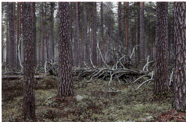
Koskematonta männikköä Häädetkeitaan luonnonpuistossa.