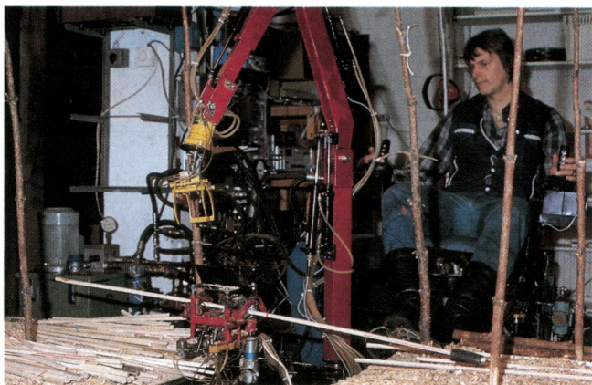
Suonenjoen tutkimusaseman metsäkonesimulaattorilla tutkitaan uusia koneideoita, kuljettajien koulutusta ja ergonomisia ongelmia.