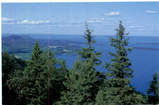
Die Landschaft in dem Versuchsgebiet Koli ist in Finnland recht bekannt.