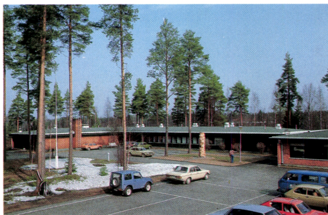
Die forstliche Forschungsstation in Muhos.