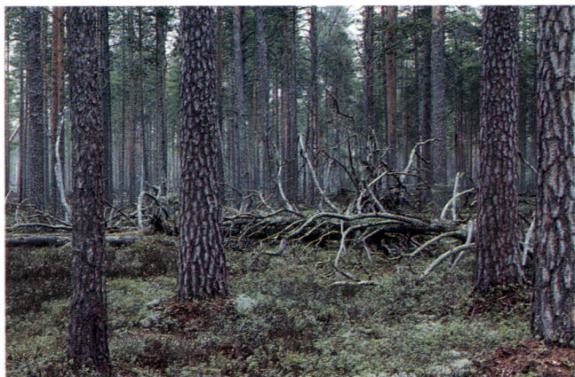
Unberührter Kiefernbestand in dem Naturpark Häädetkeidas.