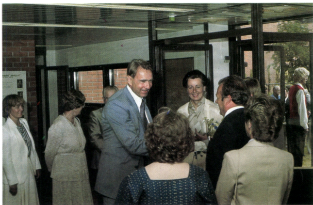
Präsident Mauno Koivisto und Frau Tellervo Koivisto zum Besuch in der forstlichen Forschungsstation Joensuu 30.7.1983.

Das Finnische Institut für Waldforschung ist eine international geschätzte, moderne Forschungsorganisation, die ganz Finnland deckt. Die praktischen Entscheidungen von Forstfachleuten und Waldbesitzern beruhen auf dem Wissen, das von dem Forstlichen Institut über den wichtigsten Naturbestand Finnlands, nämlich den Wald hervorgebracht wird.