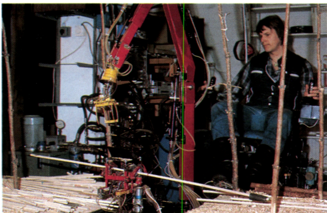
Der Forstmaschinensimulator in der Forschungsstation Suonenjoki untersucht neue Maschineninnovationen, Fahrerschulung und ergonomische Probleme.