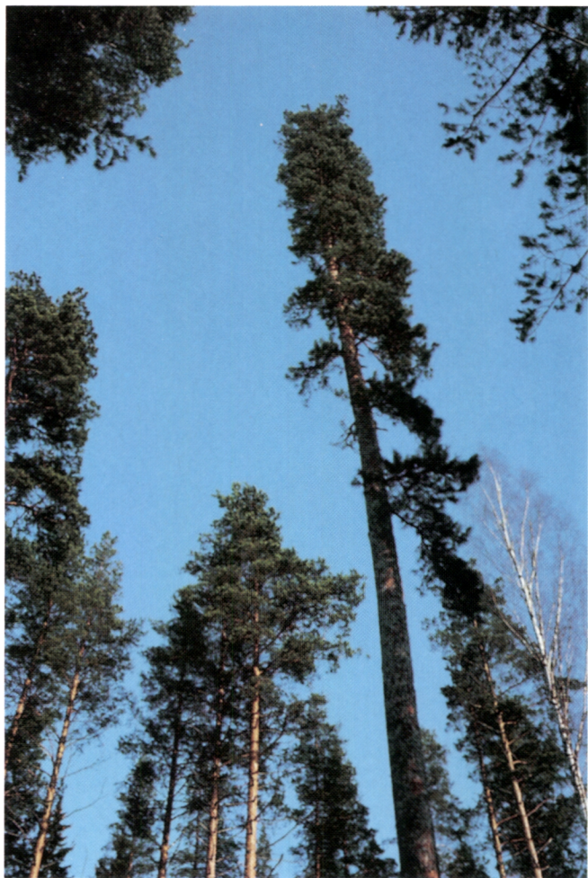
Kanervan mänty, pluspuu E 1101, on saanut lempinimen löytäjänsä, alue- metsänhoitaja Yrjö Kanervan mukaan.

puuyksilöiltä on edellytetty mm. seuraavia ominaisuuksia: keskimäärää selvästi suurempi tuotos, hyvä runkomuoto, pitkä ja tuuhea latvus, hennot oksat, suora oksakulma, ohut kuori. Koska nämä ominaisuudet ovat periytyviä, metsänjalostus on voinut tuottaa käytännön metsätaloudelle entistä parempaa