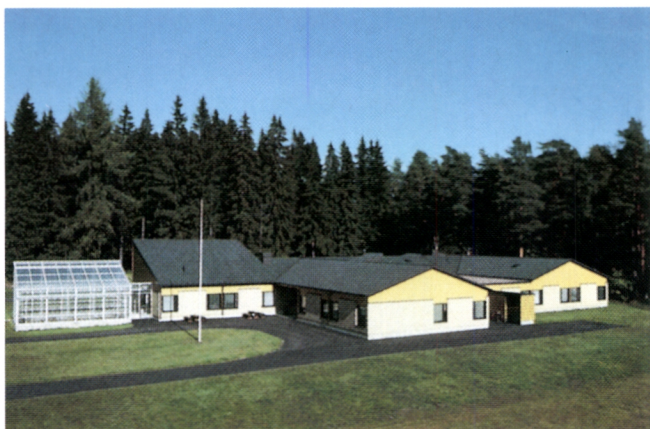
Metsäntutkimuslaitoksen Punkaharjun koeasema keskittyy toiminnassaan metsänjalostukseen.

Puulajipuisto on perustettu Punkaharjun rautatieaseman ja maantien läheisyyteen, jotta ulkolaisten puulajien kasvatuksesta kiinnostuneen olisi vaivatonta tutustua kokeilujen tuloksiin. Puulajipuistossa on 47 ulkolaisten puulajien muodostamaa