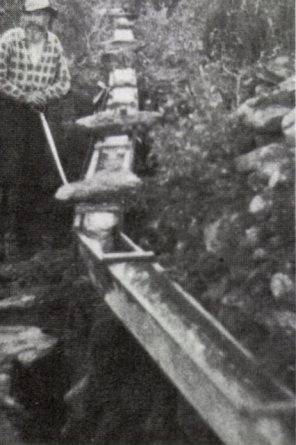
Morgamoja, kullankaivaja kaivoksellaan