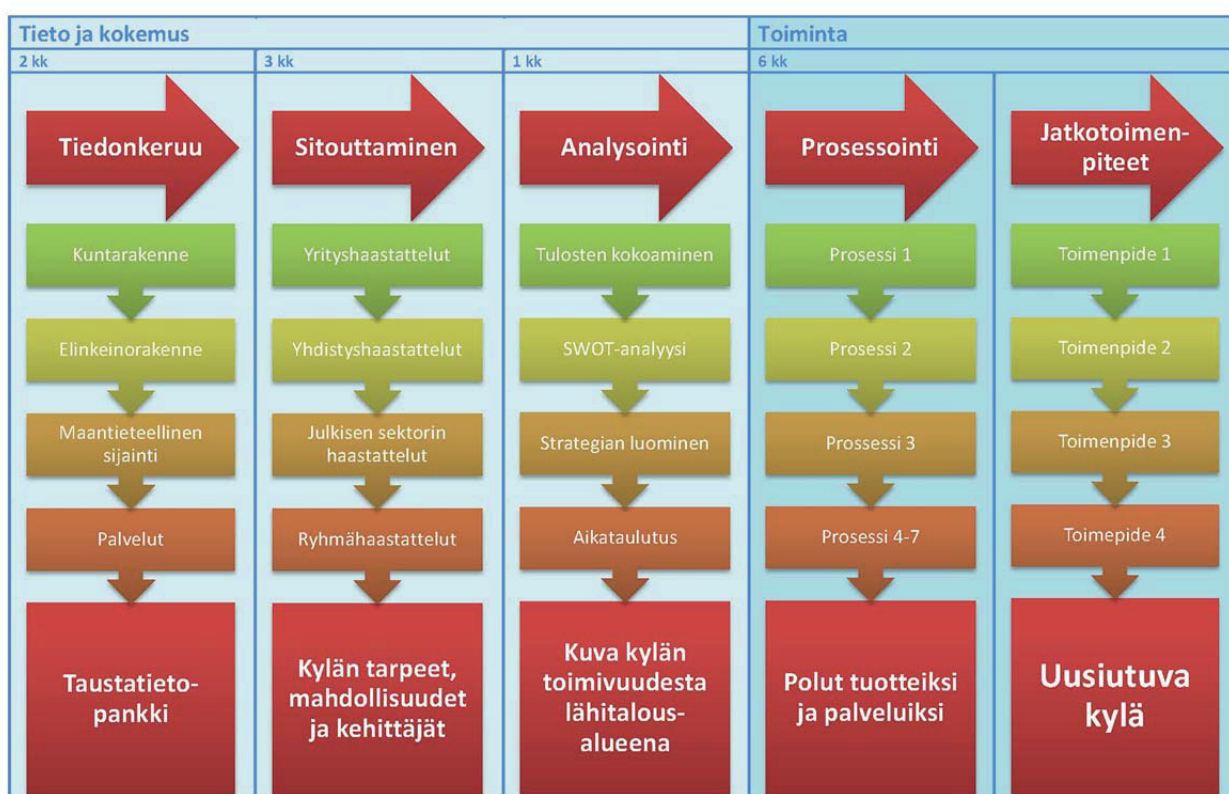
Kuva 2. Uusiutuva kylä -kehittämisen prosessi