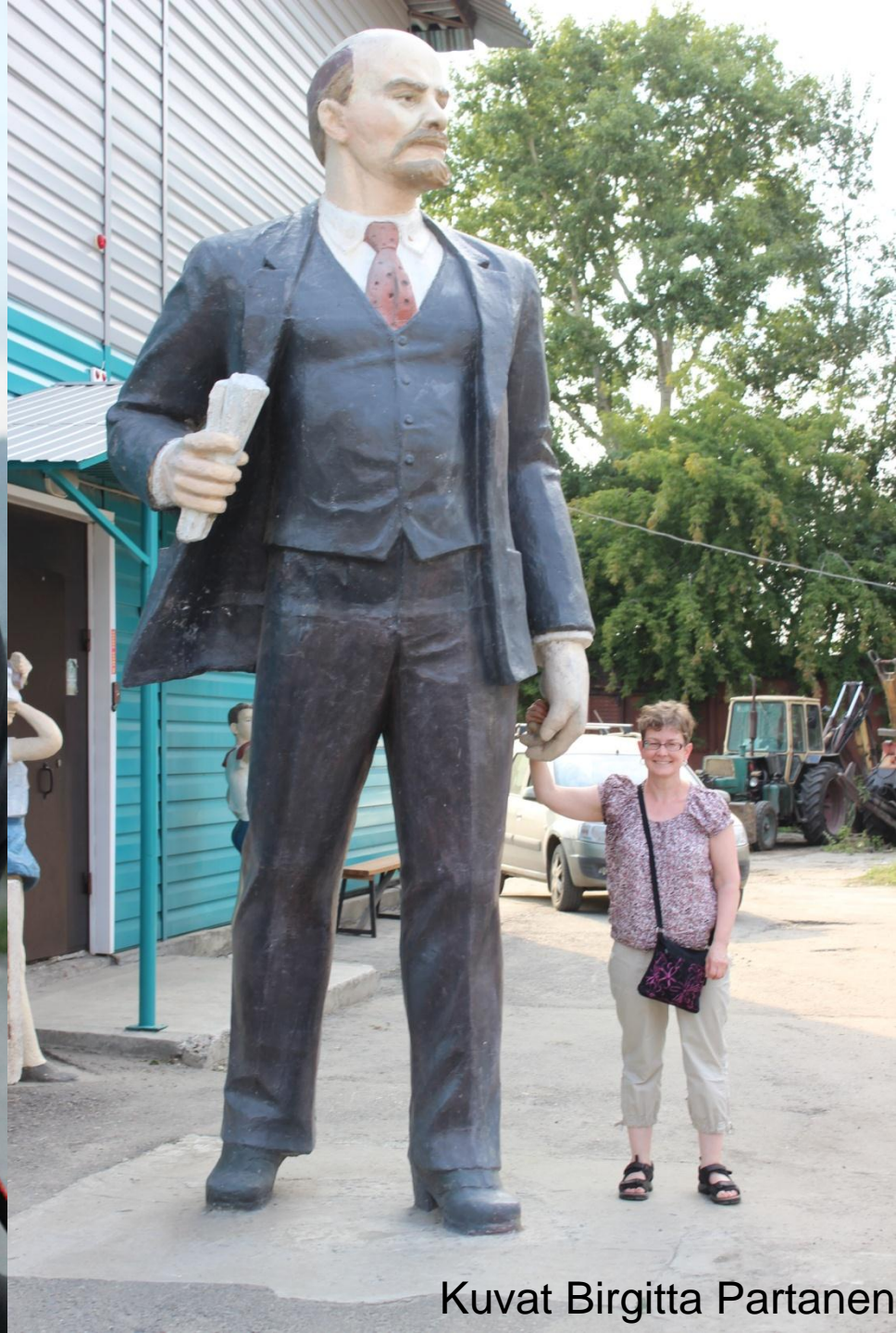
Kuvat Birgitta Partanen