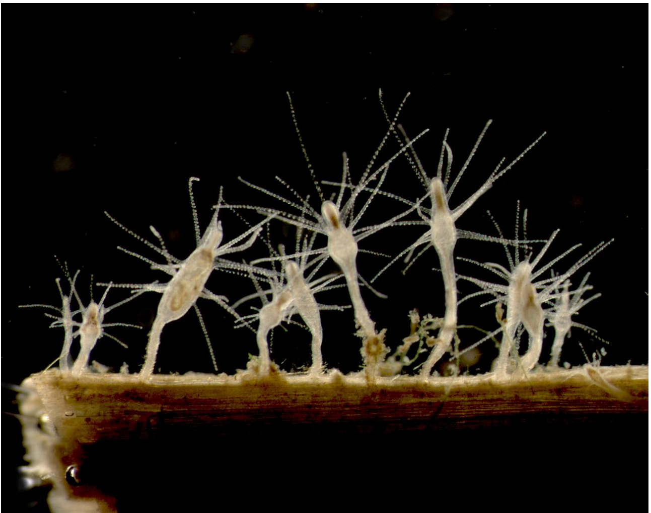
Kaspianpolyyyppi ( Cordylophora caspia), Itämeren haitallinen vieraslaji.