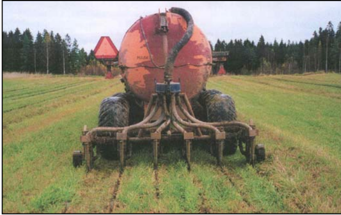
Lietelanta sijoitettiin nurmeen Teho-Lotina- lietemultaimella