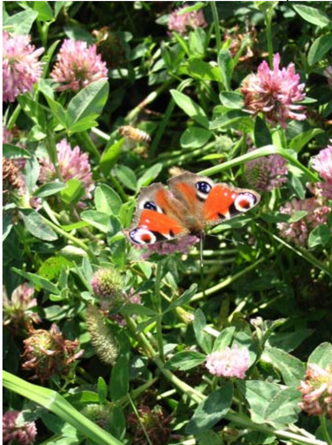
Neitoperhonenkin viihtyy apilakesannoilla.