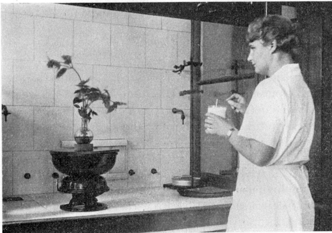
Kuva 2. Koe, jonka tarkoituksena on selvittää kasvinsuojeluaineen ruiskutusvioletuksia aiheuttavia ominaisuuksia. Koekasvi, Galisona parviflora , on pyörivällä alustalla. Sitä ruiskutetaan fikseerausruiskulla, jota käyttää pieni sähkömoottori. Valokuvattu samassa paikassa kuin kuva 1. Orig.

Virallisesti tarkastetuissa kasvinsuojeluaineissa ei yleensä ole todettu suuria virheellisyyksiä. Tämä johtuu siitä, että Saksassa ovat kasvinsuojeluaineiden valmistajina useissa tapauksissa suuret kemialliset teollisuuslaitokset. Tällaisten laitosten intresseihin kuuluu, että niiden tuotteita kohtaan ei ilmene moitteita. Useilla suurimmilla kasvinsuojeluaineita valmistavilla teollisuuslaitoksilla on sitäpaitsi omat tutkimuslaboratorionsa, joissa aineiden ominaisuuksia kokeil-