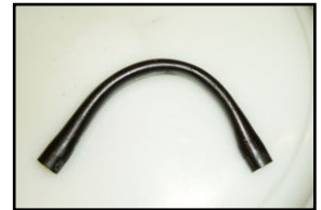
Litistynyt letku on kadottanut pumppauskykynsä

pesuainepurkista. Pumppausletku kadottaa kuitenkin ajan myötä elastisuutensa ja jää litteäksi. Tästä johtuen sen pumppauskyky pienenee ja pesuainetta annostellaan liian vähän. Harvoin käytettynä letku voi myös liimautua yhteen. Pumppausletkujen yleinen vaihtovälisuositus on yksi vuosi.