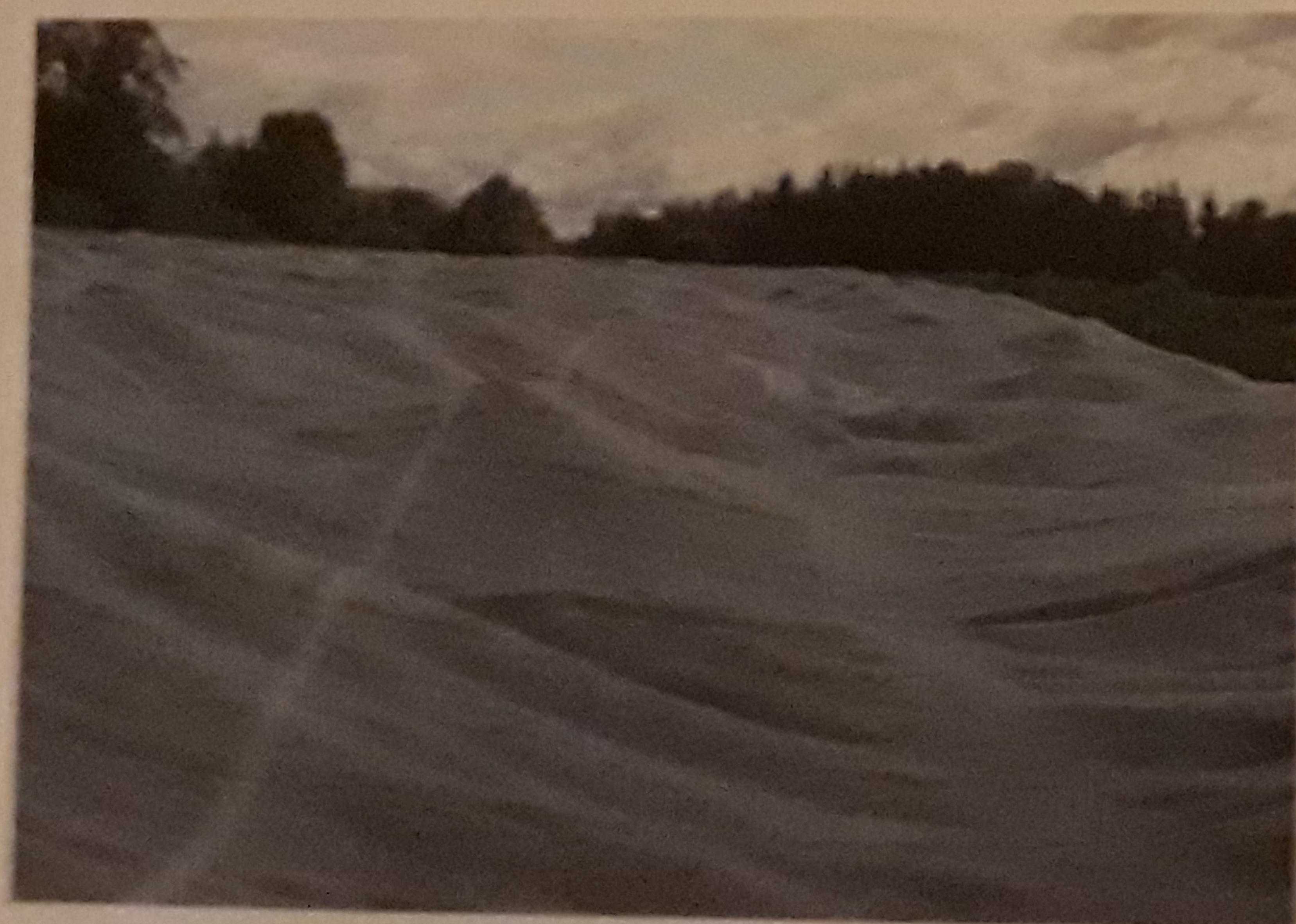
Et till är lättare att hantera än hand.

Den sista skörden kan ta med sig och allt till exempel med en skördare.