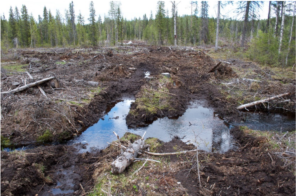
Kuva 3. Syvät ajourat lisäävät eroosioriskiä ja siten kiintoaineen ja elohopean huuhtoutumista. Kuva Ruotsista.

Typen (N) ja fosforin (P) huuhtouma metsätalousmaalta vesistöön on yleensä vähäistä. Se voi kuitenkin lisääntyä päätehakkuun tai lannoituksen jälkeen ja aiheuttaa alapuolisten vesistöjen rehevöitymistä. Eroosio ja kiintoaineen huuhtoutuminen voivat lisääntyä kunnostusojituksen tai maanmuokkauksen jälkeen. Samoin voi tapahtua, jos metsäkoneella ajetaan ranta-alueella, sillä ajouria pitkin kiintoaine voi kulkeutua suoraan vesistöön (kuva 3). Huuhtoutuneen kiintoaineen sedimentoituminen saattaa vahingoittaa vesieliöitä, jotka ovat kiinnittyneet vesistöjen pohjaan tai joiden lisääntymiselin ympäristöjä kiintoaine peittää. Lisäksi kiintoaineeseen voi olla sitoutuneena ravinteita ja raskasmetalleja. Joidenkin metsänkäsittelytoimien on havaittu edistävän metyylielohopea tuotantoa ja liikelle lähtöä maaperästä ja siten lisäävän kokonaiselohopean huuhtoutumista vesistöihin.