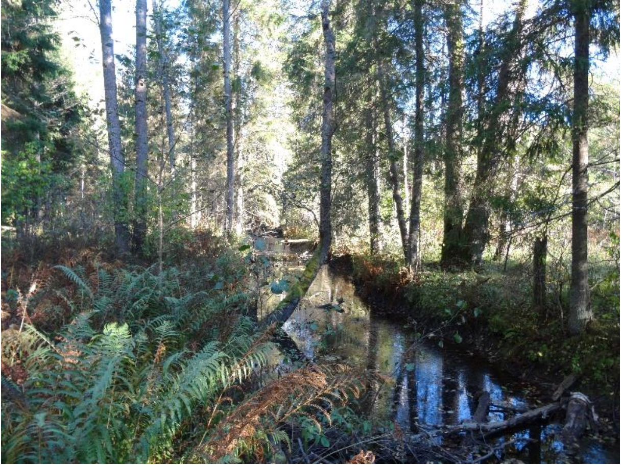
Kuva 2. Kaikki pienvedet koosta riippumatta tarvitsevat suojelua. Kuva keskisestä Latviasta Zalvītesta.