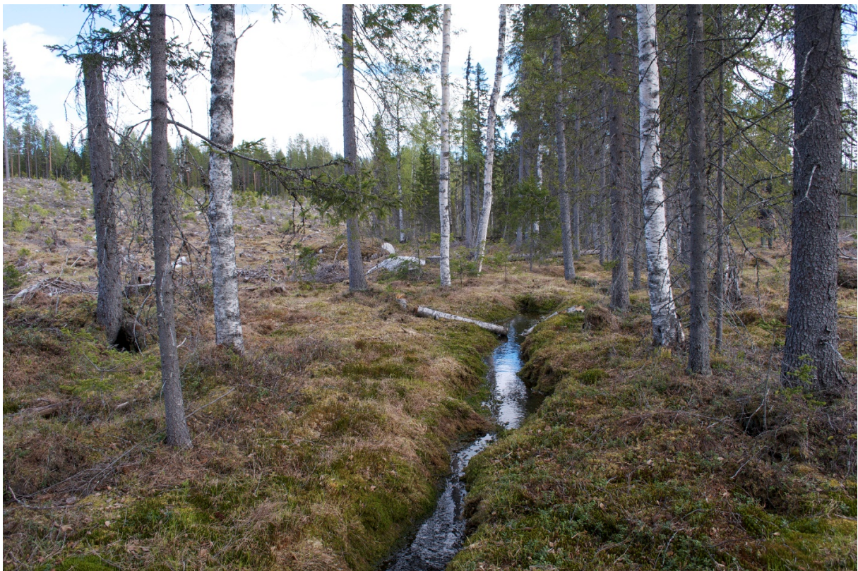
Kuva 1. Päätehakuussa (kuvassa vasemmalla) puron varteen jätetty suojavyyhyke. Kuva on Pohjois-Ruotsista.

Valuma-alue on maantieteellinen alue, jolta vesi virtaa tiettyyn vesistöön.