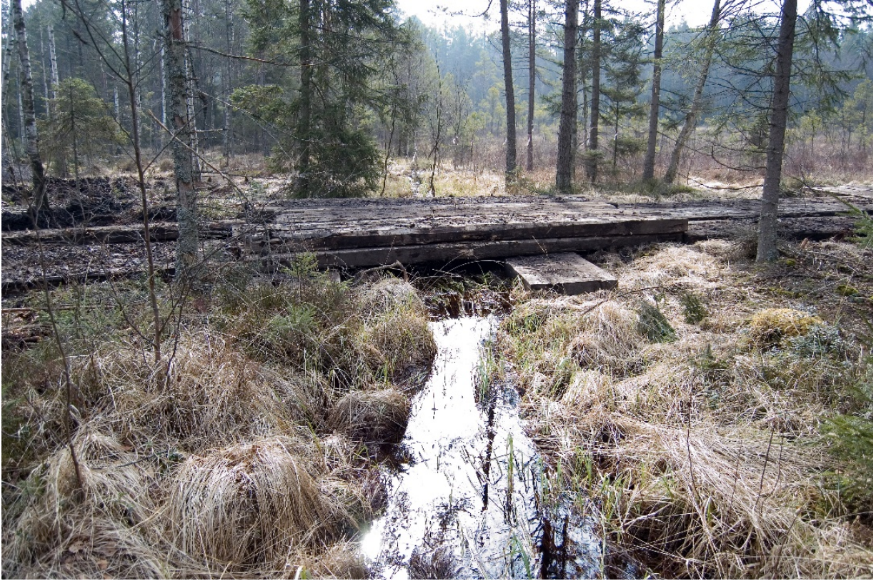
Kuva 5. Esimerkki tilapäisestä sillasta Ruotsissa.