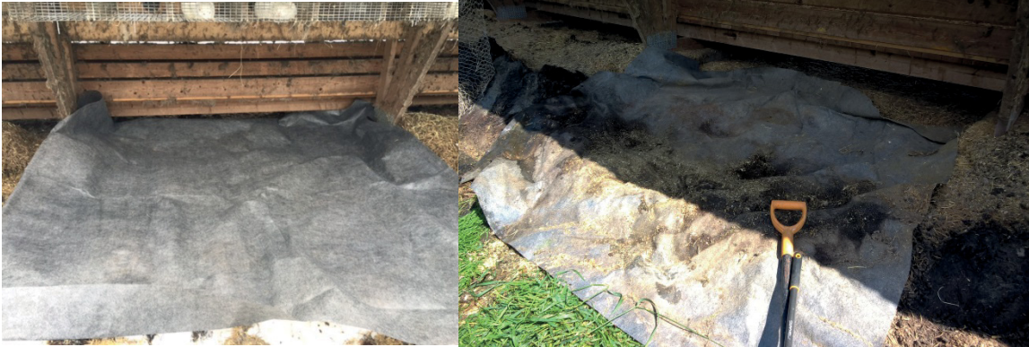
Kuva 1. Häkkisarjan alle levitettiin ennen seurantajakson aloitusta suodatinkangas (vas.), joka erotti lannan ja kuivikkeet pohjahiekasta. Suodatinkankaan ansiosta lanta pystyttiin keräämään mittaukseen tarkasti (oik.; Kuvat Maarit Hellstedt, Luke)

Lannoista otettiin punnituksen yhteydessä osanäytteistä koostuva, edustava analyysinäyte, josta määritettiin kokonaistyyppi, liukoinen tyyppi, kalium, fosfori ja kuiva-aine. Lanta-analyysejä teki Suomen ympäristöpalvelu Ahma (Oulu). Ensimmäisen seurantajakson aikana häkkien alle kertynyt lanta palautettiin sen määrän ja tilavuuspainon mittauksen jälkeen takaisin häkkien alle, mutta 2. ja 3. jakson mittauksessa lanta siirrettiin välivarastoon. Ensimmäisellä mittausjaksolla minkeiltä mitattiin erikseen häkkien alle pesistä pudonneet kuivikkeet ja häkkien reuna-alueen alle kerääntynyt lanta (Kuva 2). Toisella mittauskerralla lantamäärä mitattiin kuivikkeen ja sonnan seoksena. Ketuilla sonta ja kuivikkeet sekoittuvat jo häkkirivien alla (Kuva 2), joten niillä erottelua ei ollut mahdollista tehdä.