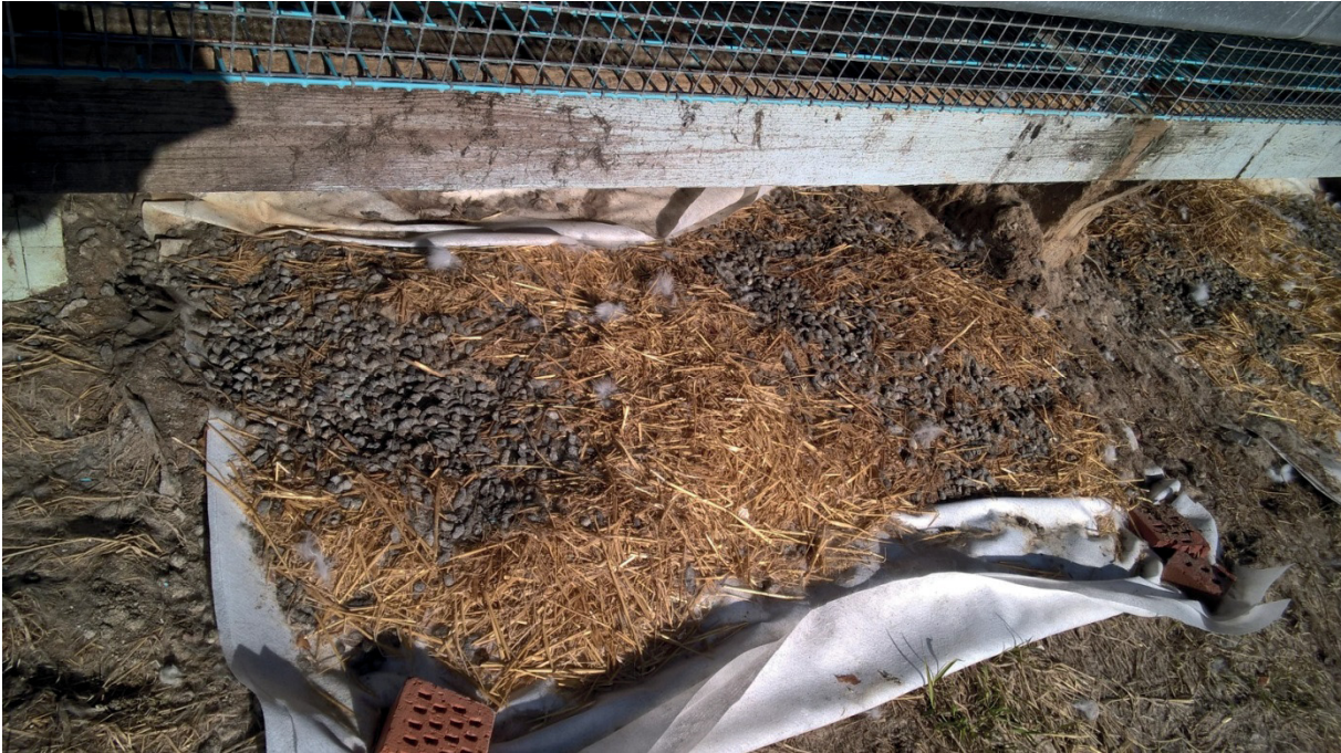
Kuva 3. Kettuhäkkien alla oli kolmannen seurantajakson jälkeen vain hyvin vähän lantaa kuivikkeiden pinnalla. Lanta oli varjotalon auringonpuoleisella sivustalla selvästi kuivempaa kuin varjon puolella.

Tarhaaja kirjasi ylös em. jaksojen kestoajat, tiedot käyttämänsä rehun koostumustiedot, ruokinnassa käytetyn rehun määrän ja kuivitukseen käytettyjen kuivikkeiden painon ja materiaalin sekä päivitti seuratuissa häkkisarjoissa olevien eläinten lukumäärää.