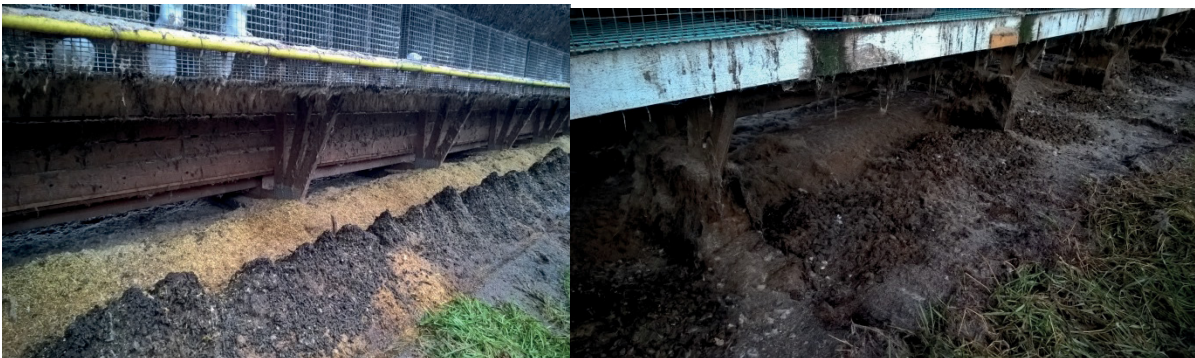
Kuva 2. Minkkihäkkien alla lanta oli tippunut varjotalon alle levitetyn kuivikkeen päälle. Lisäksi minkit tiputtivat pesäkuivikkeita ikään kuin toiseksi kuivikeriviksi (vas.). Ensimmäisellä mittauskerralla niiden määrä oli mahdollista mitata erikseen. Ketuilla lanta oli yhtenä seoksena (oik.).

Lannoista otettiin punnituksen yhteydessä osanäytteistä koostuva, edustava analyysinäyte, josta määritettiin kokonaistyyppi, liukoinen tyyppi, kalium, fosfori ja kuiva-aine. Lanta-analyysejä teki Suomen ympäristöpalvelu Ahma (Oulu). Ensimmäisen seurantajakson aikana häkkien alle kertynyt lanta palautettiin sen määrän ja tilavuuspainon mittauksen jälkeen takaisin häkkien alle, mutta 2. ja 3. jakson mittauksessa lanta siirrettiin välivarastoon. Ensimmäisellä mittausjaksolla minkeiltä mitattiin erikseen häkkien alle pesistä pudonneet kuivikkeet ja häkkien reuna-alueen alle kerääntynyt lanta (Kuva 2). Toisella mittauskerralla lantamäärä mitattiin kuivikkeen ja sonnan seoksena. Ketuilla sonta ja kuivikkeet sekoittuvat jo häkkirivien alla (Kuva 2), joten niillä erottelua ei ollut mahdollista tehdä.