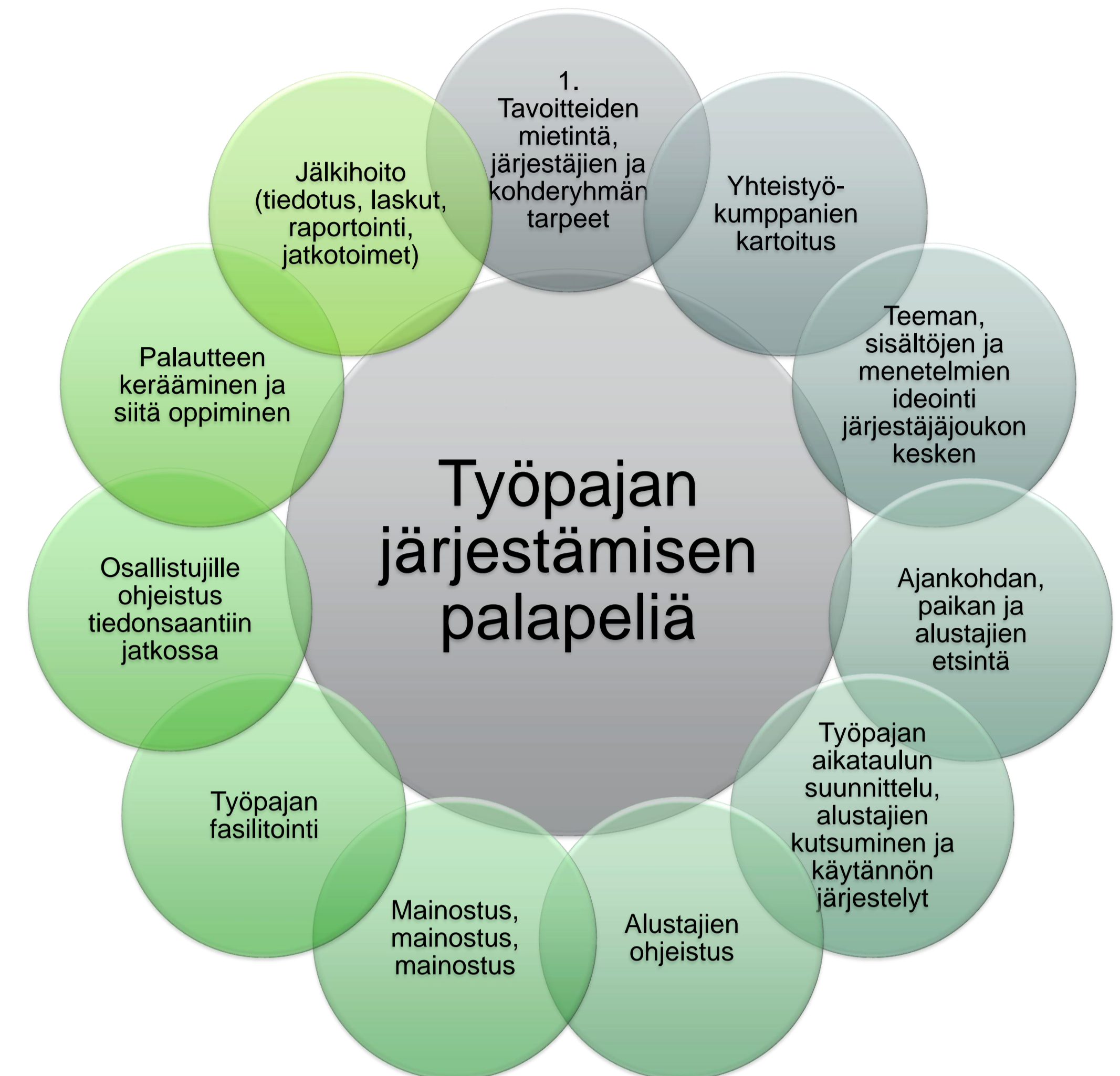
Kuva 1. ILMASE-hankkeen työpajojen järjestämisen palapeliä.

Viljelijöiden kokemuksia ja kokeiluja arvostettiin, samoin käytännön kenttäkokeita. Kohdevierailut koettiin hyvin antoisiksi. Tutkijaosallistujat kokivat saavansa työpajoissa uutta tietoa viljelijöiden ja hallinnon näkemyksistä. Alustukset vieraammistakin aiheista herättivät paljon uusia ajatuksia, jotka innostivat omiin mahdollisiin kokeiluihin.