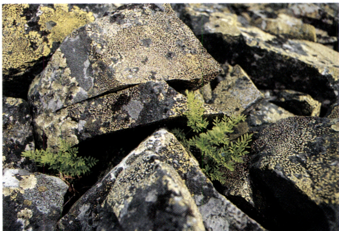
Karussa tunturikivikossa viihtyy harvinainen liesu.

Kivijäkälien tutkijalle tunturi saattaa olla aarreaitta. Niillä luonto on kirjonut eri värisiä ja monimuotoisia kuvioita tunturirakan pintaan.