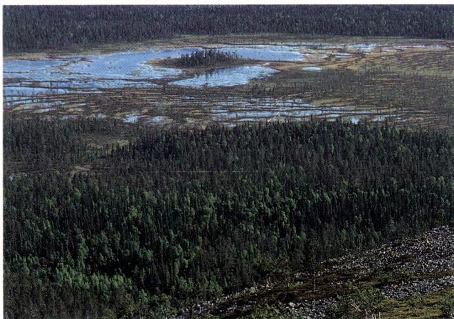
Kansallispuiston aapasuot kuuluvat Peräpohjolan laajaan aapasuovyöhykkeeseen. Näkymä Kultakerolta Tunturiaavalle.

Mutta kansallispuiston alue ei ole pelkkää rakkaista tunturia: löytyy aapasoi, eri metsätyyppejä, smaragdinvihreitä lampia, kirkkaita puroja ja vehmaita puronvarsilehtoja. Pyhätunturin kansallispuistosta onkin sanottu, että se on kuin Lappi pieniskoossa.