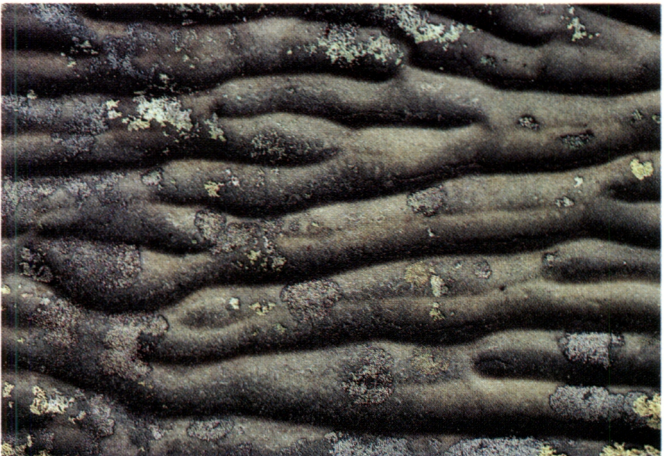
Muinaismeren aaltojen jäljet Pyhätunturin kvartsiitissa.

Se, mitä Pyhätunturista on nykyään jäljellä, on kovaa, kulutusta kestävää kvartsiittia, kerros kerrokselta muinaismeren pohja- ja rantahiekoista kasautunutta. Kerrokset ovat selvästi näkyvissä, paikoin vaakasuorina, joskus pystysuoraan kääntyneinä kerrospinkkoina. Joissakin kerroksissa näkyvät vieläkin muinaismeren aaltojen jäljet, samalla lailla kuin ne näkyvät nykyistenkin järvien rantahiekoissa.